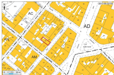
Plan masse et de situation, extrait de http://cadastre.gouv.fr IVR82_20136902155NUDA