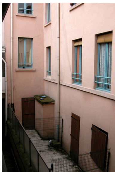
Vue de la cour et de l'élévation postérieure des corps de bâtiment depuis AD 15 IVR82_20046904085NUCA