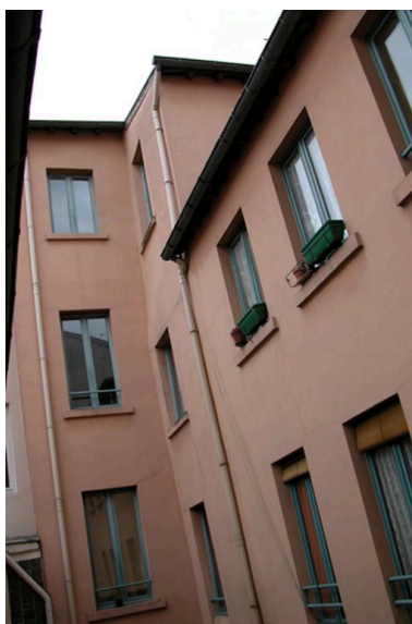
Elévations postérieures des corps de bâtiment depuis AD 15