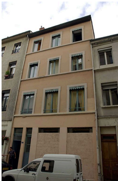
Vue générale IVR82_20036900498NUCA