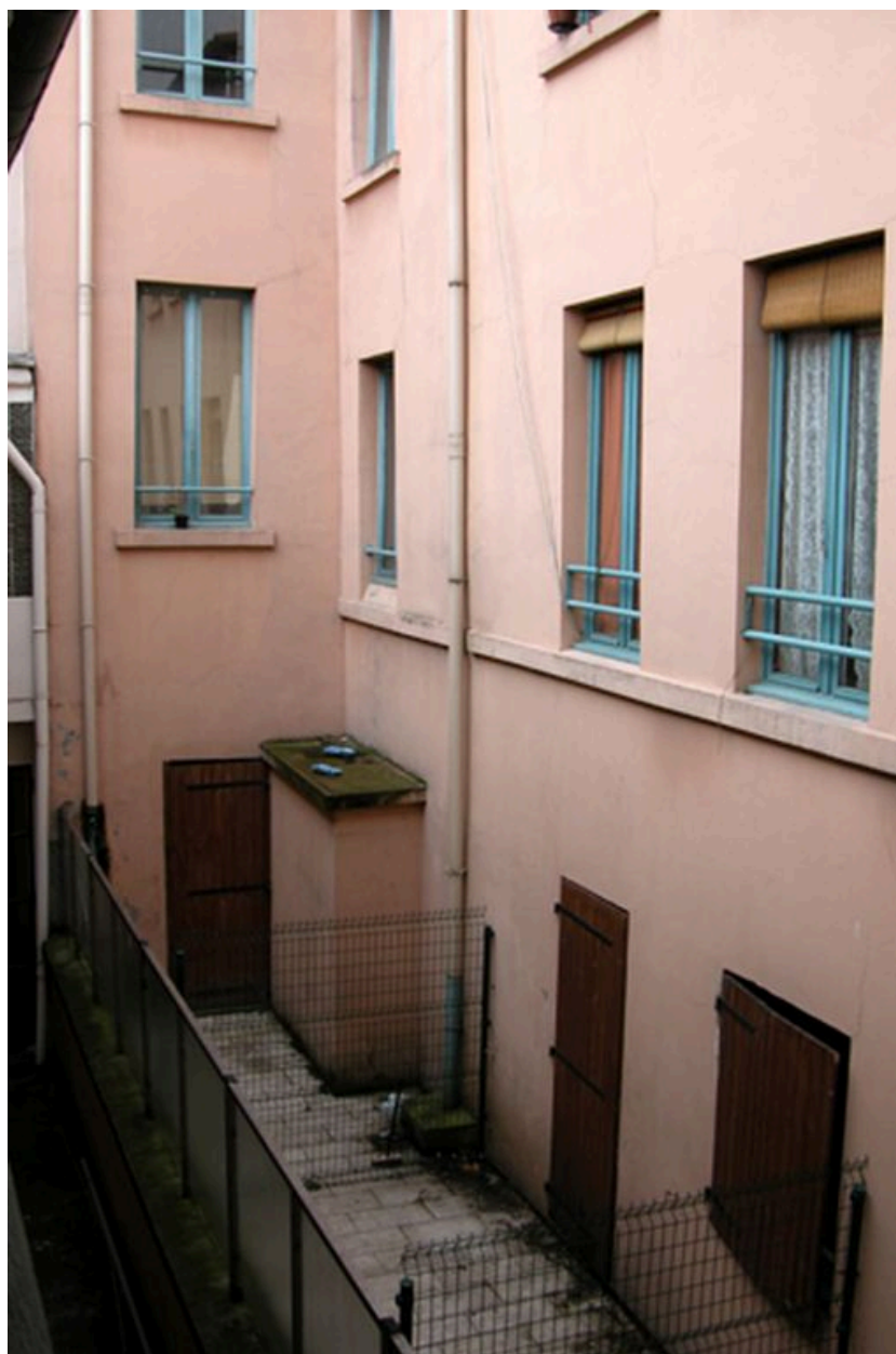
Vue de la cour et de l'élévation postérieure des corps de bâtiment depuis AD 15