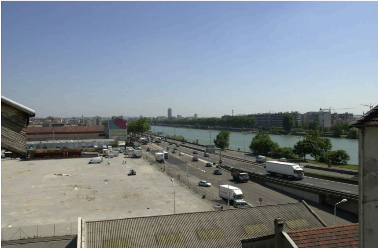
Vue d'ensemble de l'emplacement de la vitriolerie depuis le sud