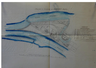
Plan de 1869 emplacement des Ets Perret (ADR 5Metcl 10) IVR84_20256902122NUCA