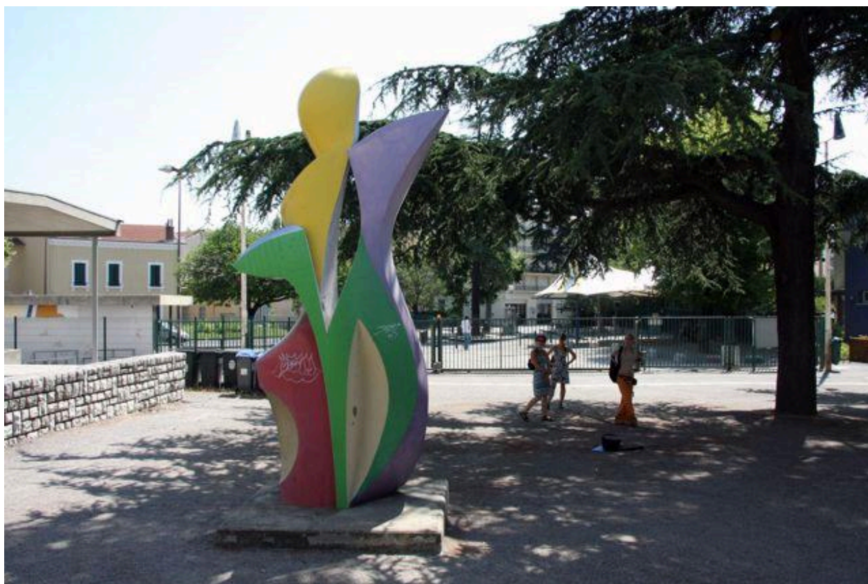
Vue du revers