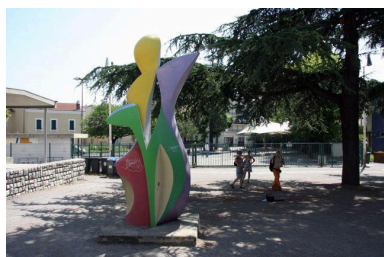
Vue du revers IVR84_20252600443NUCA