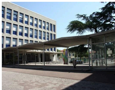
Vue de l'oeuvre (à l'arrière de la galerie couverte) dans son environnement