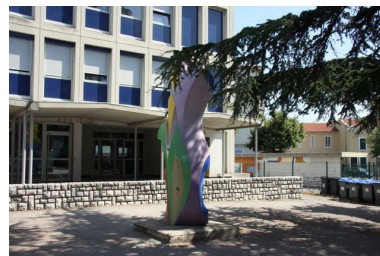
Autre vue d'ensemble IVR84_20252600442NUCA