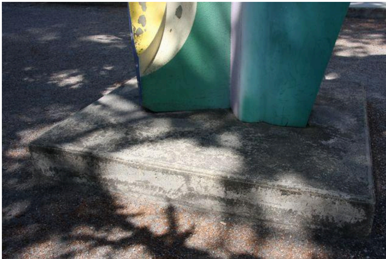
Détail : socle