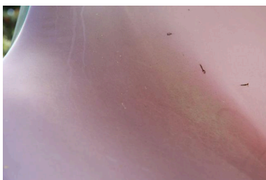
Détail : effet de la lumière sur la surface IVR84_20252600450NUCA