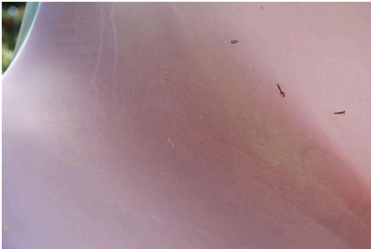
Détail : effet de la lumière sur la surface