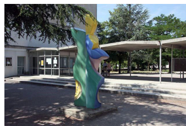
Vue de trois-quarts IVR84_20252600445NUCA