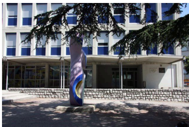
Vue d'ensemble IVR84_20252600441NUCA