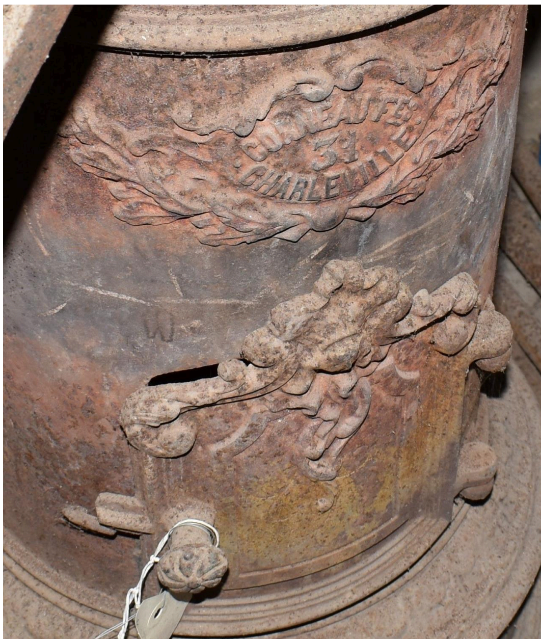
Vue de l'inscription