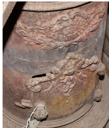
Vue de l'inscription IVR84_20226300708NUC4A