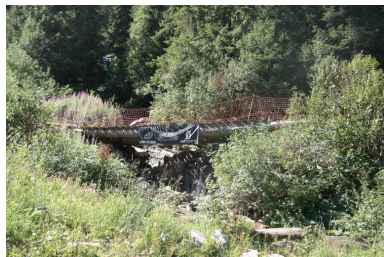
Passerelle VTT de Plaine Dranse, vue de la face aval IVR84_20197401241NUCA