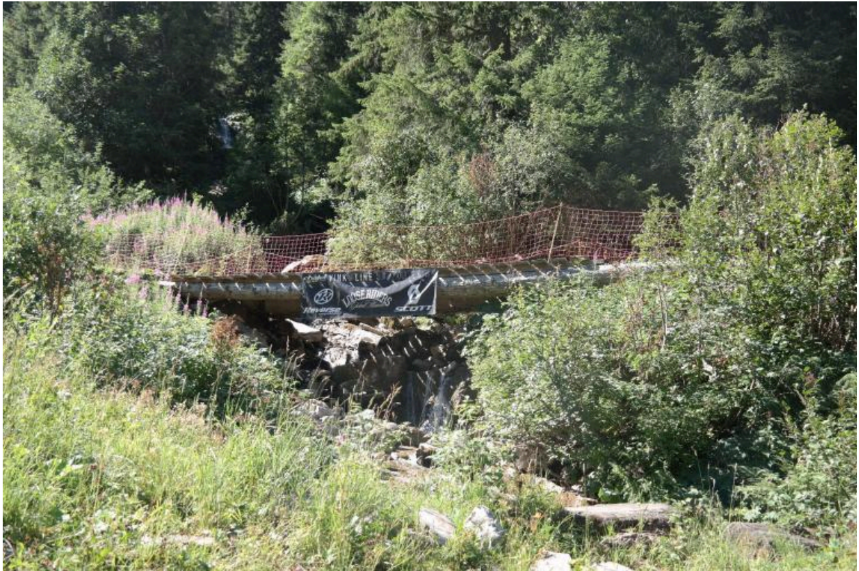
Passerelle VTT de Plaine Dranse, vue de la face aval