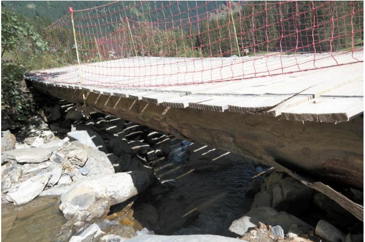
Passerelle VTT de Plaine dranse, vue de la face amont