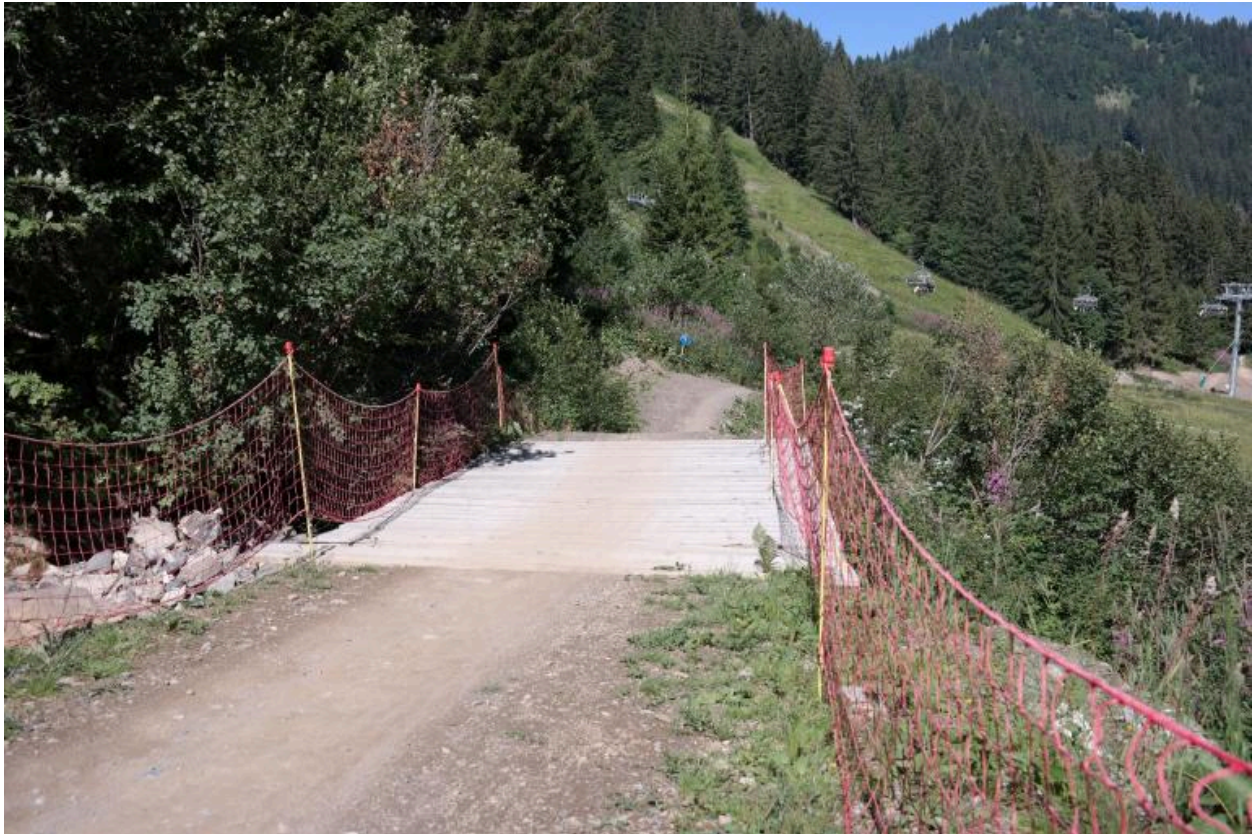
Passerelle VTT de Plaine-Dranse, vue du tablier