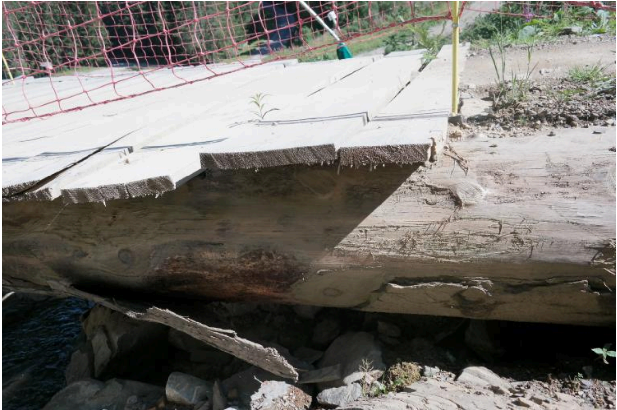
Passerelle VTT de Plaine Dranse, détail de la structure