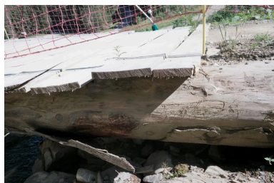
Passerelle VTT de Plaine Dranse, détail de la structure IVR84_20207401423NUCA