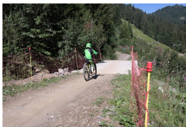
Passerelle VTT de Plaine Dranse avec pratiquant