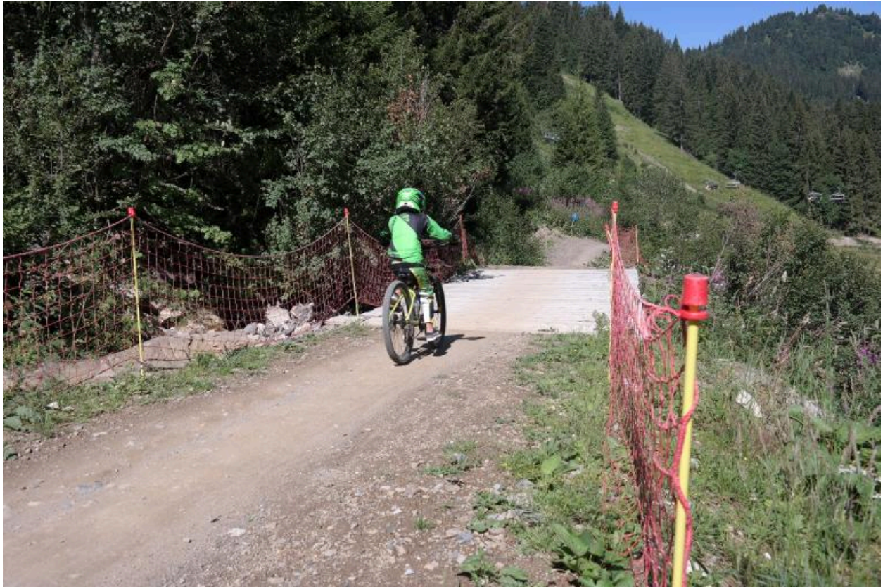
Passerelle VTT de Plaine Dranse avec pratiquant