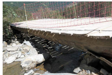
Passerelle VTT de Plaine dranse, vue de la face amont IVR84_20207401422NUCA