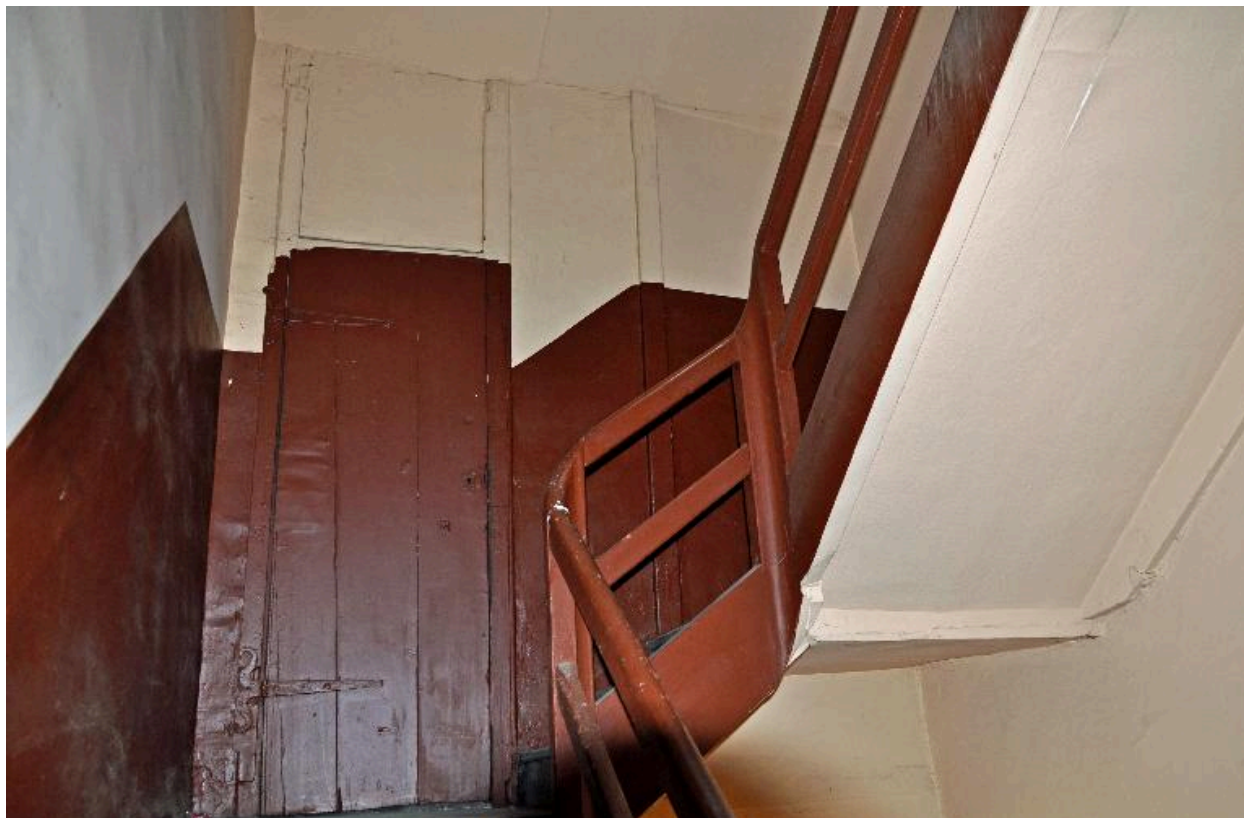
Dernier étage : escalier en charpente et paroi en pan-de-bois