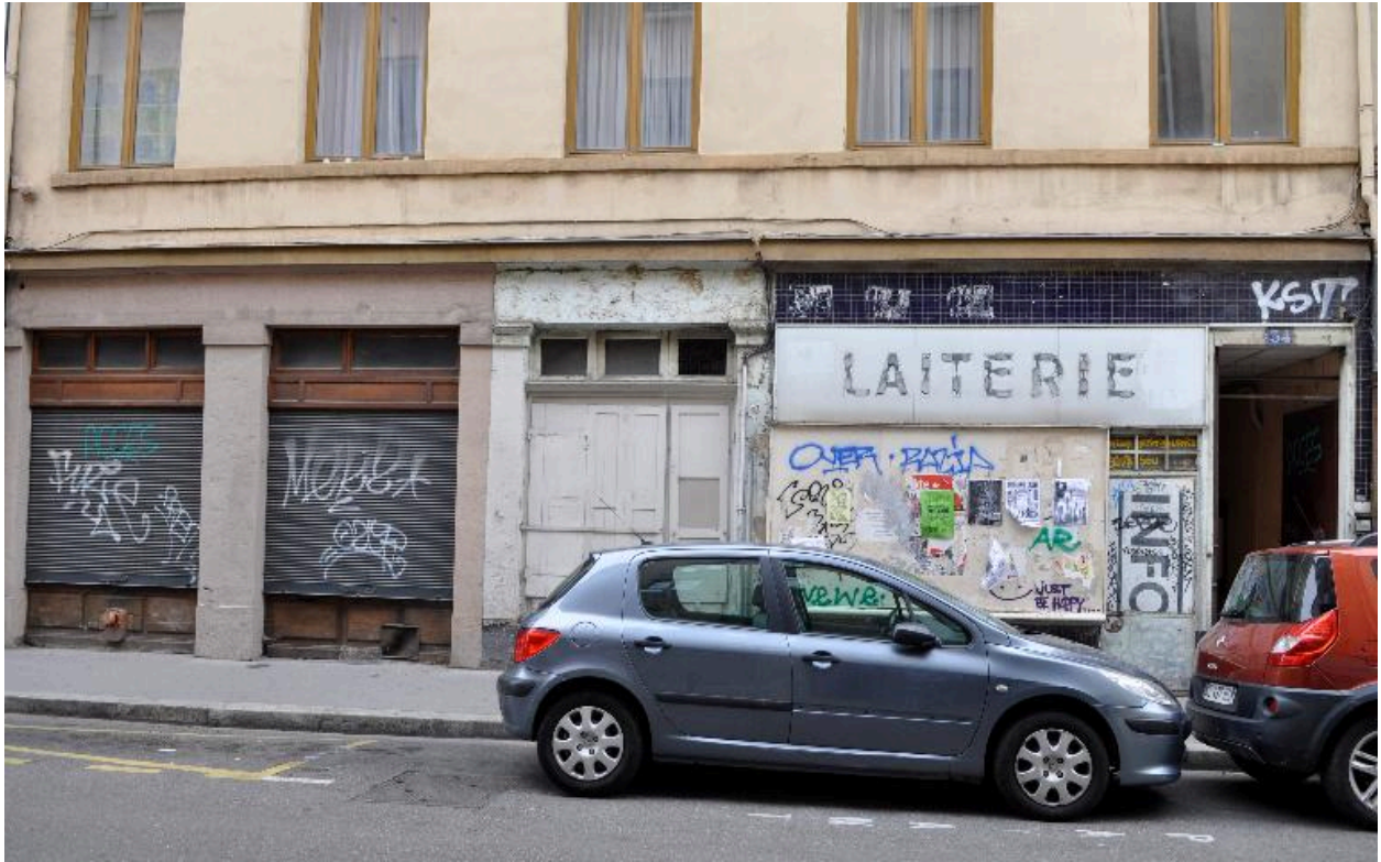
Détail du rez-de-chaussée : vestiges de pilastres ; devanture ; ancienne laiterie