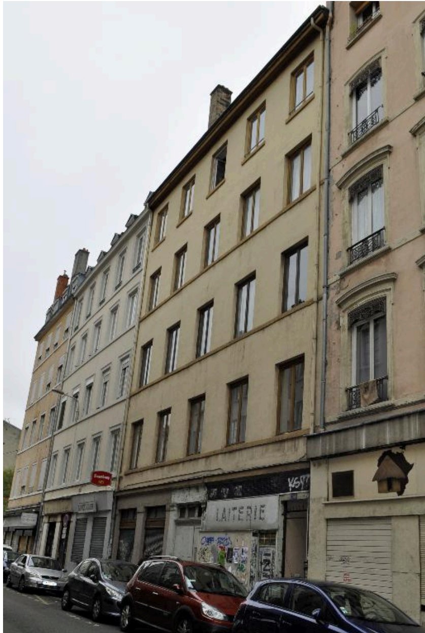
Elévation sur rue