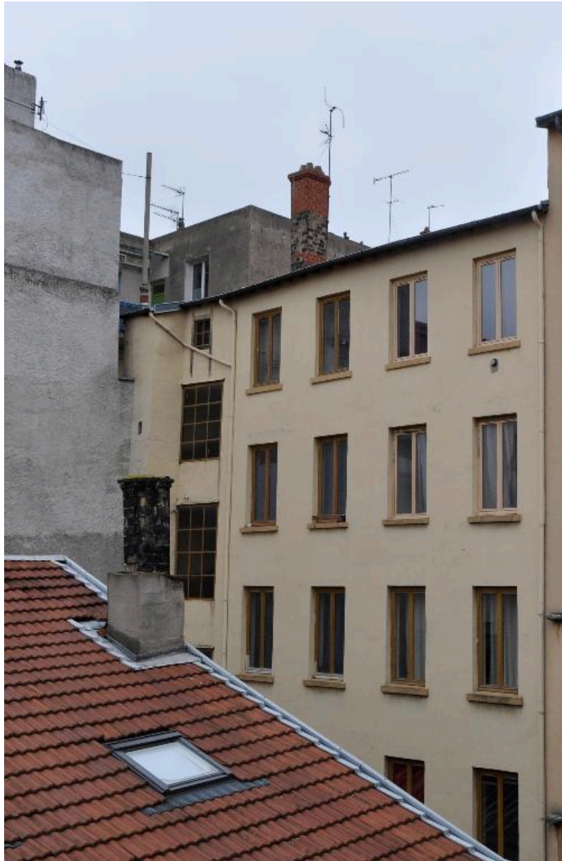
Elévation sur cour, vue partielle