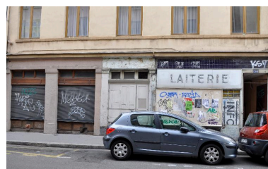
Détail du rez-de-chaussée : vestiges de pilastres ; devanture ; ancienne laiterie IVR84_20166900784NUCA