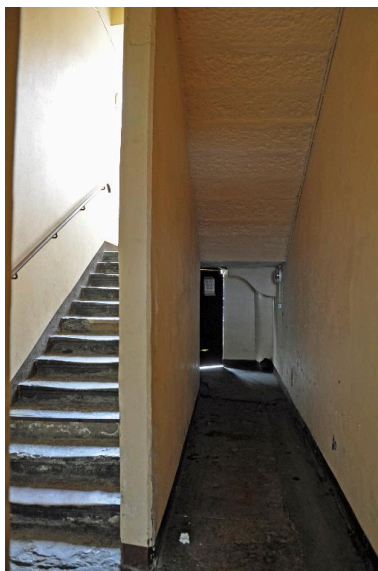
Vue intérieure : le départ de l'escalier rampe-sur-rampe IVR84_20166900786NUCA