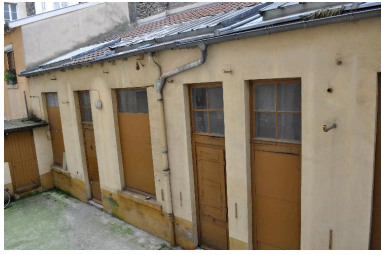
Dépendance en rez-de- chaussée, dans la cour IVR84_20166900789NUCA