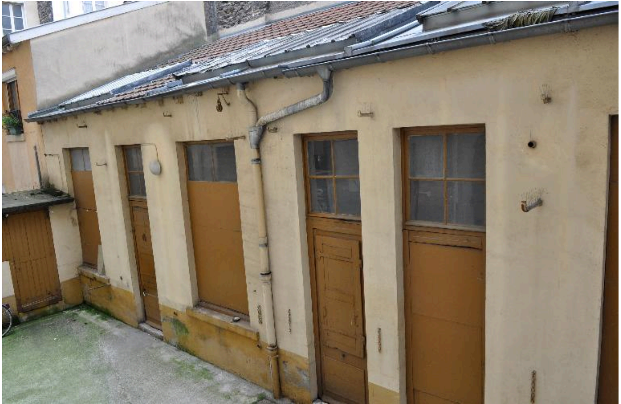
Dépendance en rez-de-chaussée, dans la cour