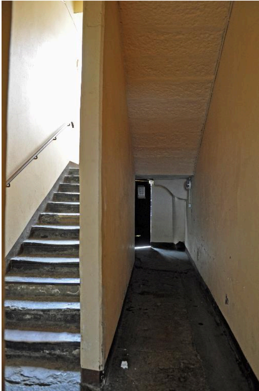
Vue intérieure : le départ de l'escalier rampe-sur-rampe