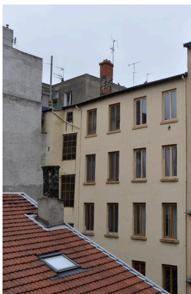
Elévation sur cour, vue partielle IVR84_20166900783NUCA