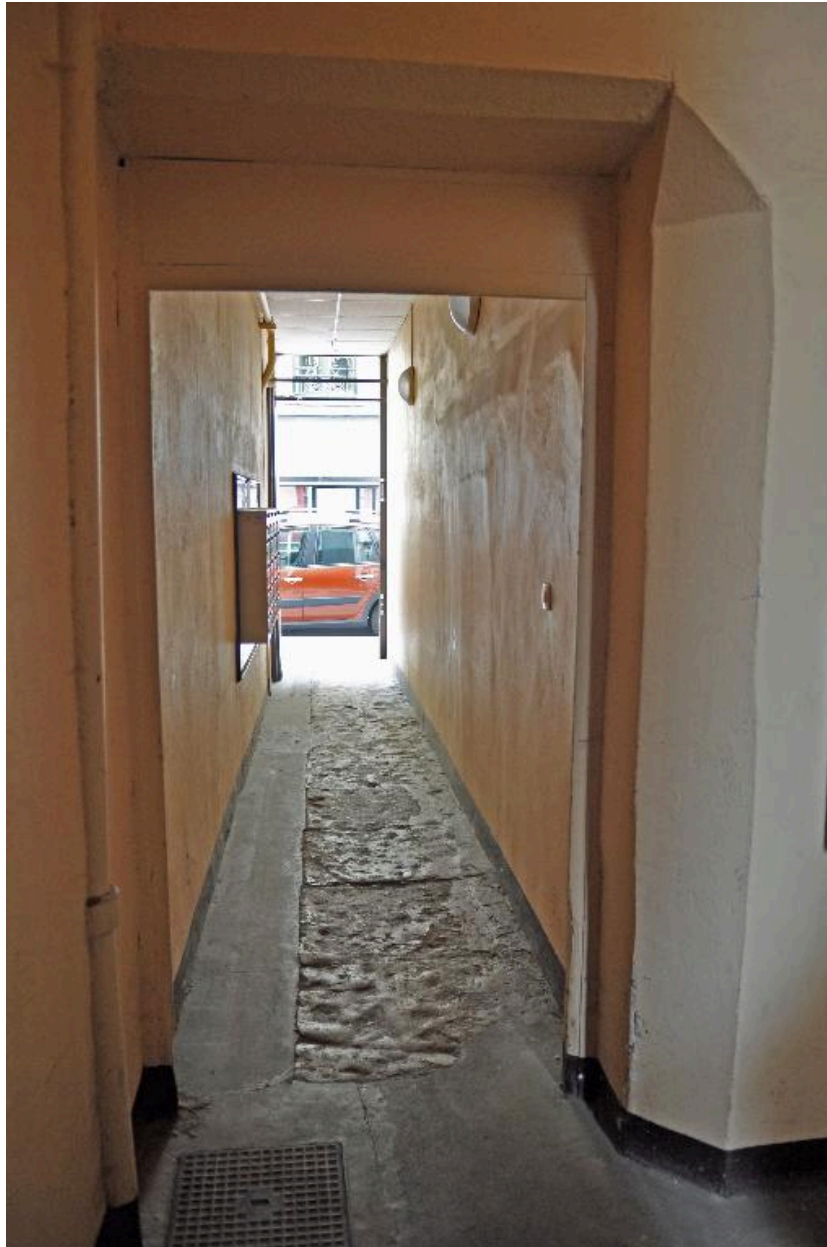
Vue de l'allée, depuis l'escalier