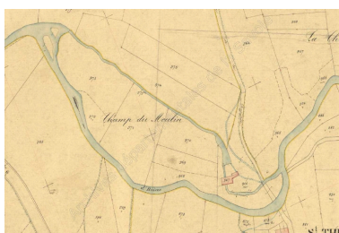
Premier cadastre français, 1897. Cadastre de 1897 AD Savoie. 3P 7282 IVR82_20117302181NUCA