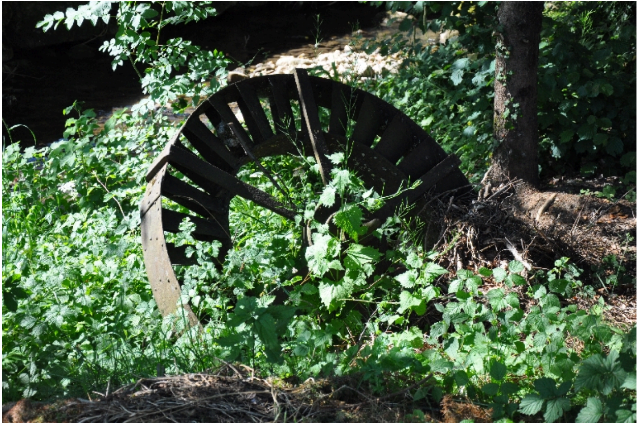
Vue détaillée de la roue horizontale métallique