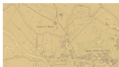
Cadastre rénové, 1935. Cadastre de 1935 AD Savoie. 3P 7283 IVR82_20117302182NUCA