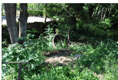
Vue générale de la roue horizontale métallique le long du ruisseau d'Hyères IVR82_20117302184NUCA