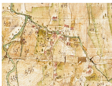
Cadastre de 1732. Cadastre de 1728 AD Savoie. C 4377