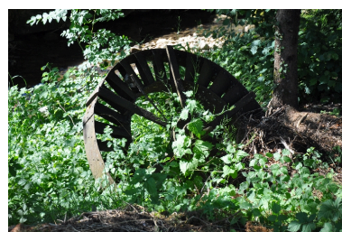
Vue détaillée de la roue horizontale métallique