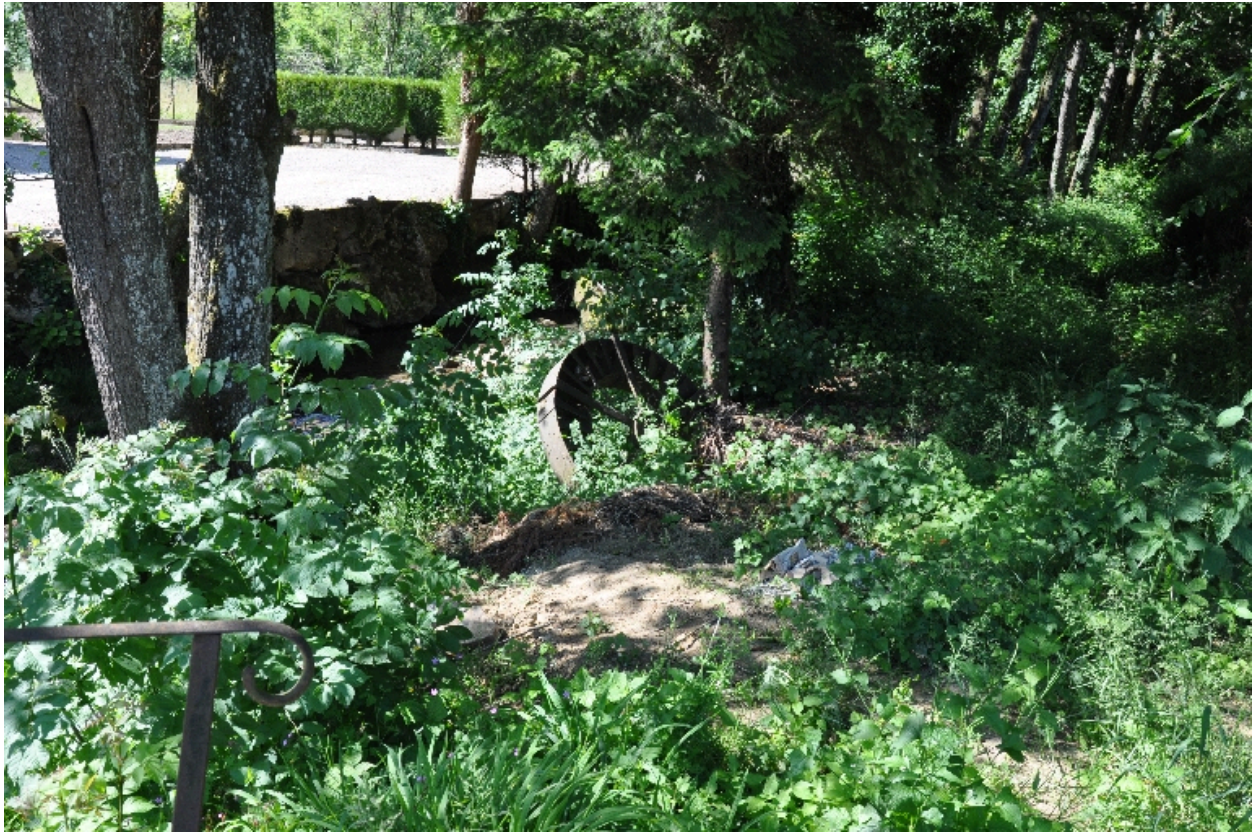
Vue générale de la roue horizontale métallique le long du ruisseau d'Hyères