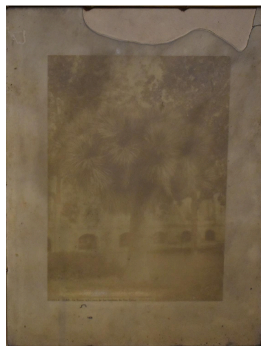
La Yucca arbol raro IVR84_20216300549NUCA