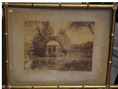
La isla y la ria