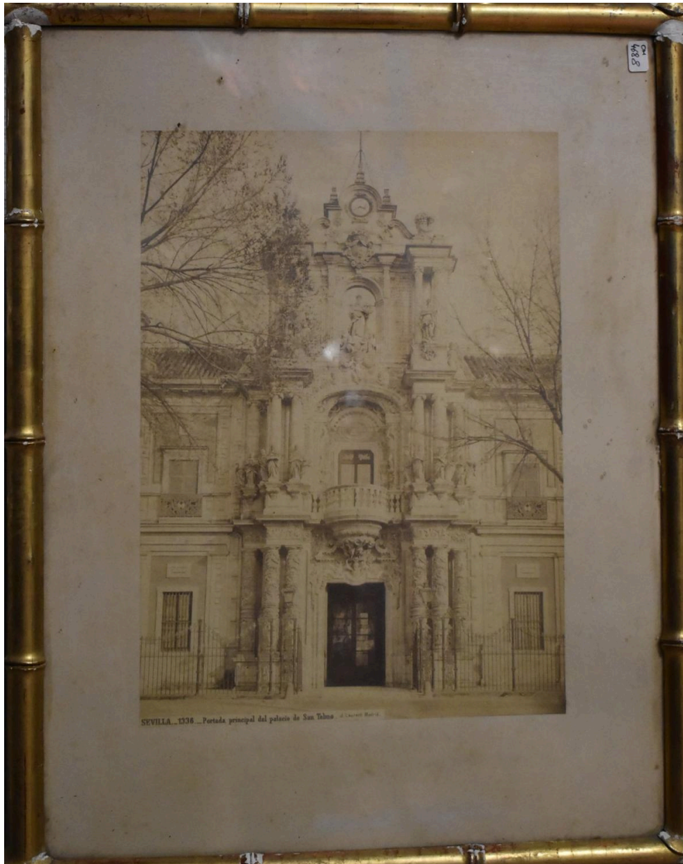
La Portada principal