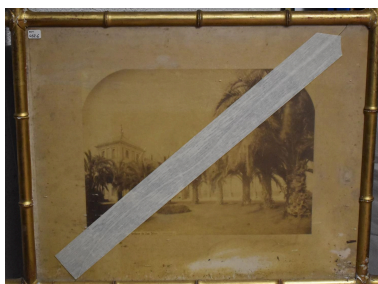
Palmeras de los jardines