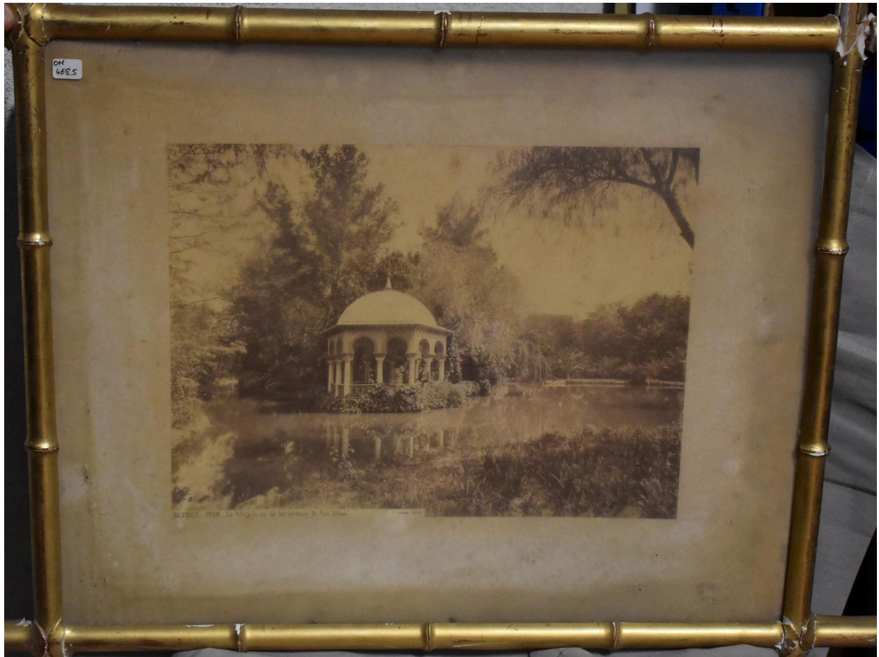
La isla y la ria