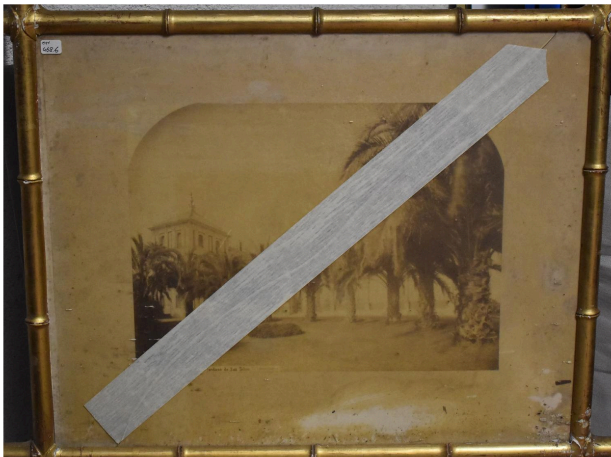
Palmeras de los jardines