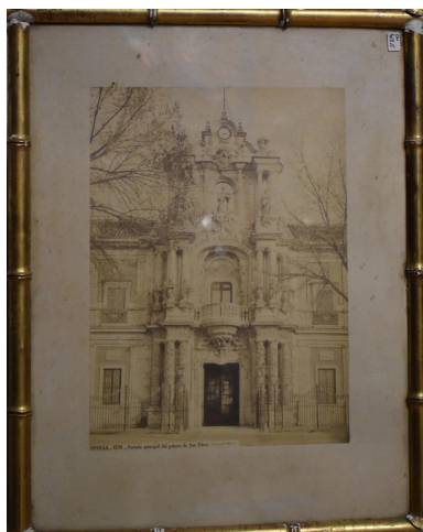
La Portada principal IVR84_20216300550NUCA