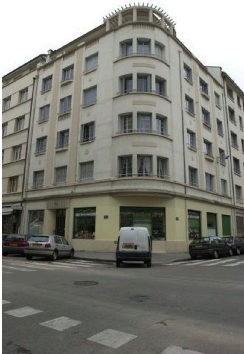
Vue générale de l'élévation