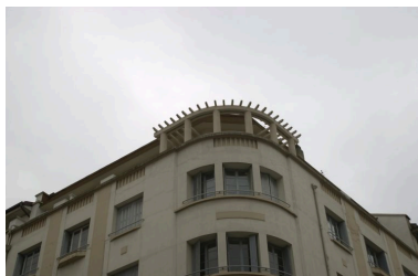
Pergola IVR82_20046903223NUCA