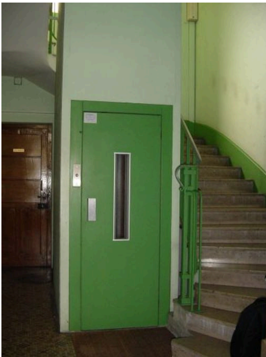
Ascenseur et montée d'escalier