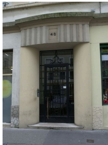
Porte d'entrée IVR82_20046903224NUCA