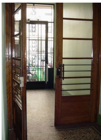
Vestibule-sas IVR82_20046903539NUCA