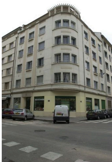
Vue générale de l'élévation IVR82_20046903222NUCA