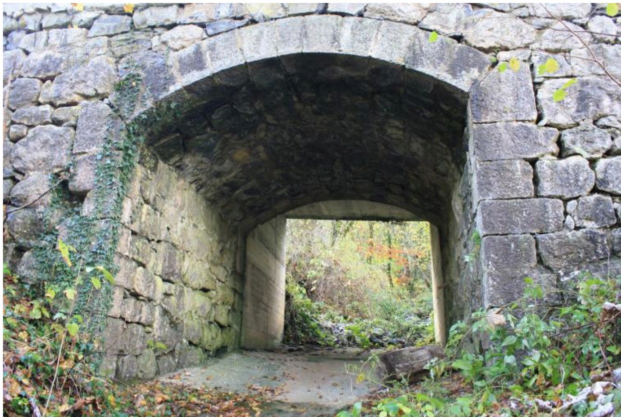
Le vieux pont de Trélachaud, détail voute