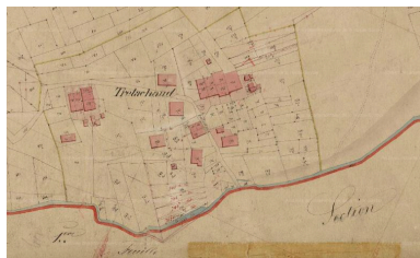
Le vieux pont de Trélachaud, extrait du cadastre de la Vernaz section A feuille 2, 1868 IVR84_20207401479NUCA