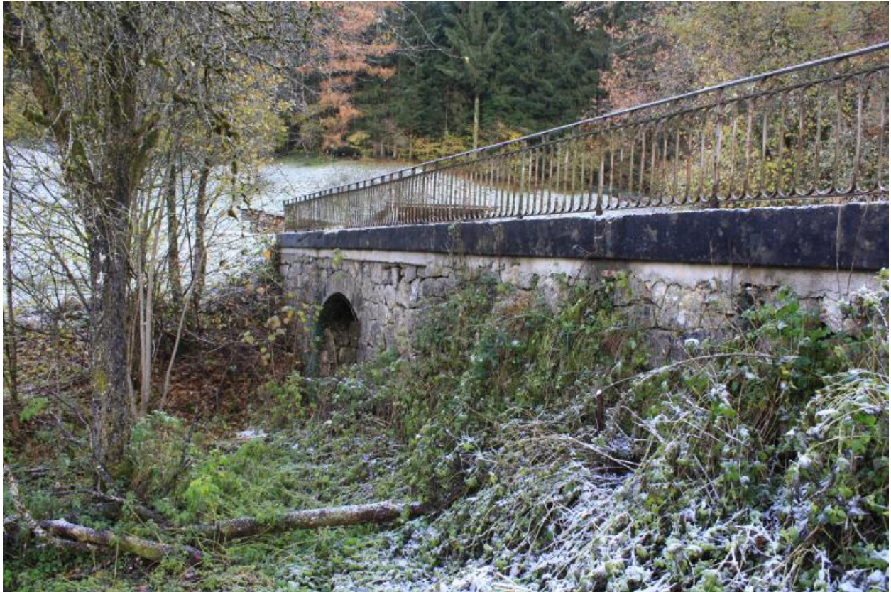
Le vieux pont de Trélachaud, face aval