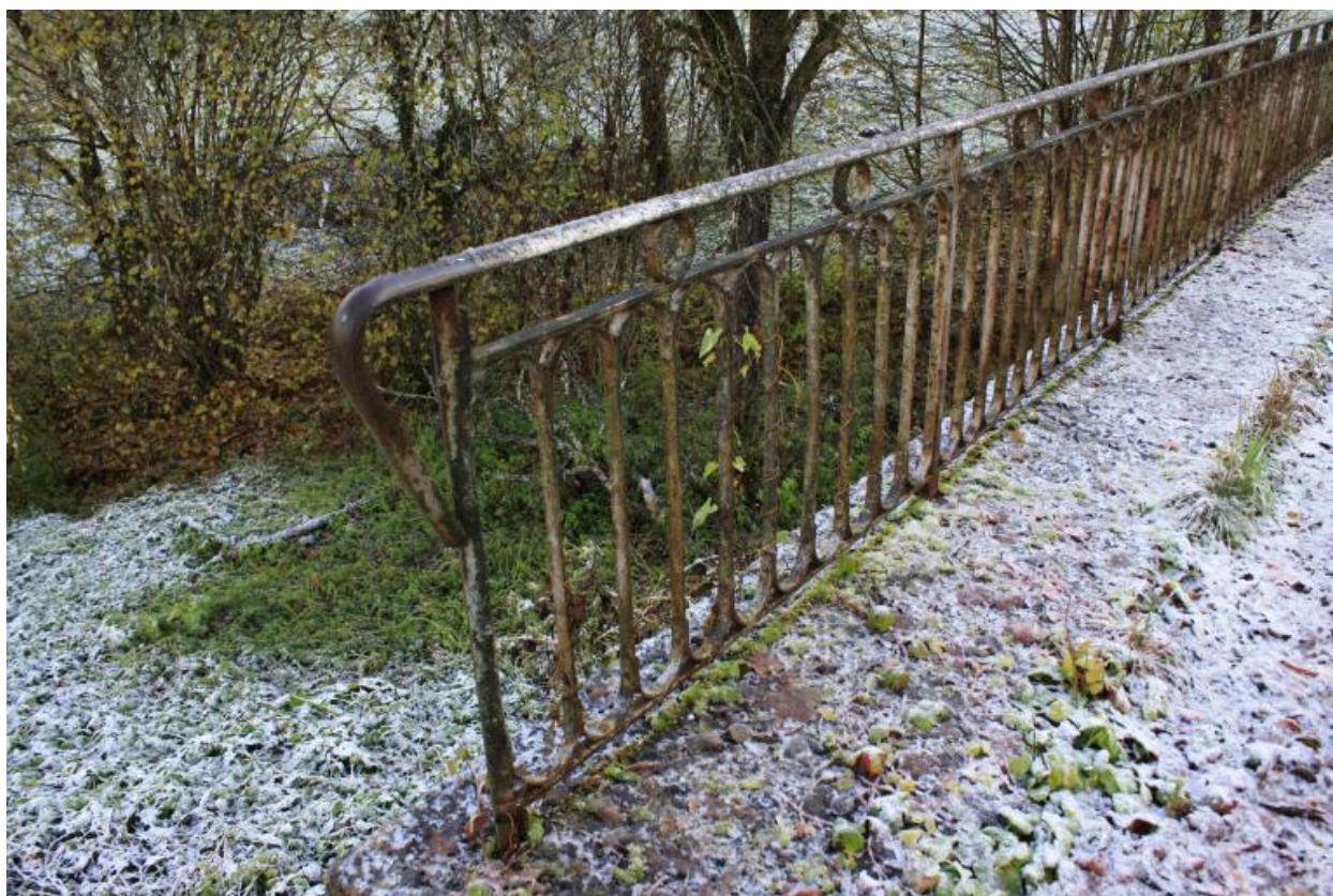
Le vieux pont de Trélachaud, détail garde coprs