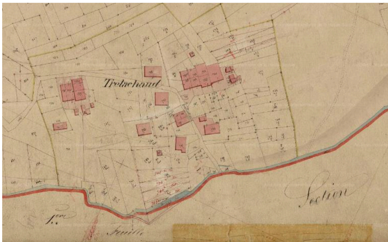
Le vieux pont de Trélachaud, extrait du cadastre de la Vernaz section A feuille 2, 1868