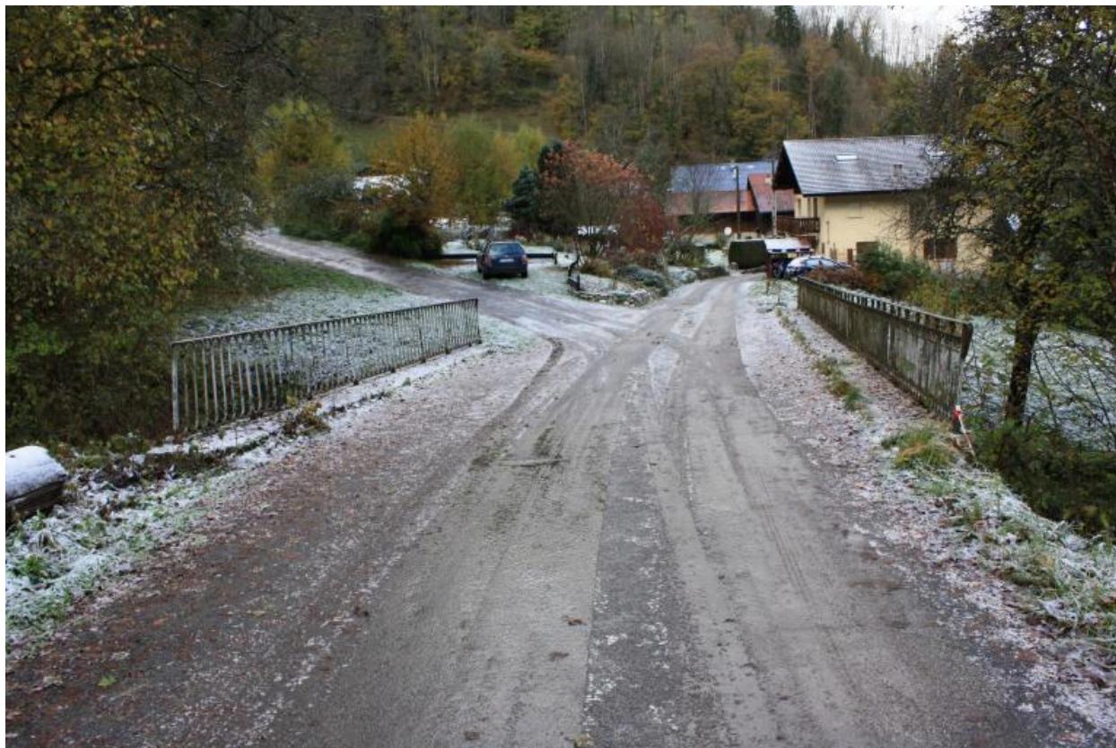
Le vieux pont de Trélachaud, contexte, chaussée et garde corps