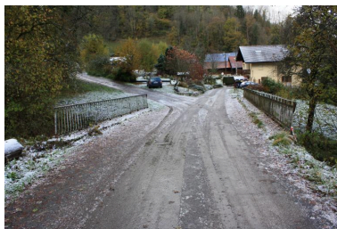
Le vieux pont de Trélachaud, contexte, chaussée et garde corps