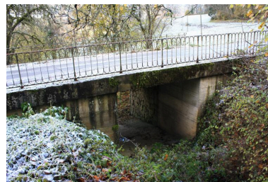
Le vieux pont de Trélachaud, face amont