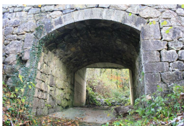
Le vieux pont de Trélachaud, détail route IVR84_20207401480NUCA