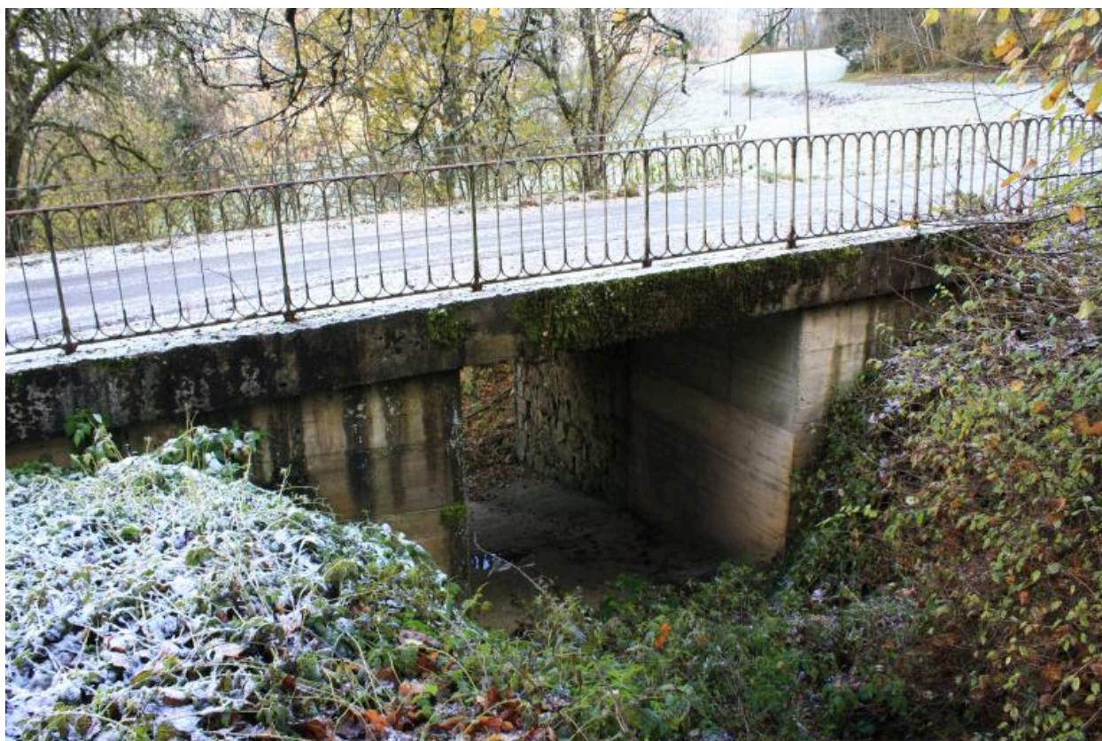
Le vieux pont de Trélachaud, face amont