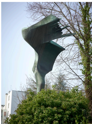
Vue rapprochée.