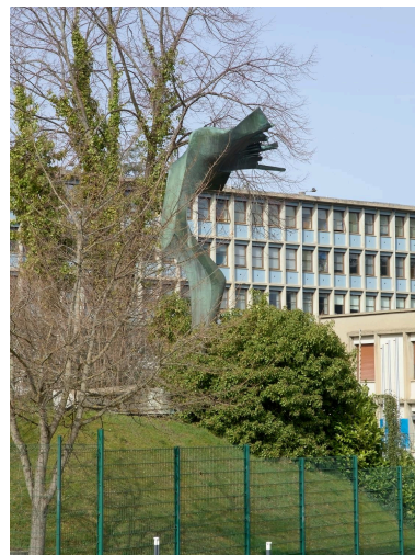
Vue générale. IVR84_20214200039NUCA