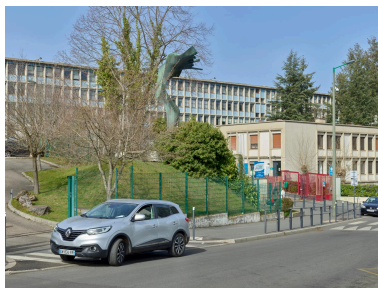
Vue générale depuis la rue. IVR84_20214200040NUCA