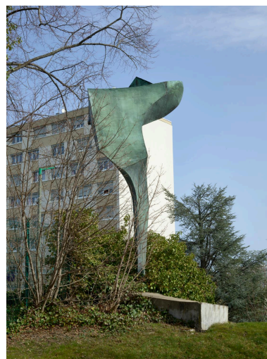
Vue rapprochée.