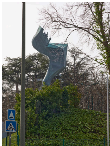
Vue générale. IVR84_20214200037NUCA