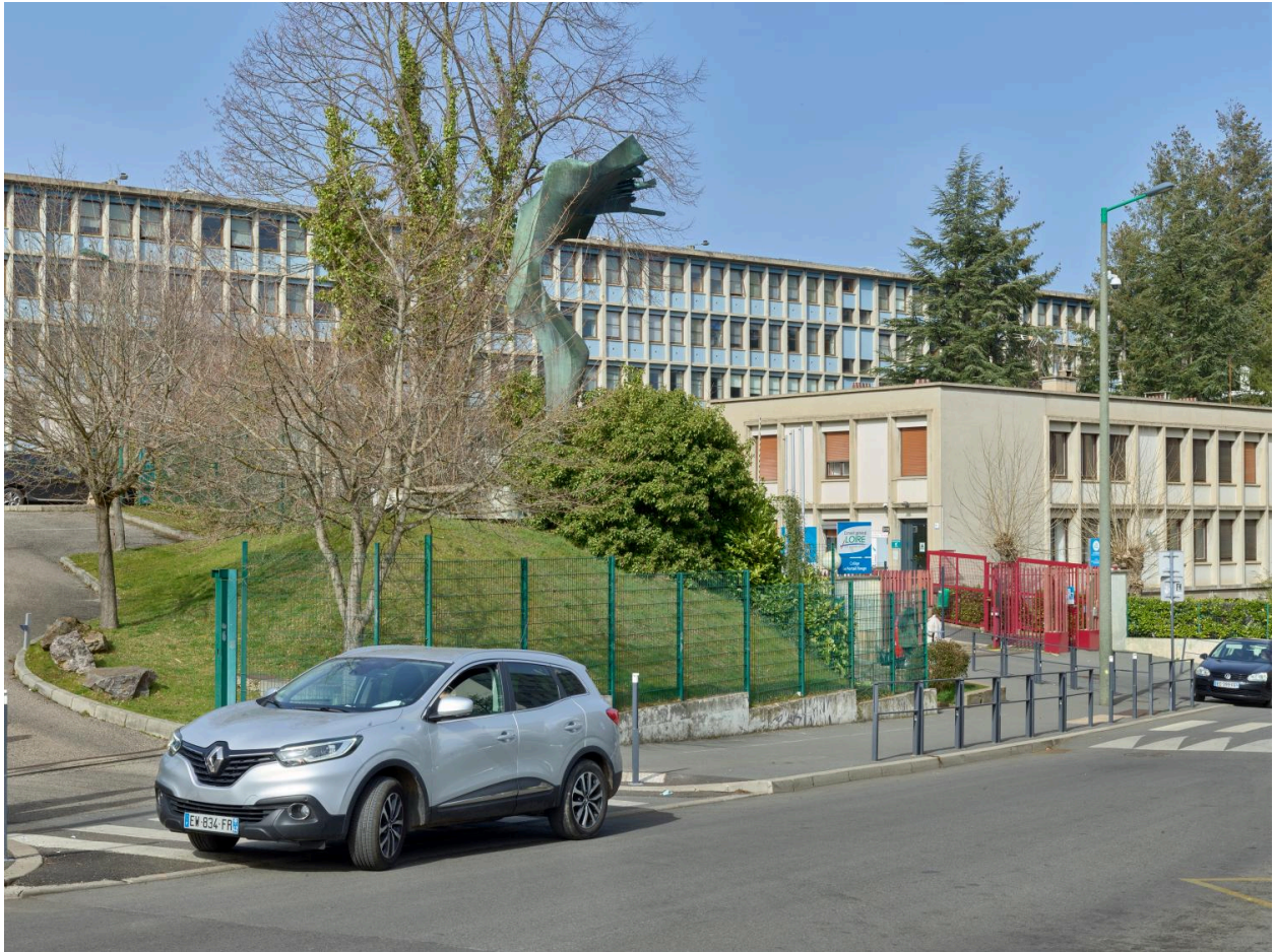
Vue générale depuis la rue.