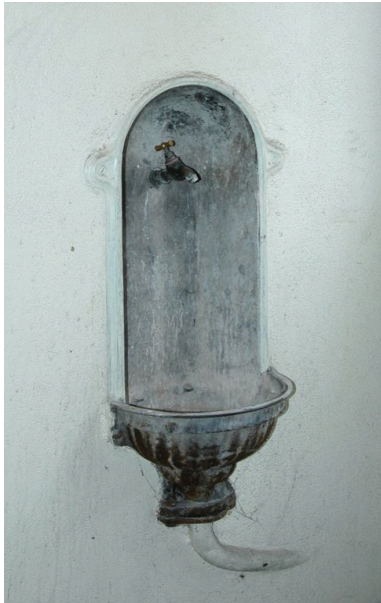
Fontaine située sur le mur sud du repos de chaque palier