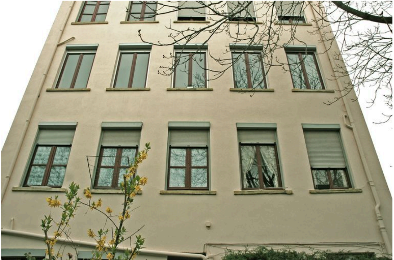
Détail de l'élévation à travée sur jardin côté est