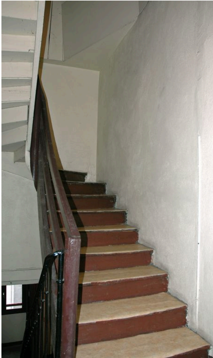
Escalier en bois desservant le 4ième étage