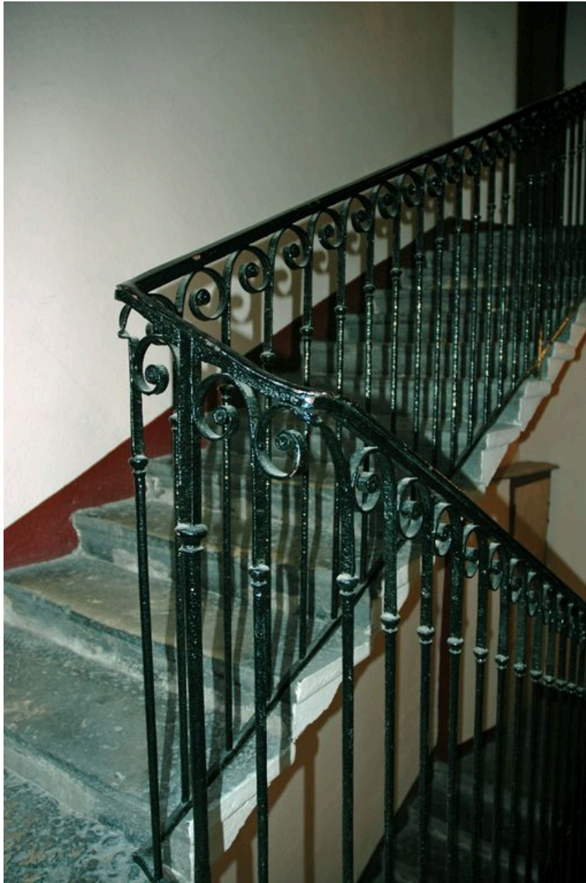
Volées d'escalier en pierre, vue depuis le repos