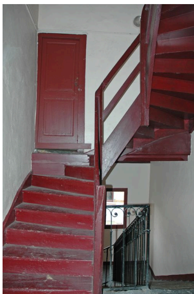
Première volée d'escalier en bois desservant le 3ième étage IVR82_20066901298NUCA