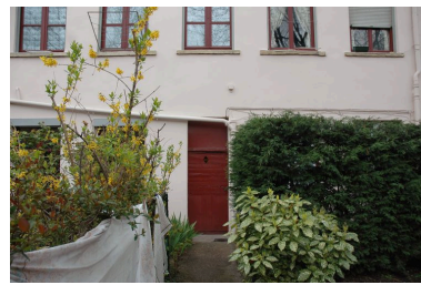
Entrée donnant accès à l'allée sur le façade est, vue depuis le jardin IVR82_20066901395NUCA