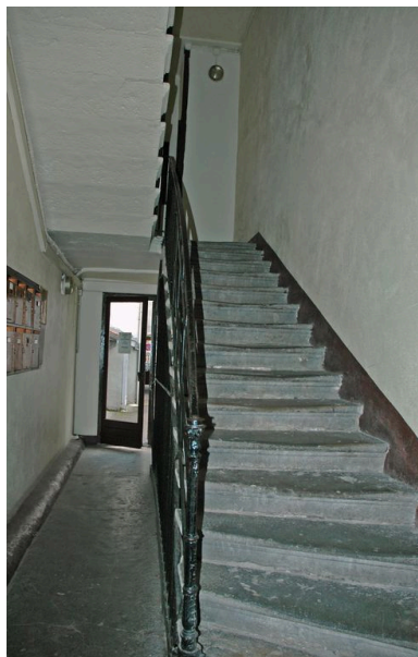
Première volée en pierre de la cage d'escalier vue depuis l'est IVR82_20066901391NUCA