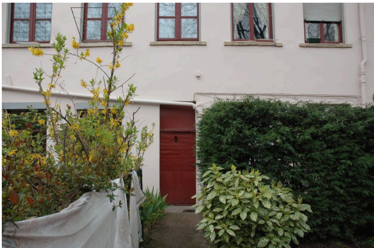
Entrée donnant accès à l'allée sur le façade est, vue depuis le jardin