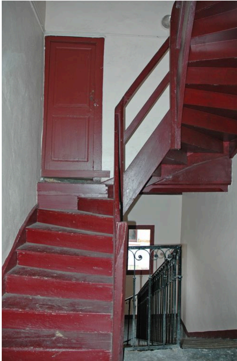
Première volée d'escalier en bois desservant le 3ième étage