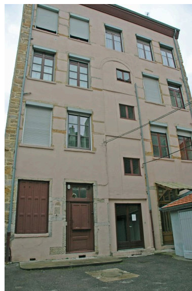
Façade ouest côté cour vue depuis le sud IVR82_20066901393NUCA