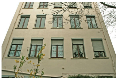
Détail de l'élévation à travée sur jardin côté est IVR82_20066901394NUCA