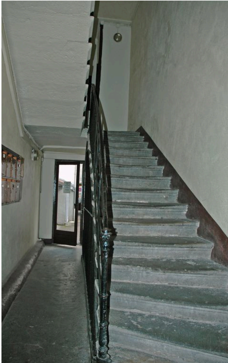
Première volée en pierre de la cage d'escalier vue depuis l'est