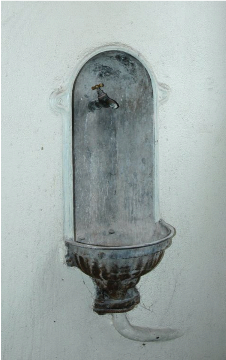
Fontaine située sur le mur sud du repos de chaque palier