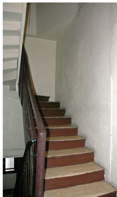
Escalier en bois desservant le 4ième étage