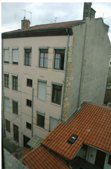
Façade ouest sur cour vue depuis une cage d'escalier au située nord IVR82_20066901392NUCA