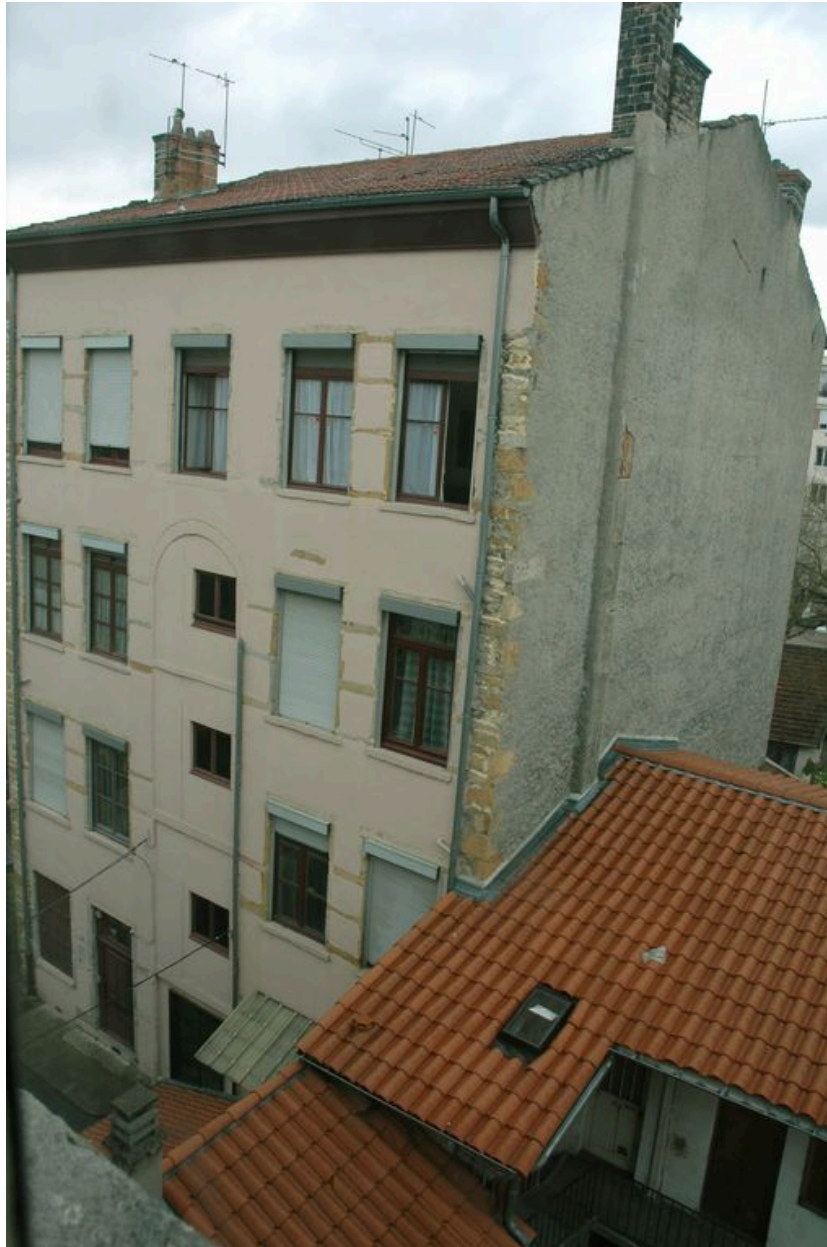
Façade ouest sur cour vue depuis une cage d'escalier au située nord