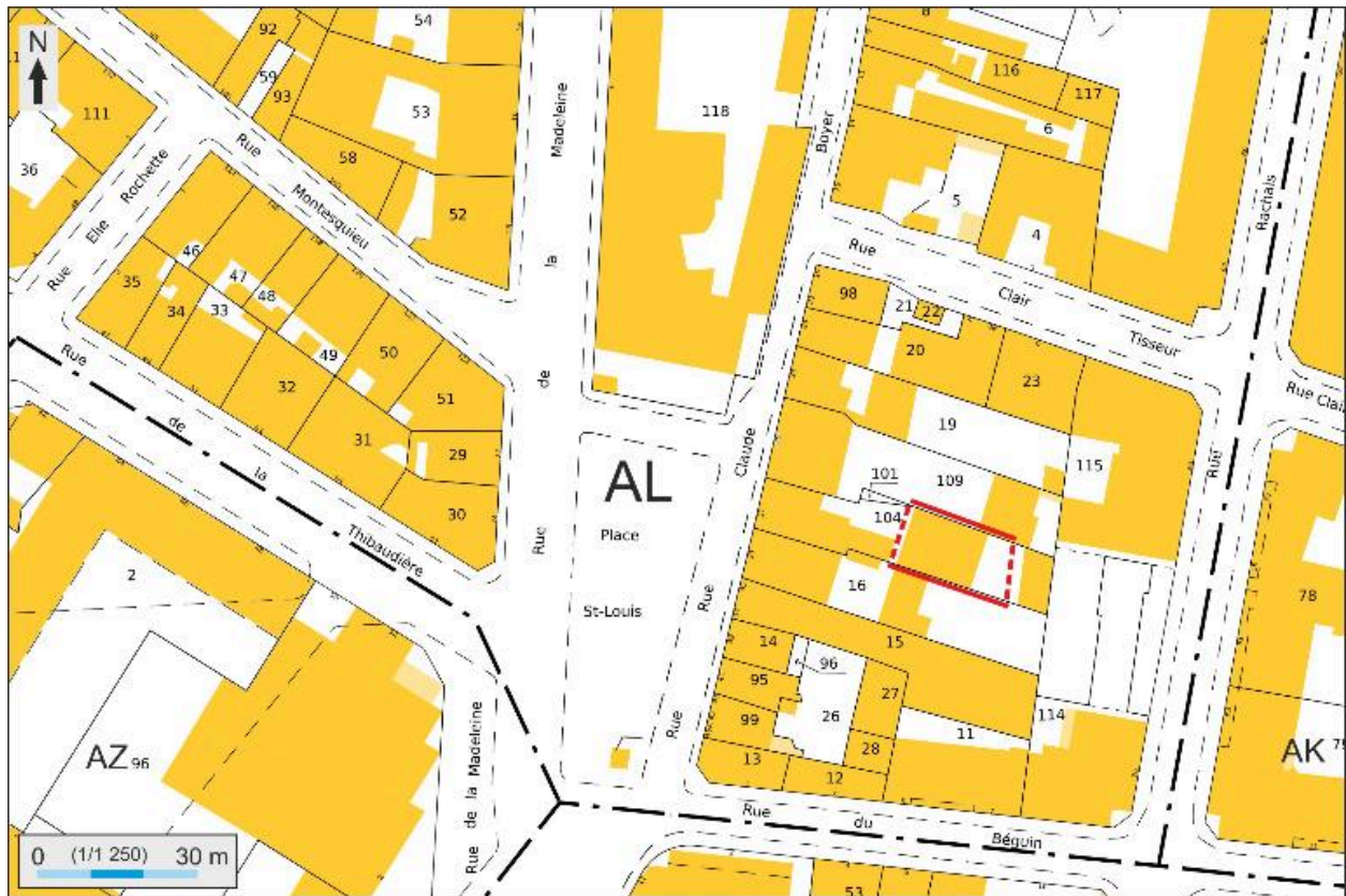
Plan masse et de situation, extrait de http://cadastre.gouv.fr