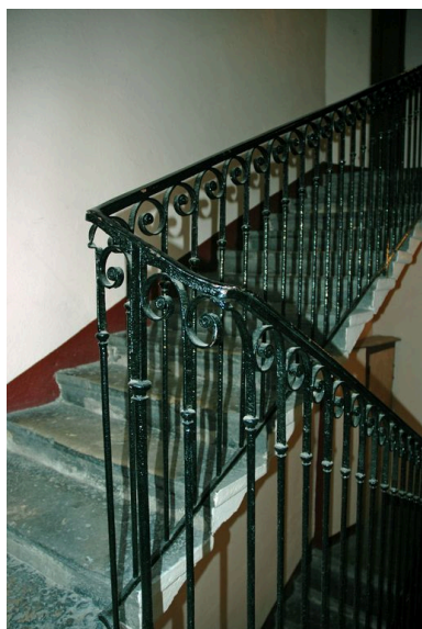
Volées d'escalier en pierre, vue depuis le repos