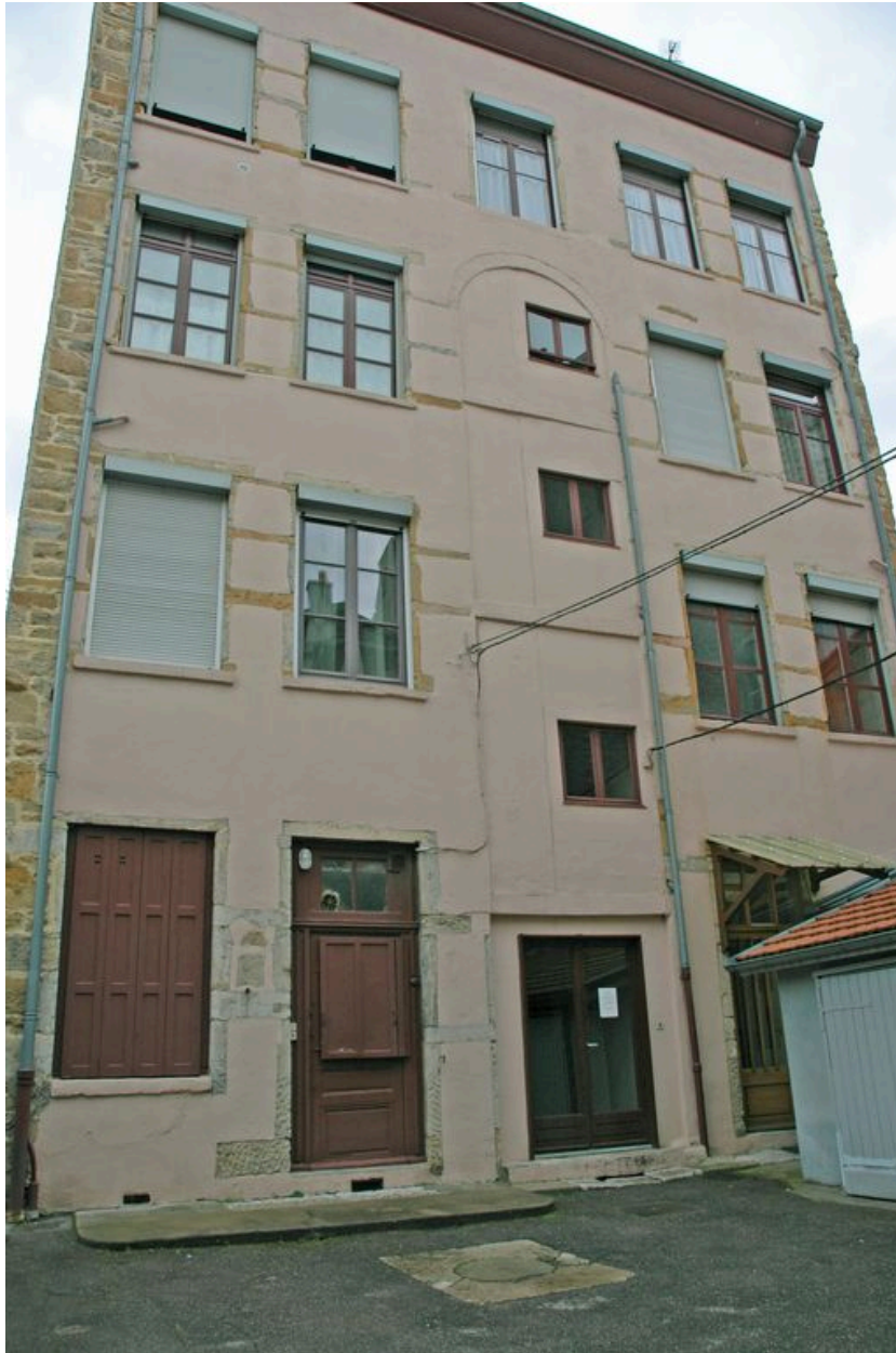
Façade ouest côté cour vue depuis le sud