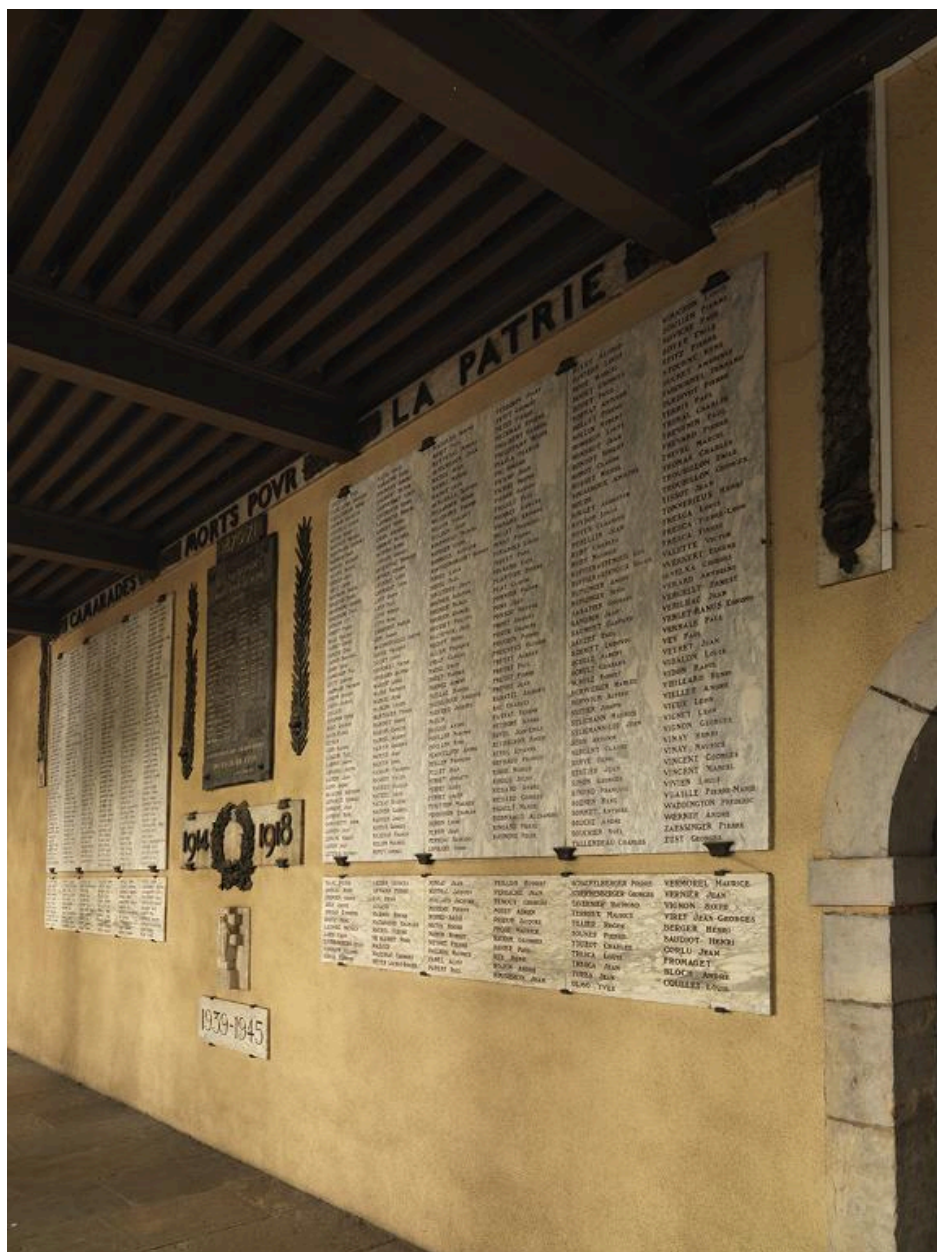
Vue générale depuis l'ouest