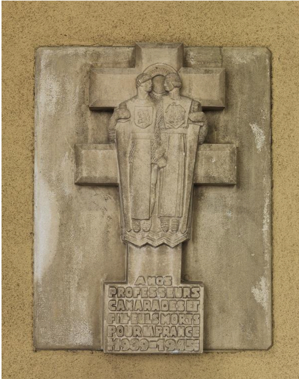
Bas-relief commémoratif des professeurs morts pour la guerre de 1939-45