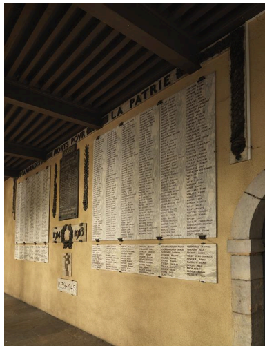
Vue générale depuis l'ouest IVR82_20126902151NUCAQ