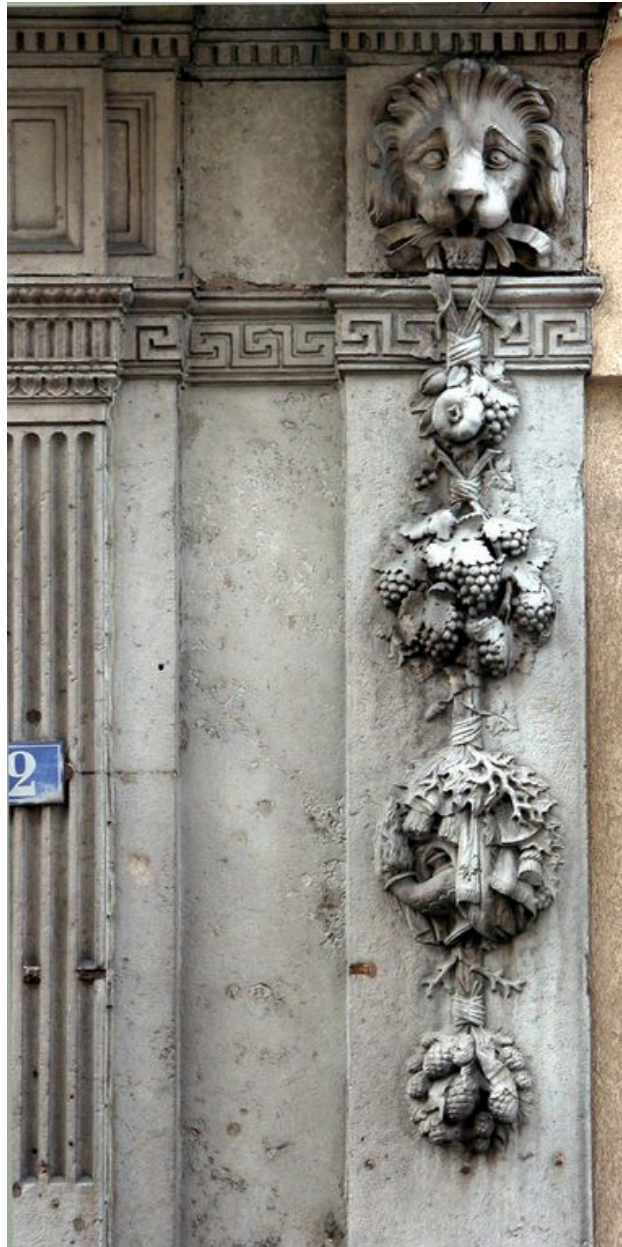
Détail du masque de lion et de la chute de fruits et d'objets situés à droite des vantaux