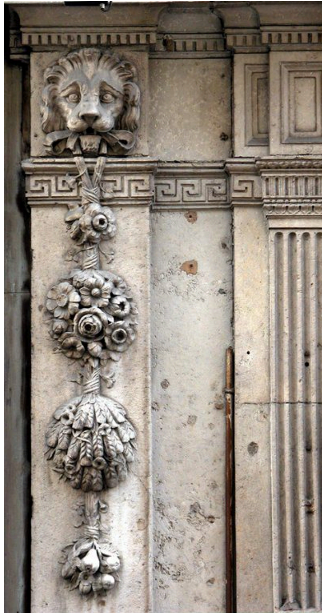
Détail du masque de lion et de la chute de fruits situés à gauche des vantaux