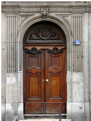
Partie inférieure IVR82_20046905025NUCA