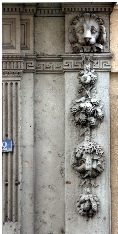
Détail du masque de lion et de la chute de fruits et d'objets situés à droite des vantaux IVR82_20046905028NUCA