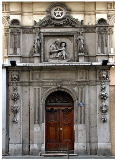
Vue générale IVR82_20046905024NUCA