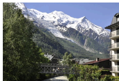
Vue générale de l'ouvrage IVR84_20207401351NUCA