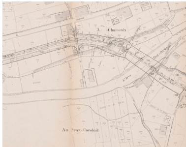
Extrait du plan parcellaire des terrains à acquérir dans la traversée de Chamonix. 1908 (AD Haute-Savoie. 4 S 132) IVR84_20257401344NUCA