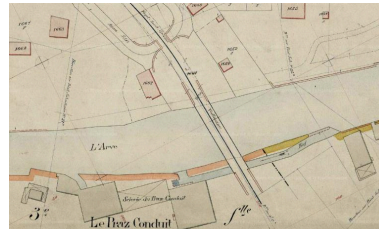
Extrait de la Section G Feuille n °7 du cadastre de la commune de Chamonix. 1923 IVR84_20207401348NUCA