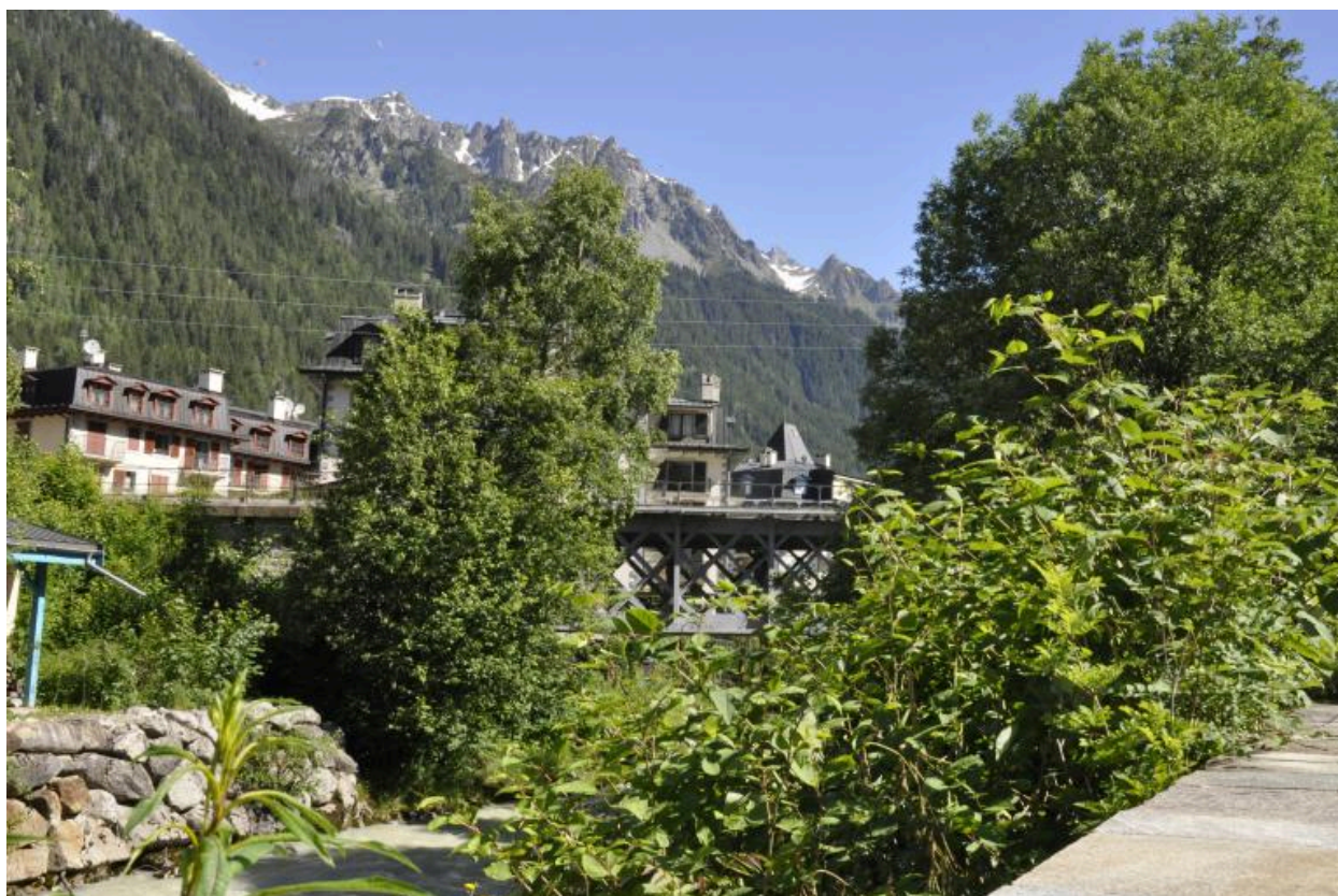
Vue du tablier métallique en face aval