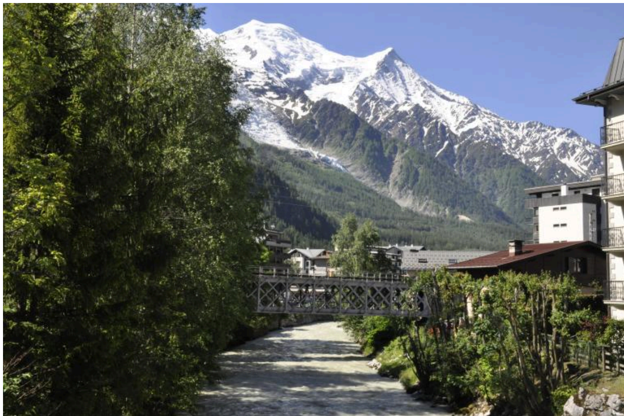
Vue de la face amont du viaduc de Chamonix