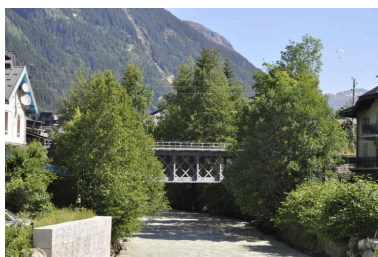
Vue de la face aval du viaduc IVR84_20207401353NUCA