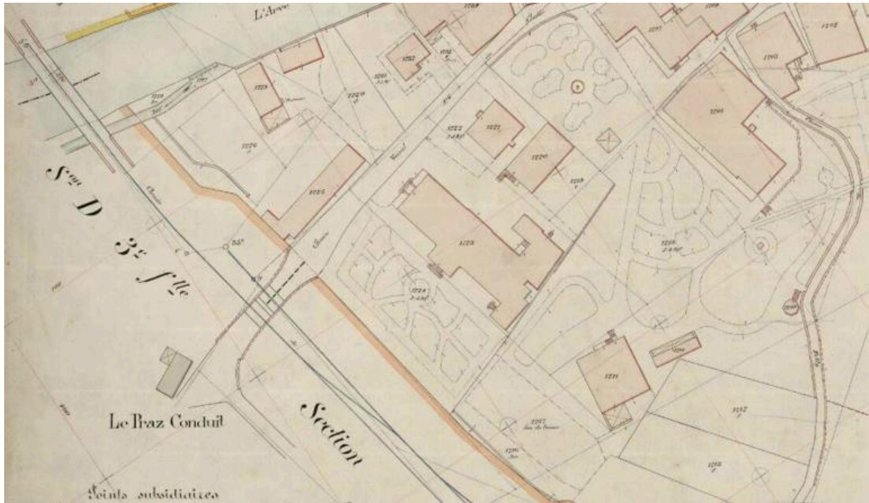
Extrait de la Section G Feuille n°5 du cadastre de la commune de Chamonix. 1923