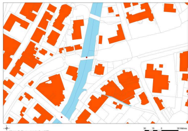
Cadastré de la commune de Chamonix. 2019. Département de la Haute-Savoie/ Pôle Culture Patrimoine/ SIG IVR84_20207401363NUCA