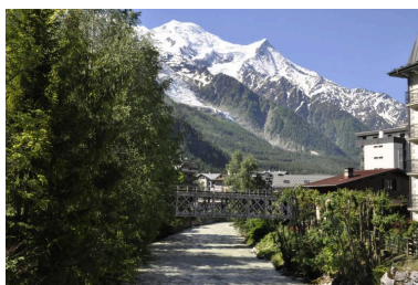
Vue de la face amont du viaduc de Chamonix IVR84_20207401350NUCA