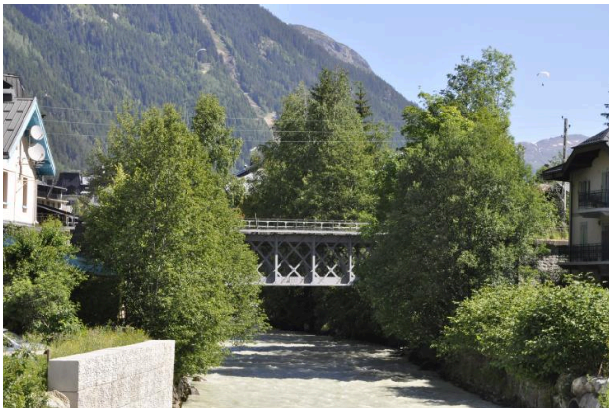
Vue de la face aval du viaduc