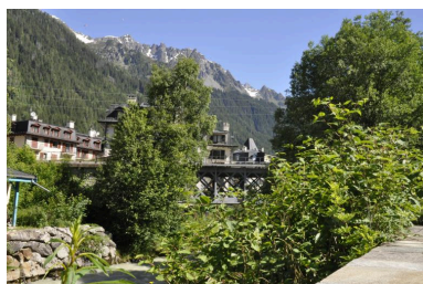
Vue du tablier métallique en face aval IVR84_20207401352NUCA