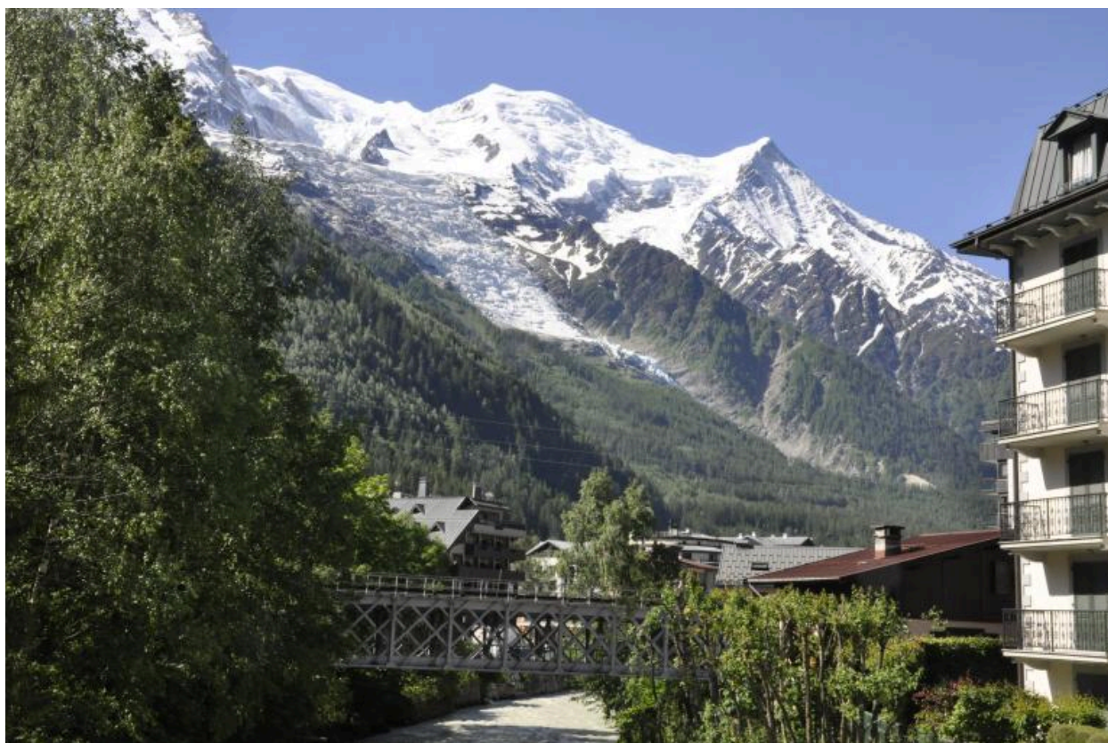
Vue générale de l'ouvrage