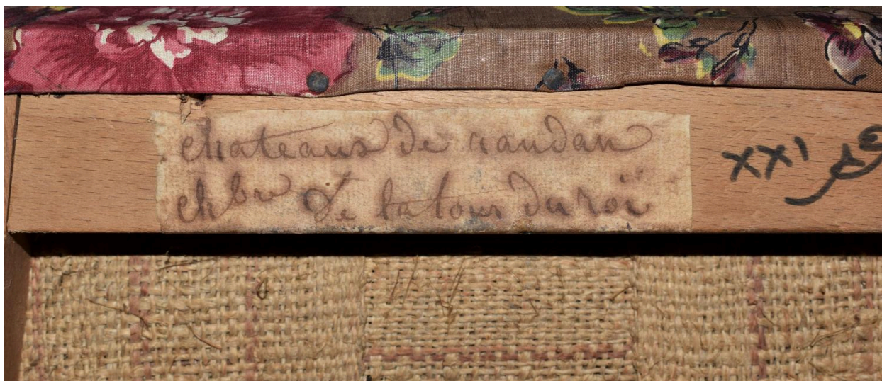
Etiquette au revers de la garniture n°1