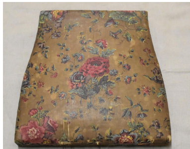
Vue générale de la garniture de siège n°1 IVR84_20226302419NUC4A