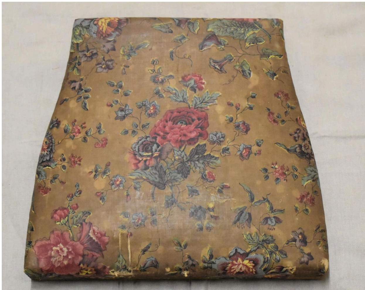
Vue générale de la garniture de siège n°1