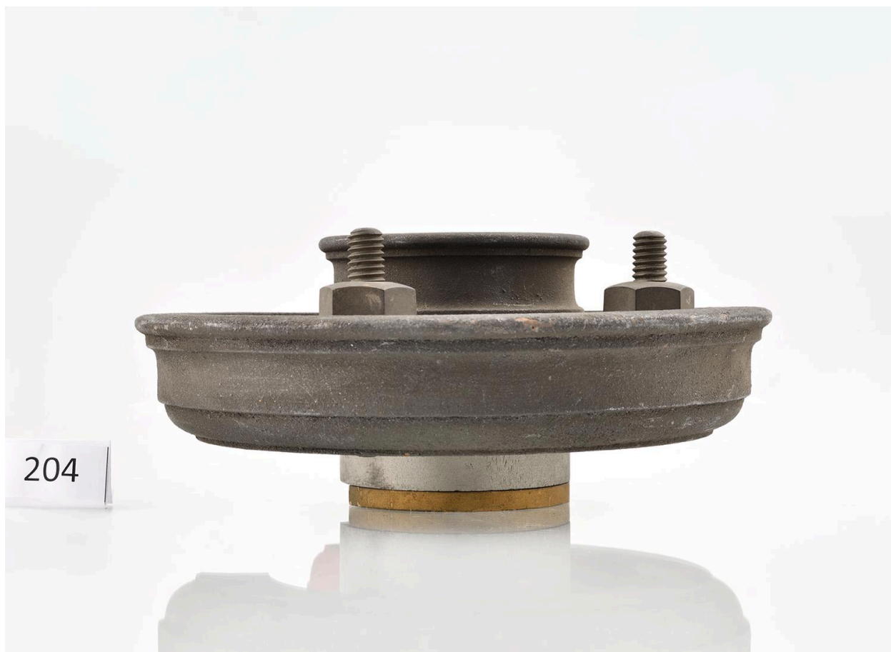
Modèle d'embrayage, vue 3