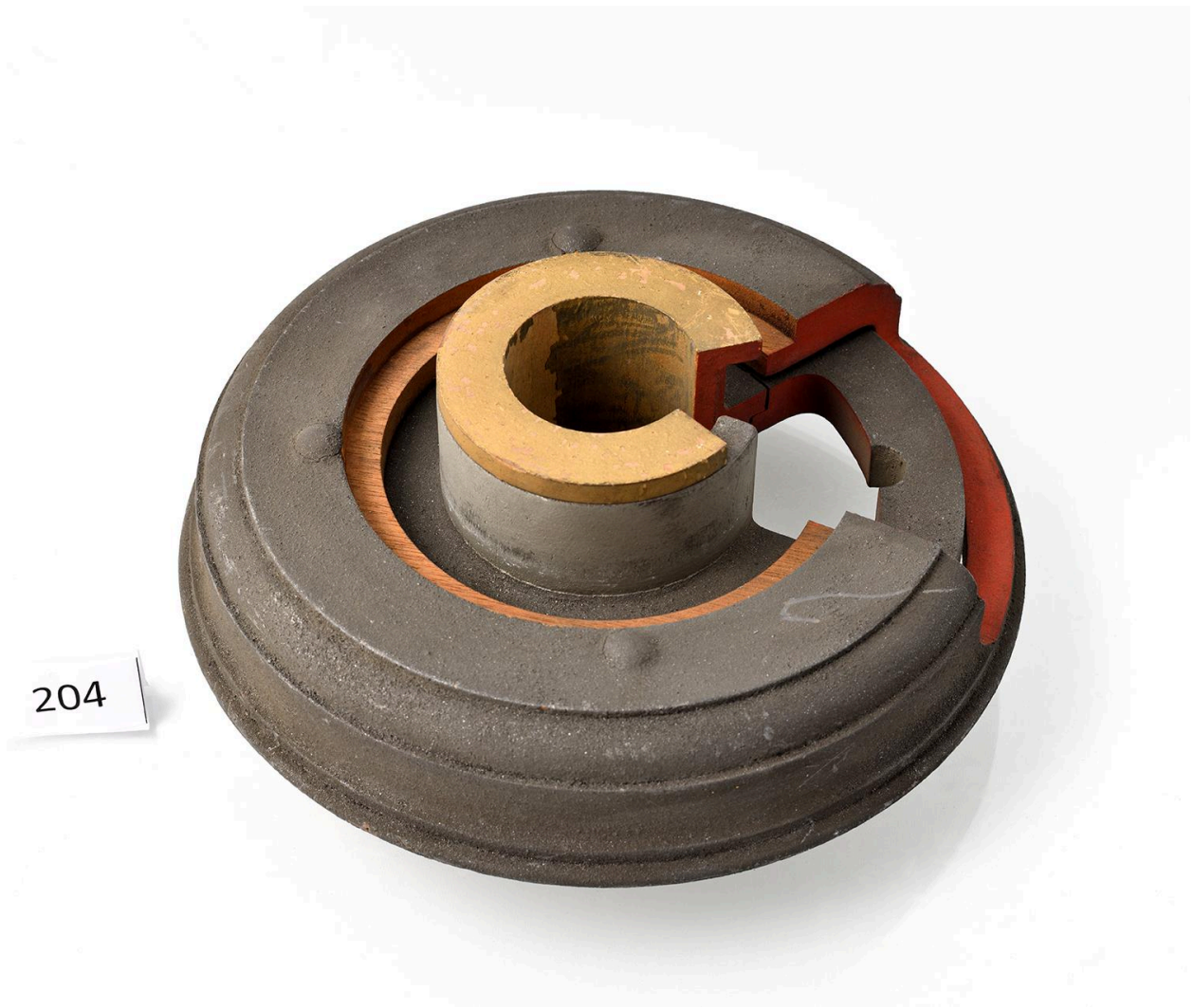
Modèle d'embrayage, vue 2