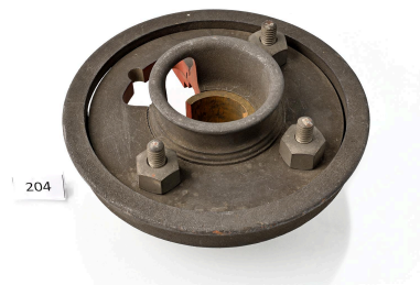
Modèle d'embrayage, vue 4 IVR84_20256901781NUCA