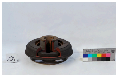
IVR84_20256901310NUCA