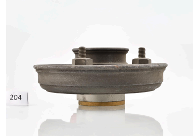
Modèle d'embrayage, vue 3 IVR84_20256901780NUCA