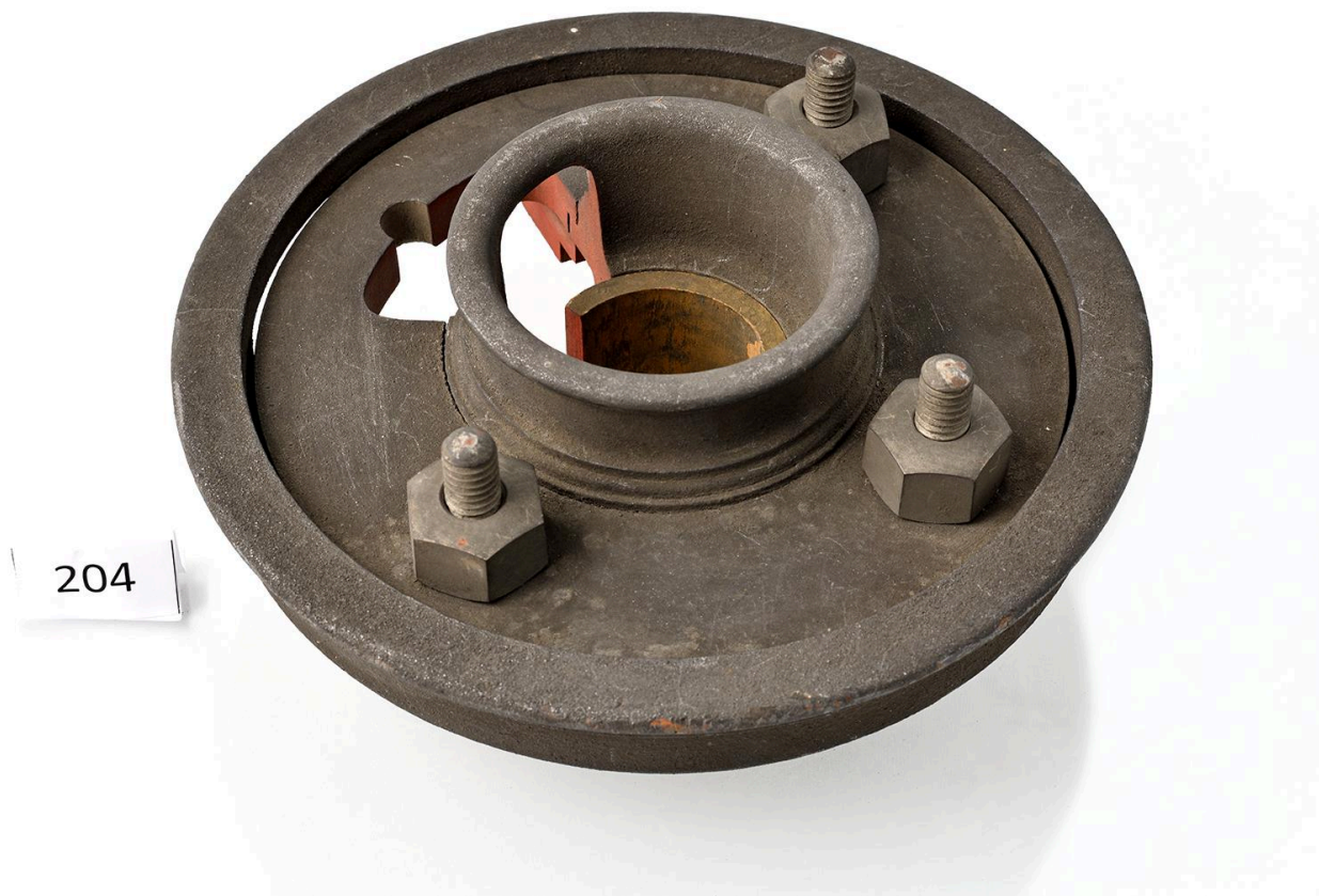
Modèle d'embrayage, vue 4