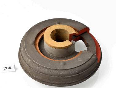
Modèle d'embrayage, vue 2 IVR84_20256901782NUCA