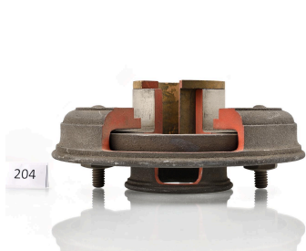
Modèle d'embrayage, vue 1 IVR84_20256901779NUCA