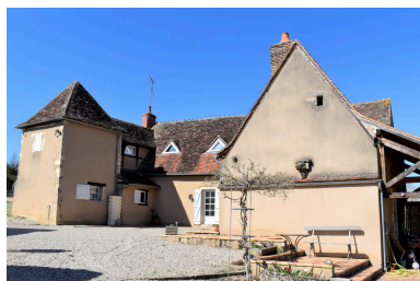
Vue générale de la maison d'habitation, côté sud.