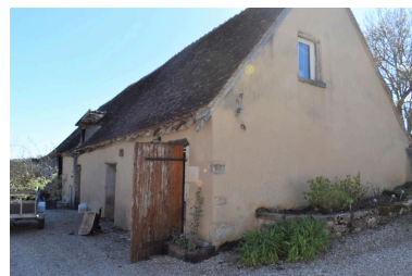
Grange, vue du nord-est IVR84_20240300014NUC4A