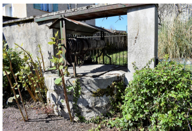
Vue du puits.