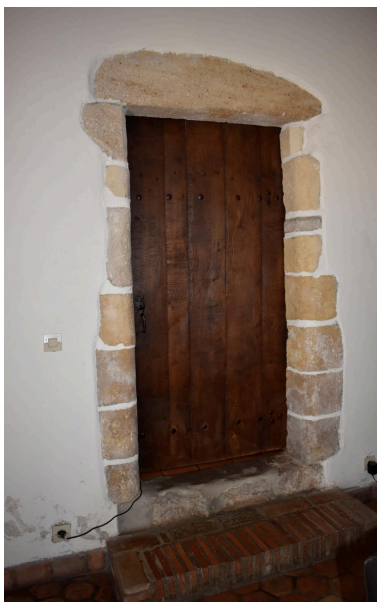
Porte à encadrement de pierre de taille à l'intérieur de l'édifice. IVR84_20240300024NUC4A