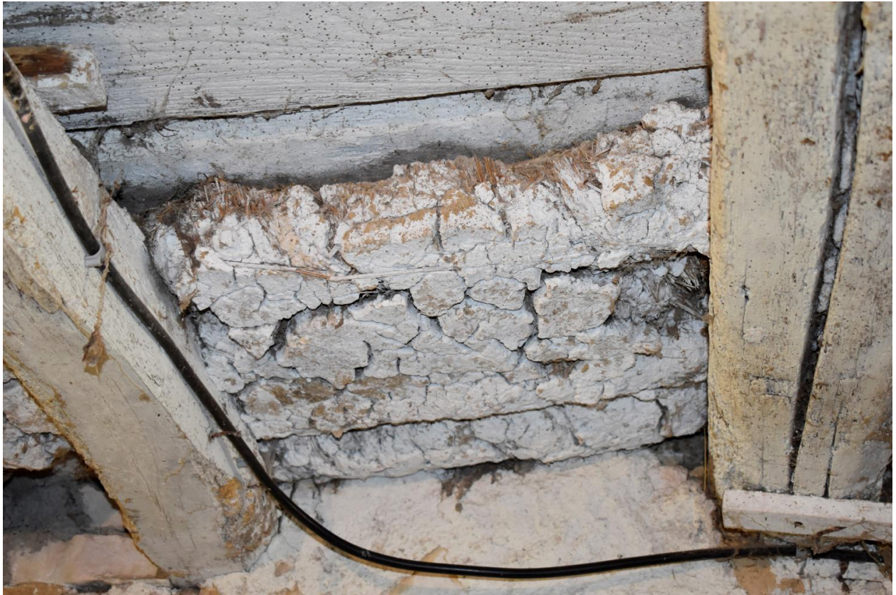
Détails des vestiges de torchis dans la bergerie.