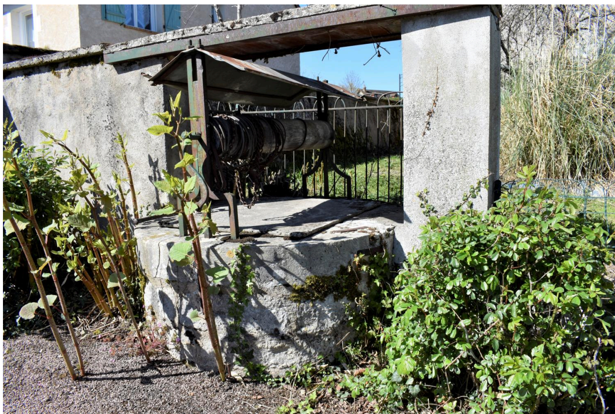
Vue du puits.