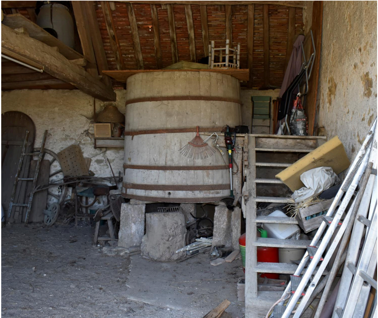
Vue du cuvage à l'intérieur de la grange.