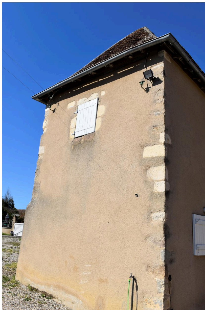
Vue rapprochée de la tour.