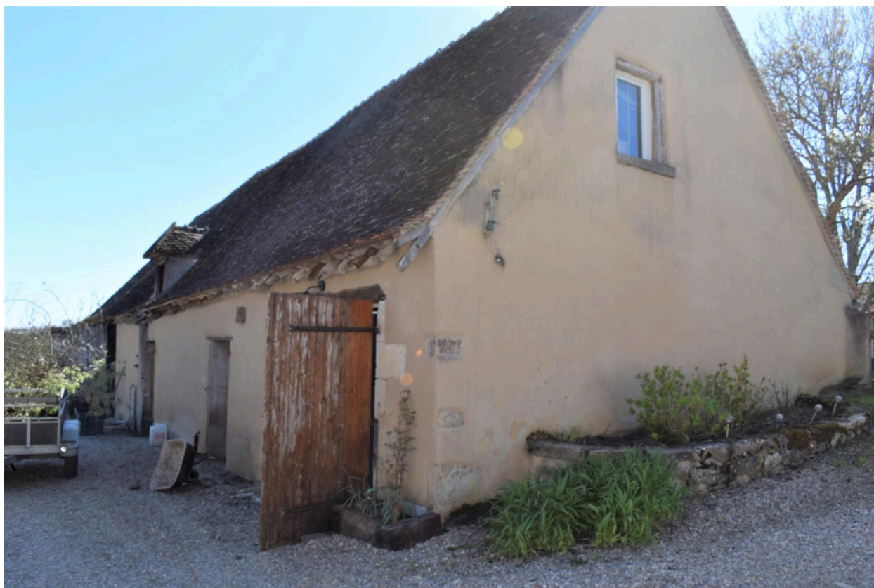
Grange, vue du nord-est