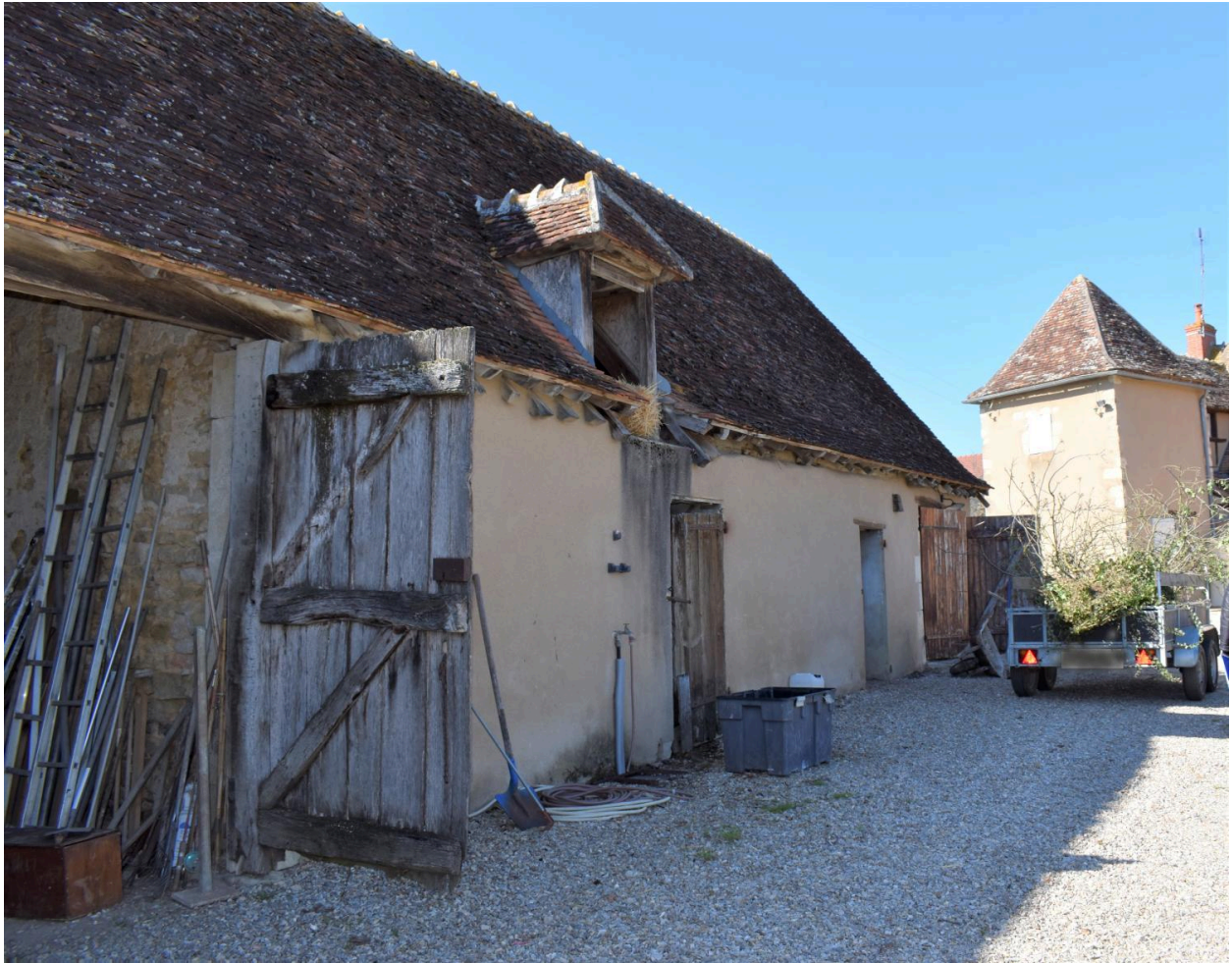
Vue du mur gouttereau est de la grange.