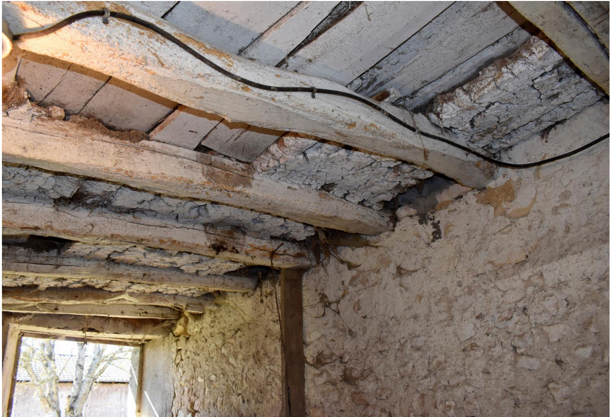
Vue du plafond de la bergerie et des vestiges de torchis.