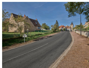
Vue nord-est depuis la route de Moulins à Sancoins