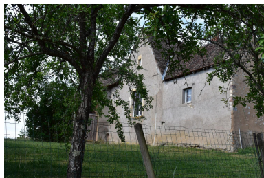
Vue du côté oriental