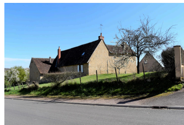
Vue du nord-ouest IVR84_20240300013NUC4A