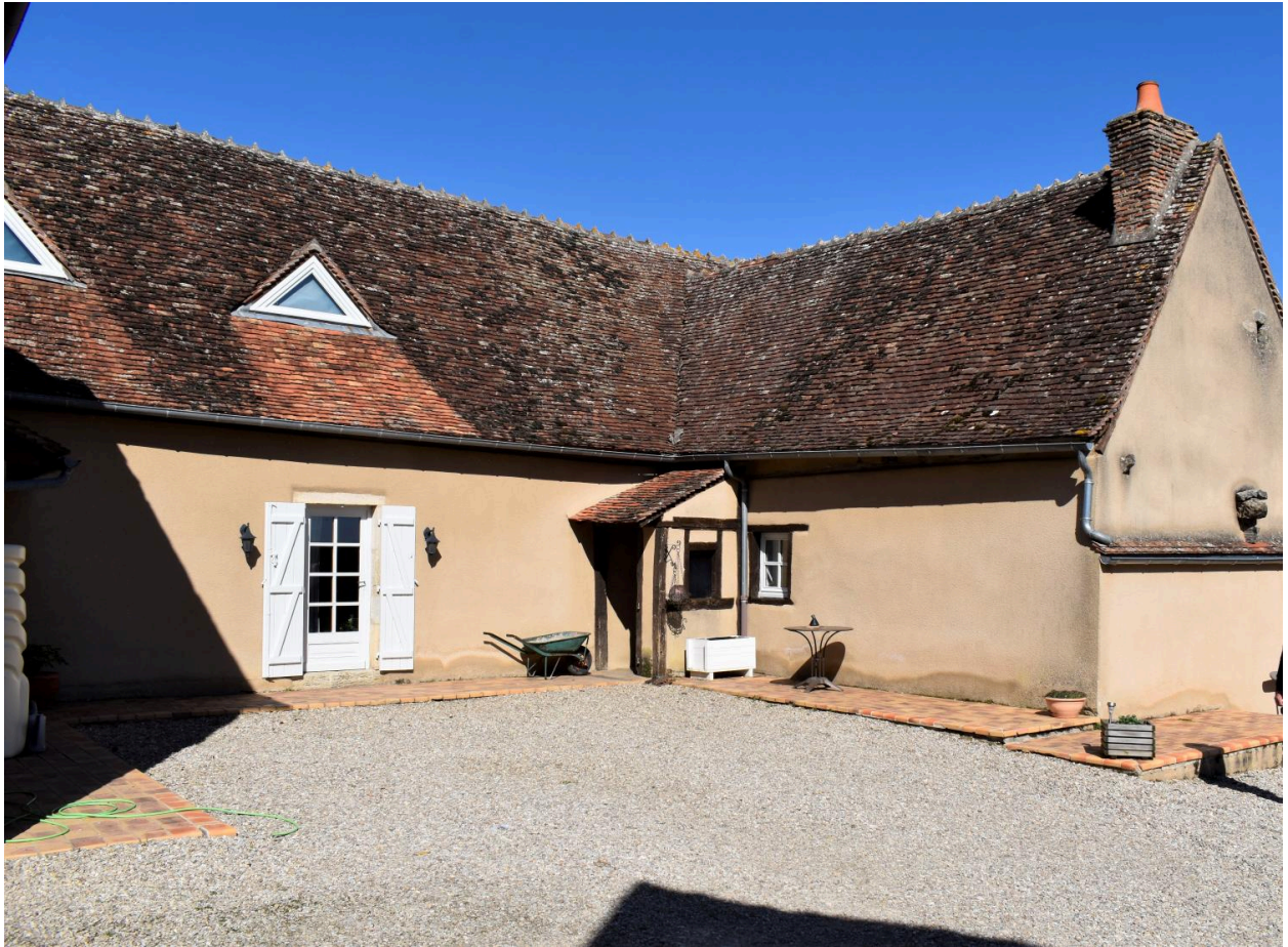
Vue du mur gouttereau sud et de l'aile sud-est.