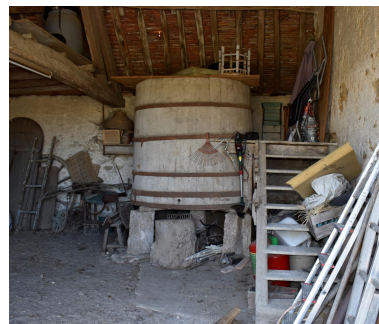
Vue du cuvage à l'intérieur de la grange. IVR84_20240300015NUC4A