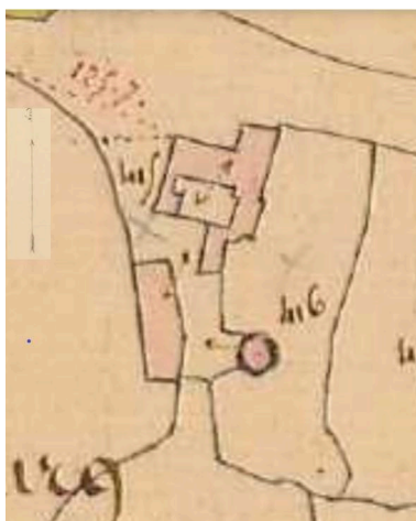
Implantation de la maison, parcelle 415 sur le plan cadastral dit napoléonien en 1831