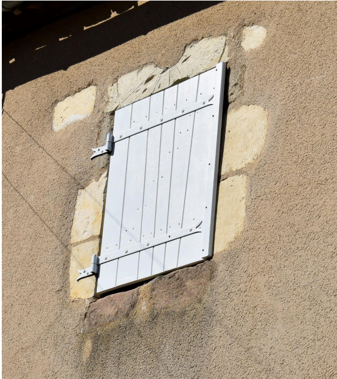
Fenêtre du 1er étage de la tour, détail. Le linteau est un remploi d'un fragment de cadran solaire.