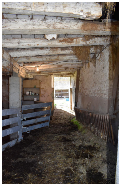
Vue de l'aménagement de la bergerie. IVR84_20240300019NUC4A