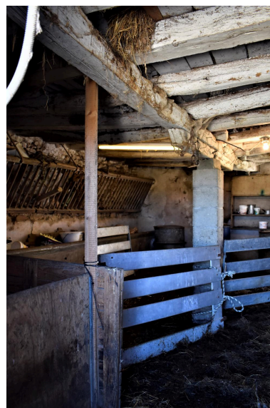
Vue de l'aménagement intérieur de l'étable-bergerie.