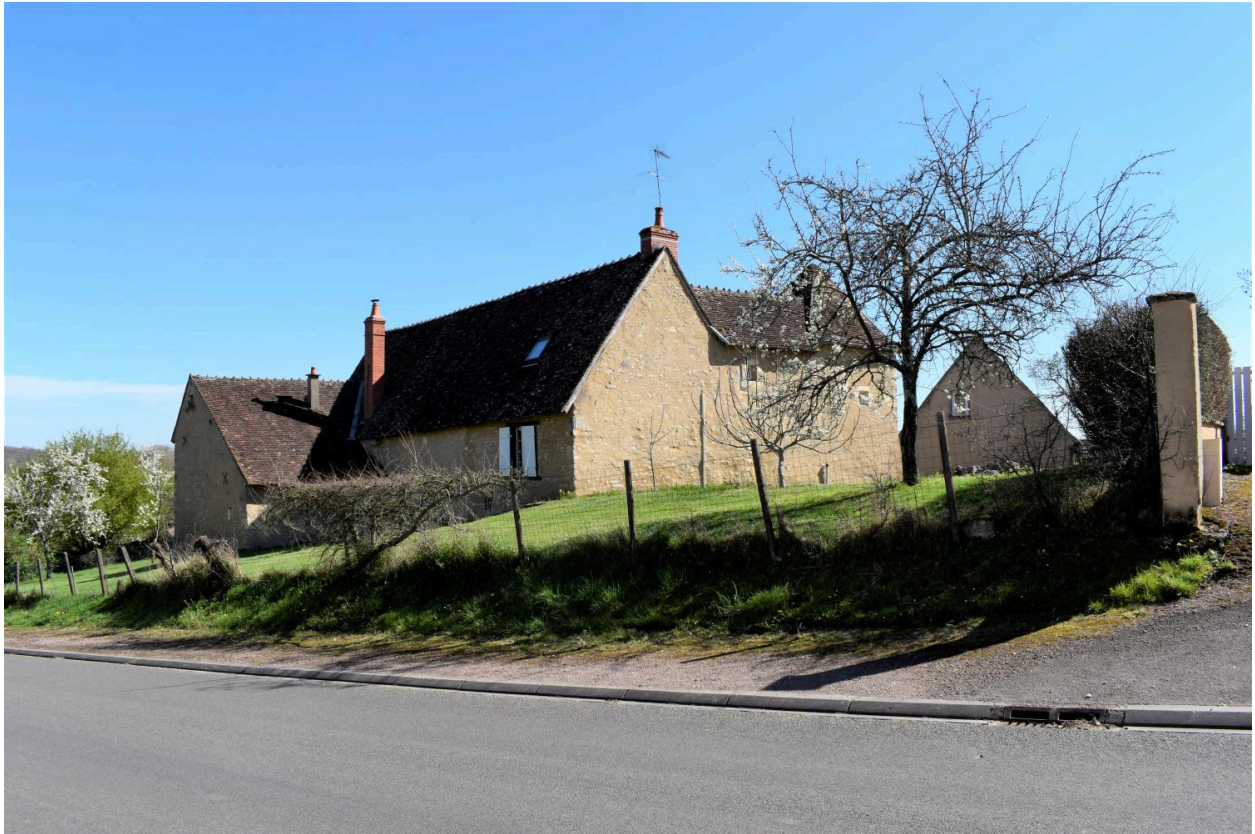
Vue du nord-ouest