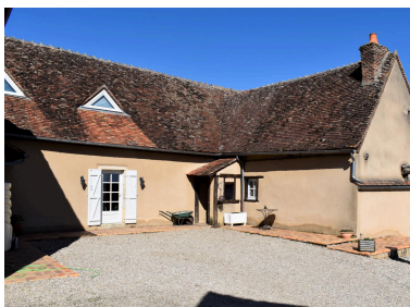
Vue du mur gouttereau sud et de l'aile sud-est.