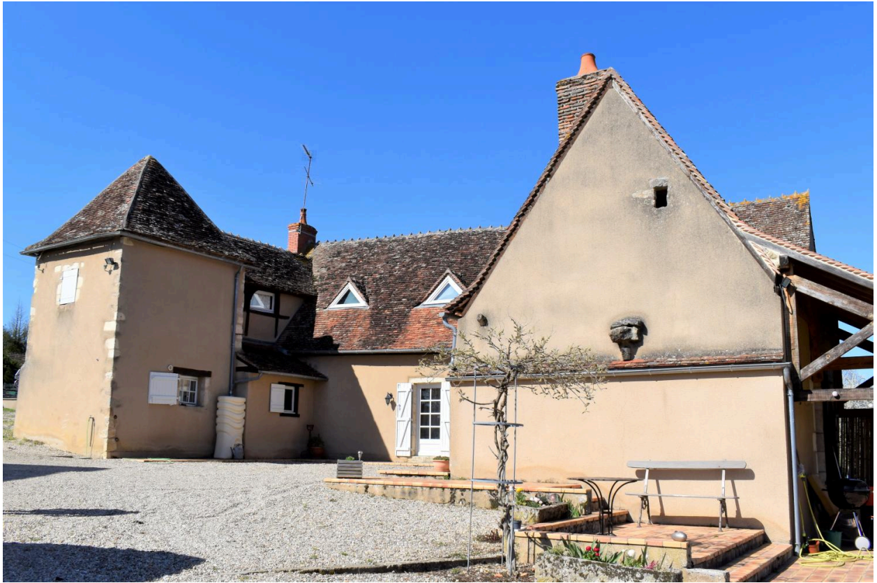
Vue générale de la maison d'habitation, côté sud.