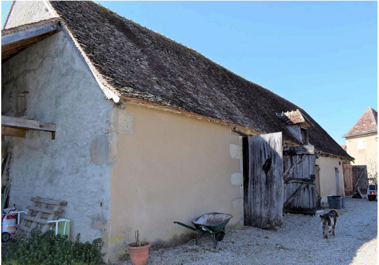
Vue du sud est de la grange