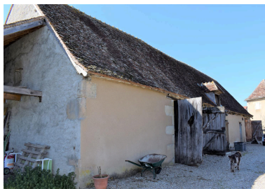
Vue du sud est de la grange