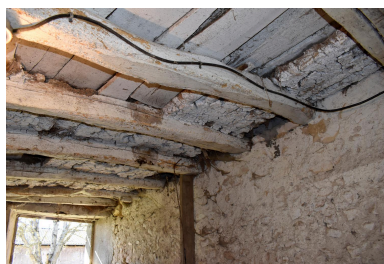
Vue du plafond de la bergerie et des vestiges de torchis.