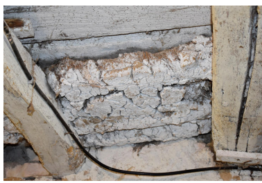
Détails des vestiges de torchis dans la bergerie.