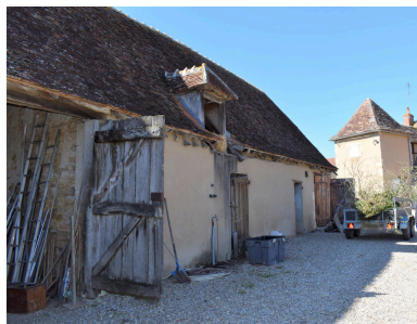
Vue du mur gouttereau est de la grange. IVR84_20240300021NUC4A