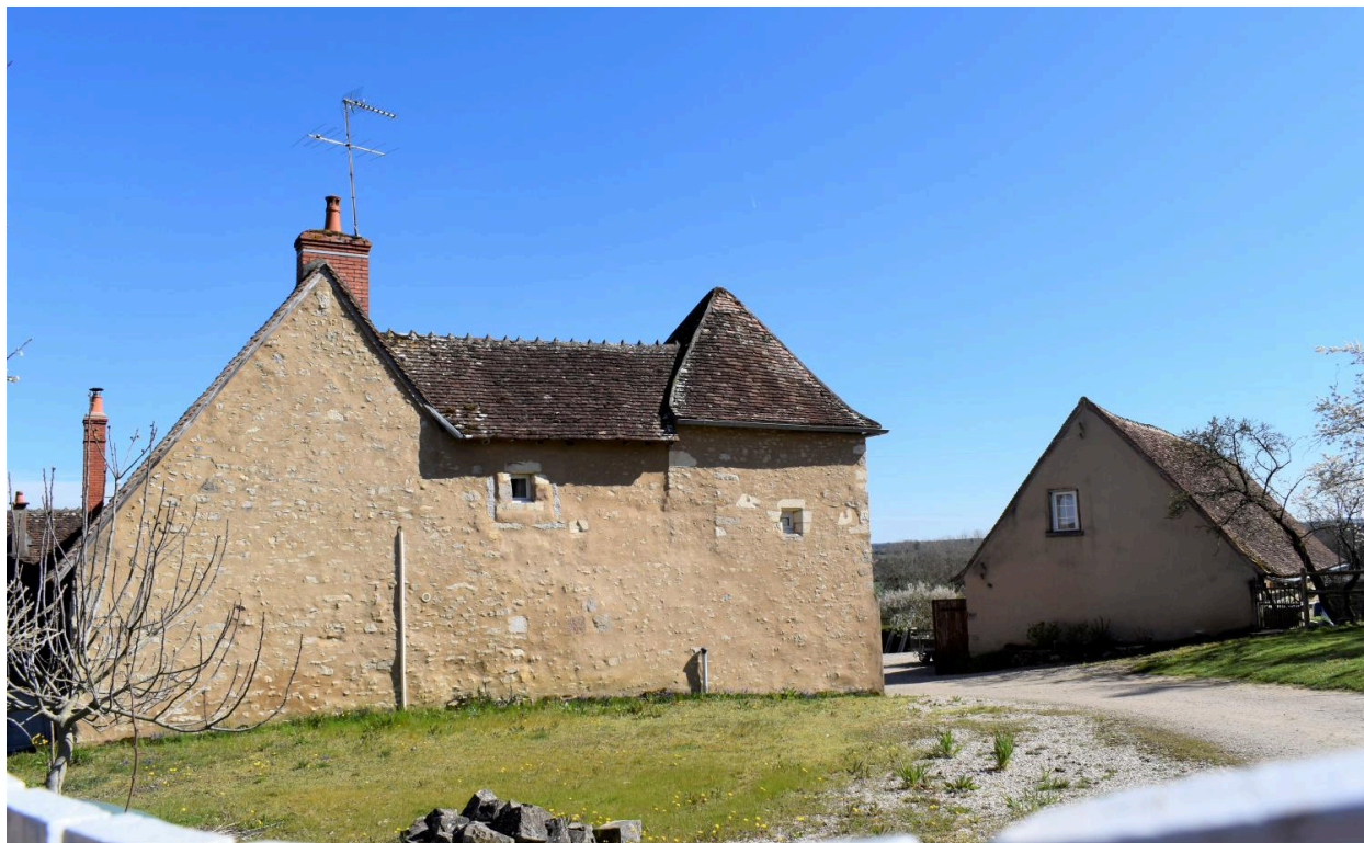
Vue du côté occidental