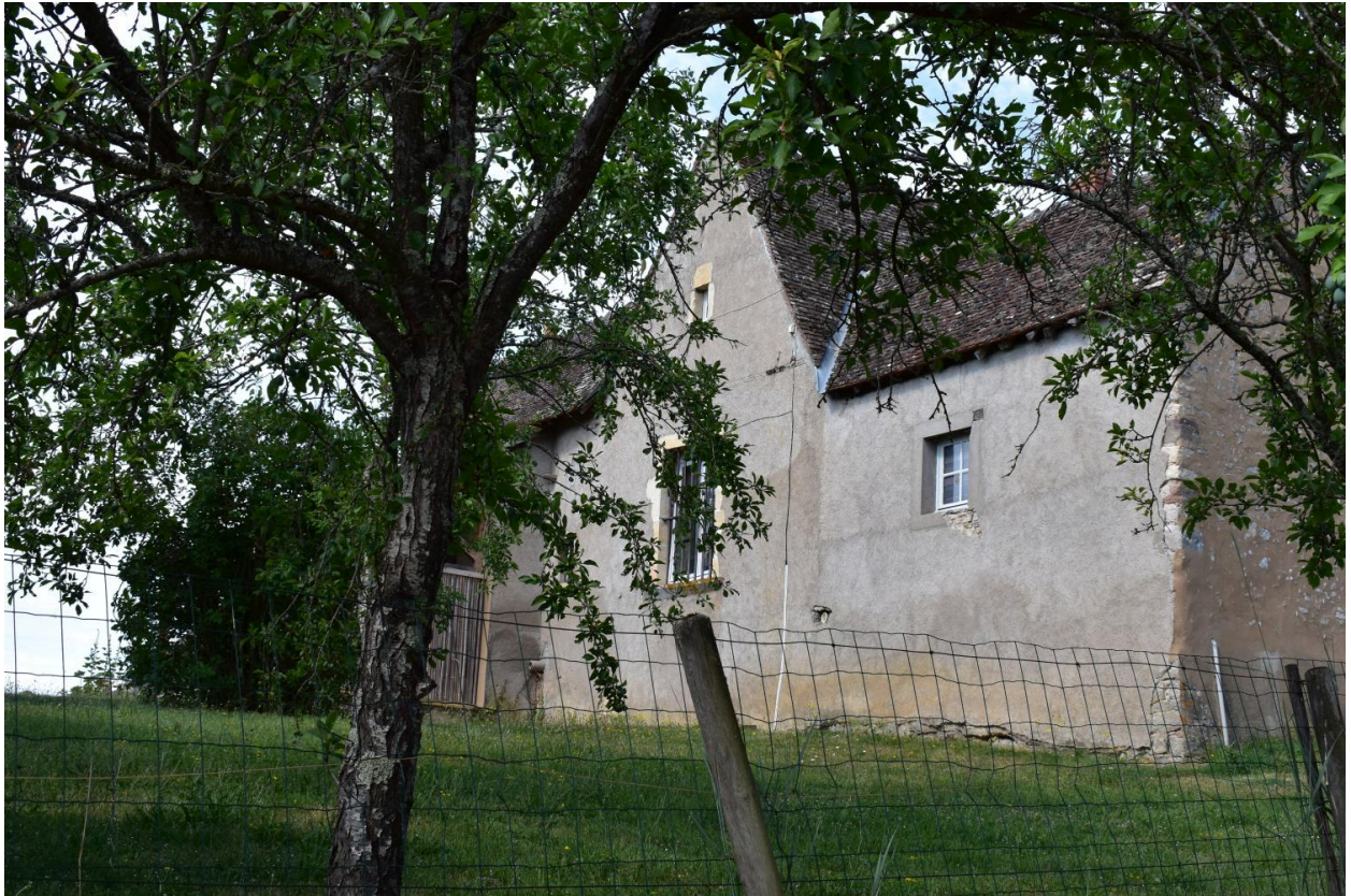
Vue du côté oriental