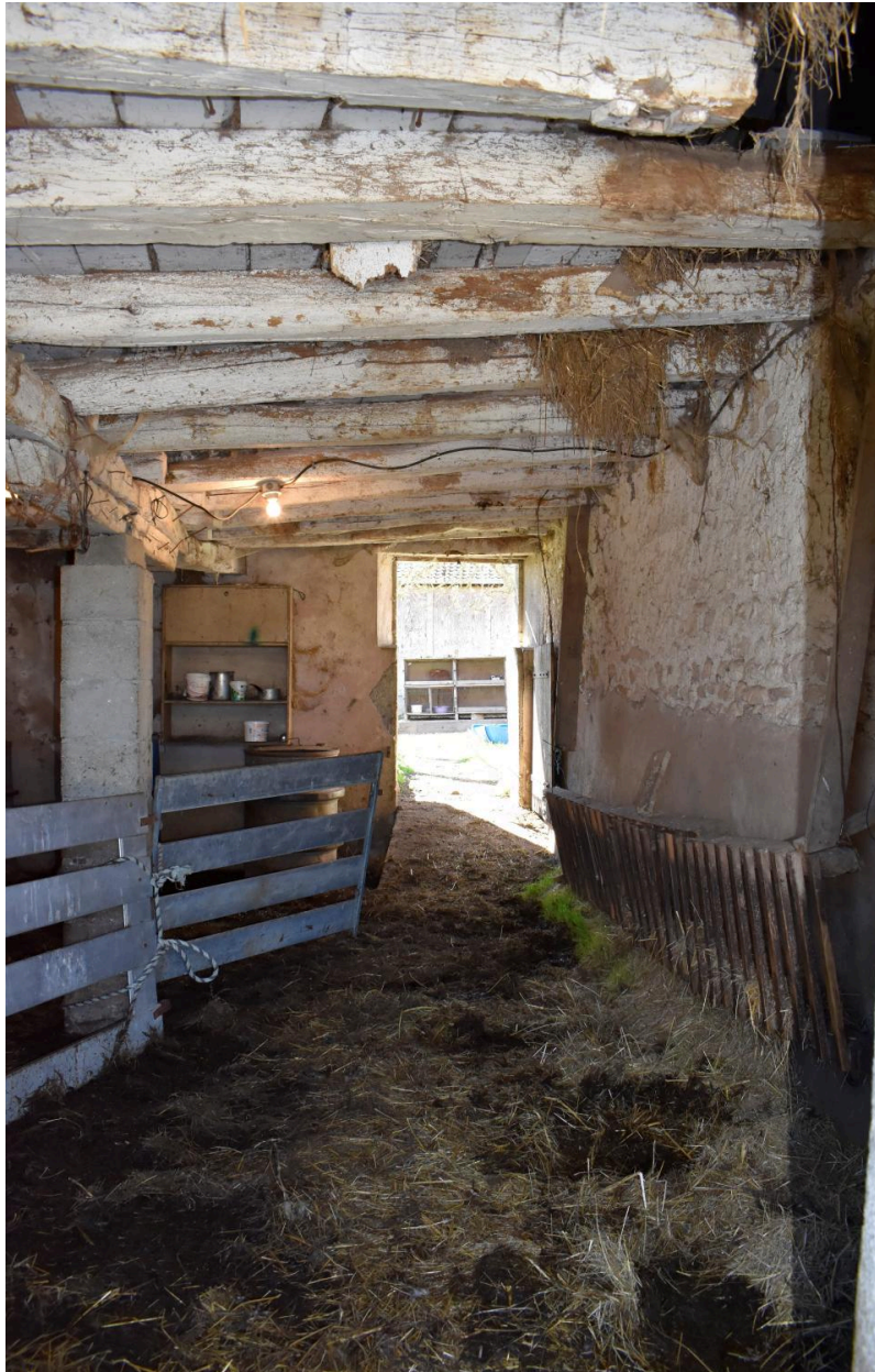
Vue de l'aménagement de la bergerie.