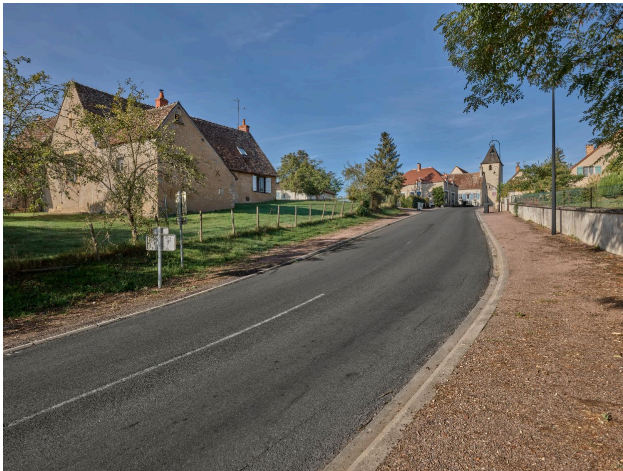
Vue nord-est depuis la route de Moulins à Sancoins