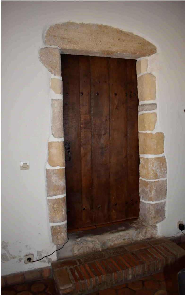
Porte à encadrement de pierre de taille à l'intérieur de l'édifice.