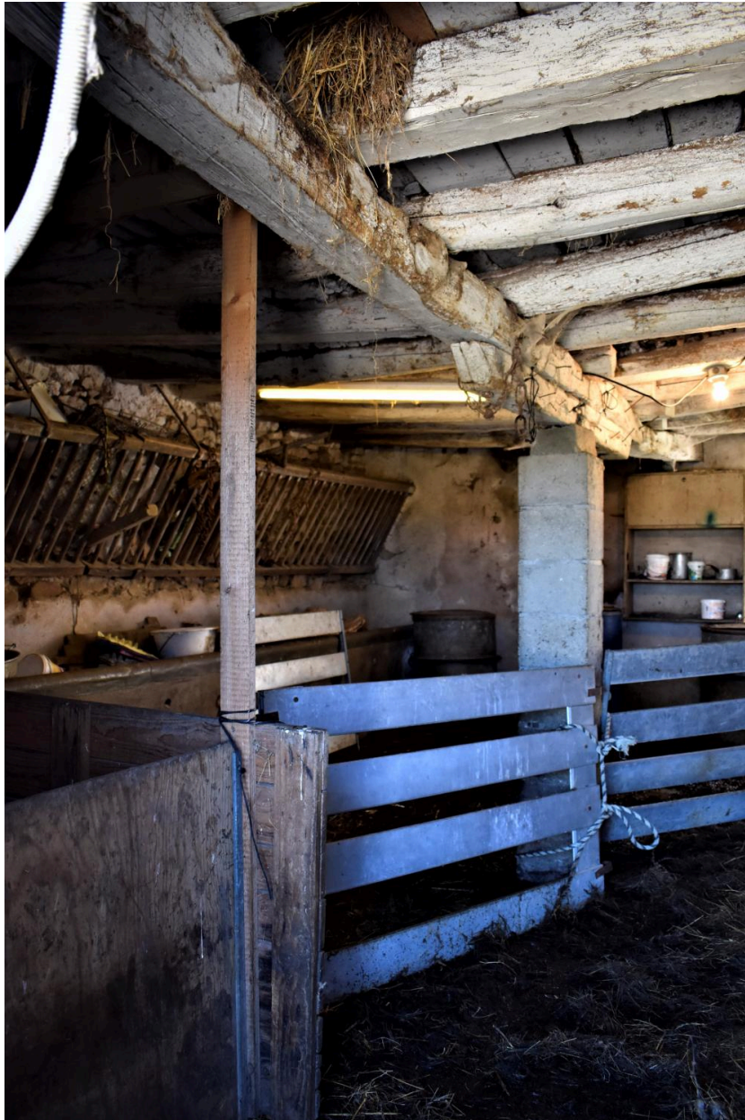
Vue de l'aménagement intérieur de l'étable-bergerie.