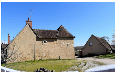
Vue du côté occidental IVR84_20240300011NUC4A