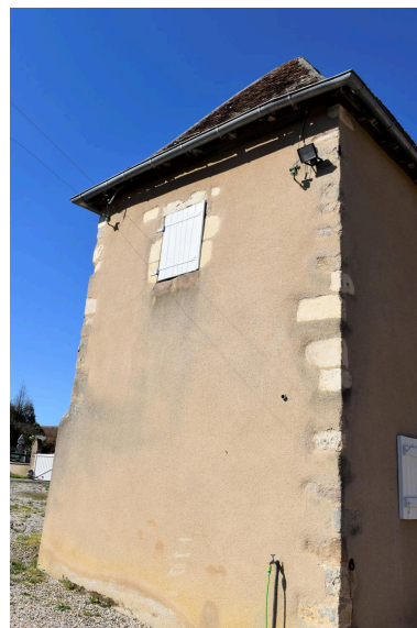
Vue rapprochée de la tour.