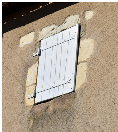
Fenêtre du 1er étage de la tour, détail. Le linteau est un remploi d'un fragment de cadran solaire.