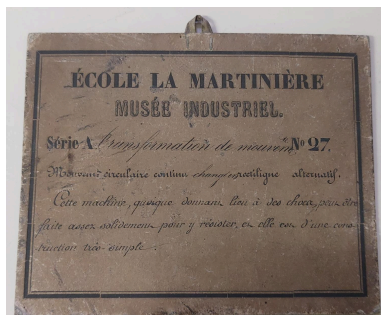
Cartel A27 IVR84_20256902026NUCA