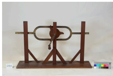
IVR84_20256900993NUCA