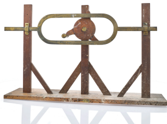
Vue d'ensemble IVR84_20246900198NUCA