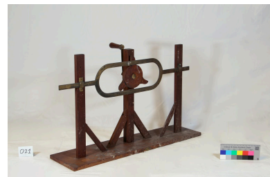
IVR84_20256900994NUCA