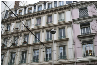
Vue générale de la façade IVR82_20046904356NUCA