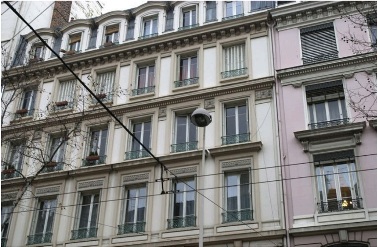
Vue générale de la façade