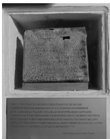
Vue du couvercle, portant l'inscription. IVR82_20002600143X