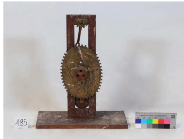
Modèle d'engrenage IVR84_20256901283NUCA