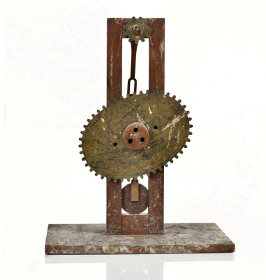
Engrenage hélicoïdal IVR84_20256901962NUCA