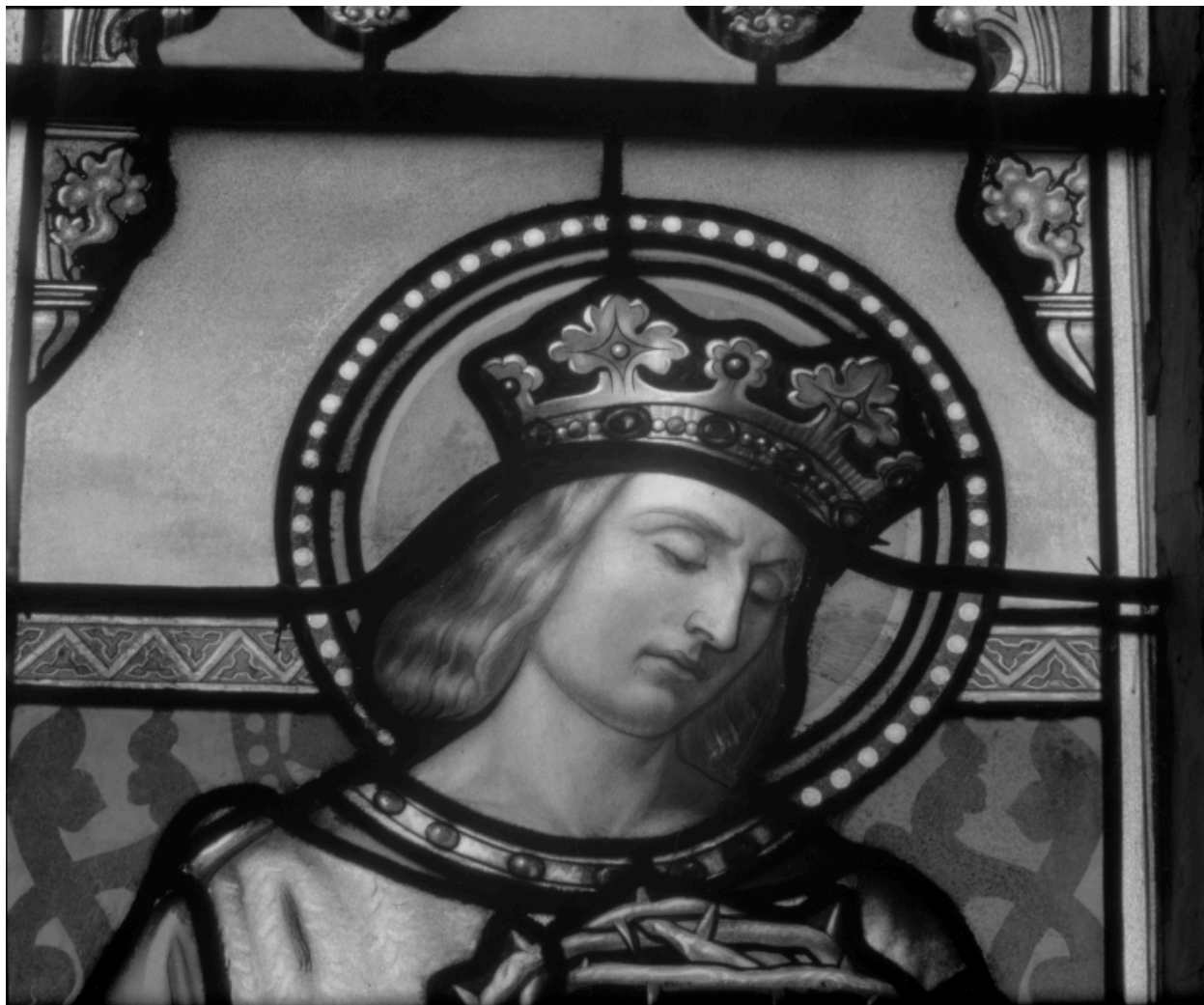
Détail des vitraux du chœur, baie 2 : saint Louis.