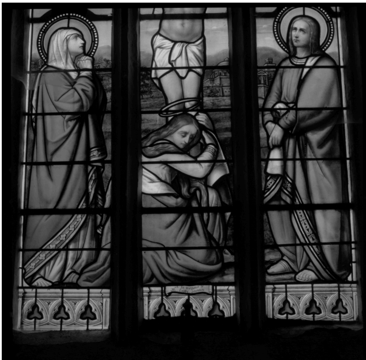
Détail des vitraux du chœur, baie axiale : Marie-Madeleine au pied de la croix.