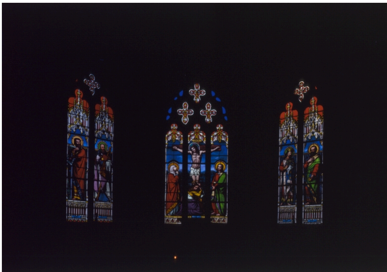
Ensemble des vitraux du choeur.