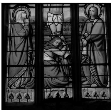
Détail des vitraux du chœur, baie axiale : Marie-Madeleine au pied de la croix.