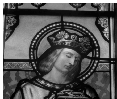
Détail des vitraux du chœur, baie 2 : saint Louis.