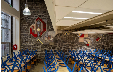
Décoration du restaurant scolaire : panneau n°1, vue d'ensemble de la partie inférieure IVR84_20256302235NUCA