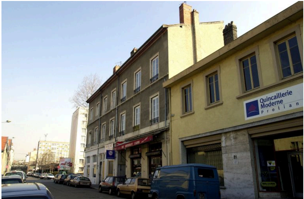
Elévation rue Claudius-Collonge, depuis le sud