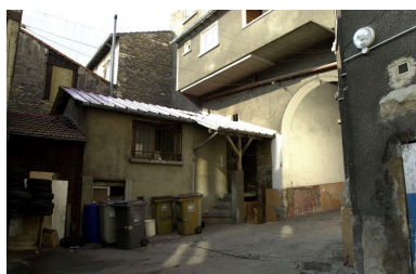
Vue de la maison construite au sud de la cour IVR82_20016900398NUCA