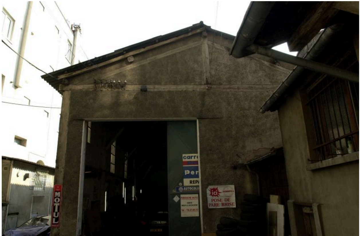
Le garage de réparation automobile