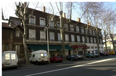
Elévation, cours Suchet