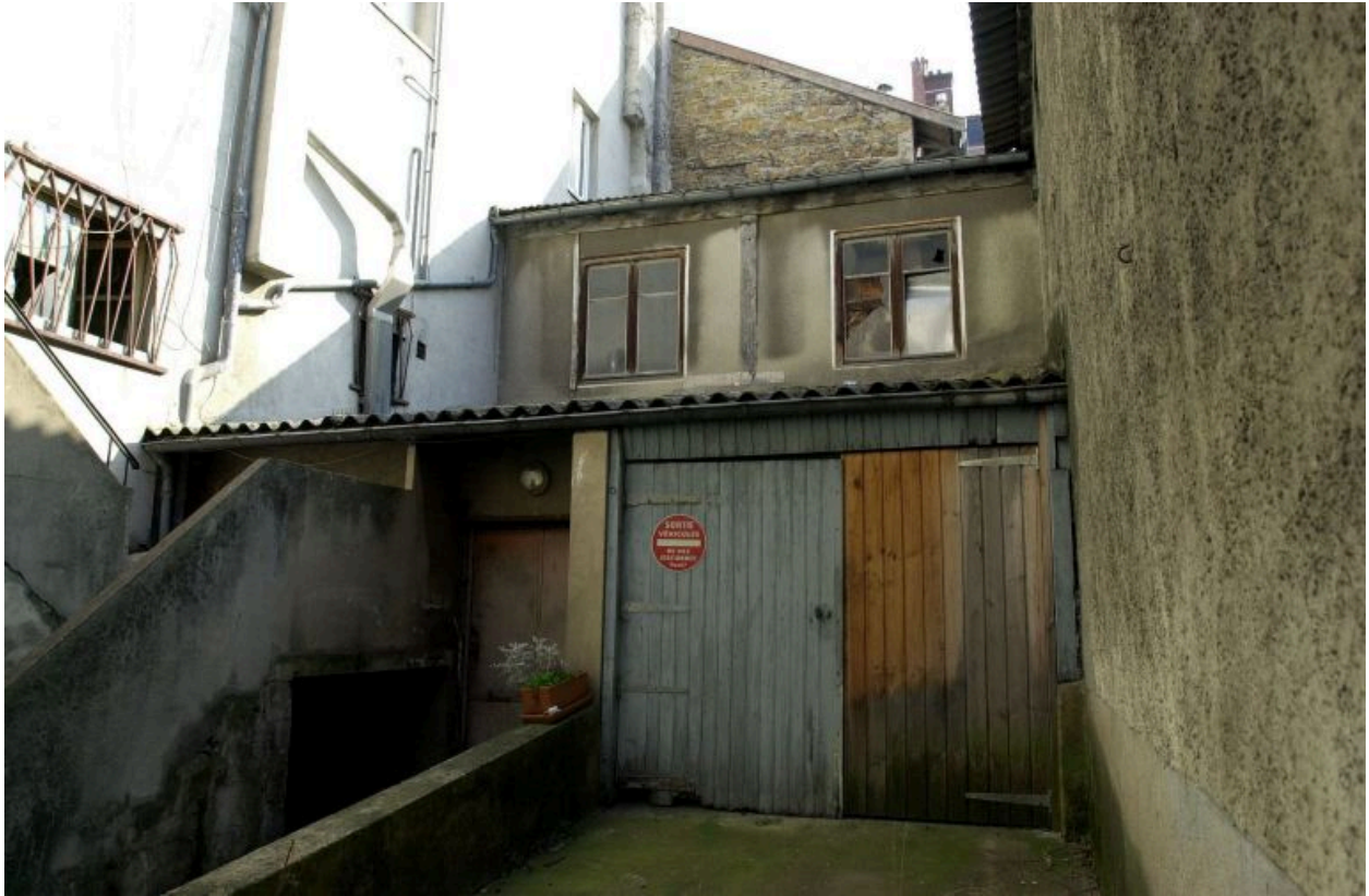
Bâtiment au fond de la cour, au nord-est