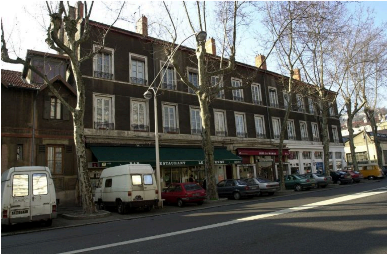
Elévation, cours Suchet