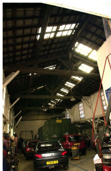
Le garage de réparation automobile : intérieur, vue de la charpente IVR82_20016900400NUCA