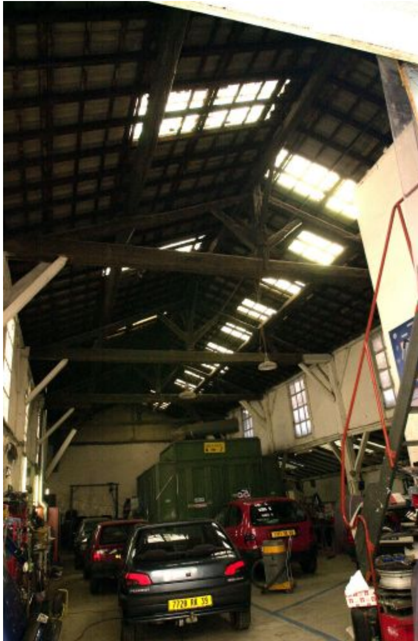
Le garage de réparation automobile : intérieur, vue de la charpente