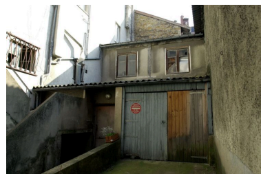
Bâtiment au fond de la cour, au nord-est IVR82_20016900395NUCA