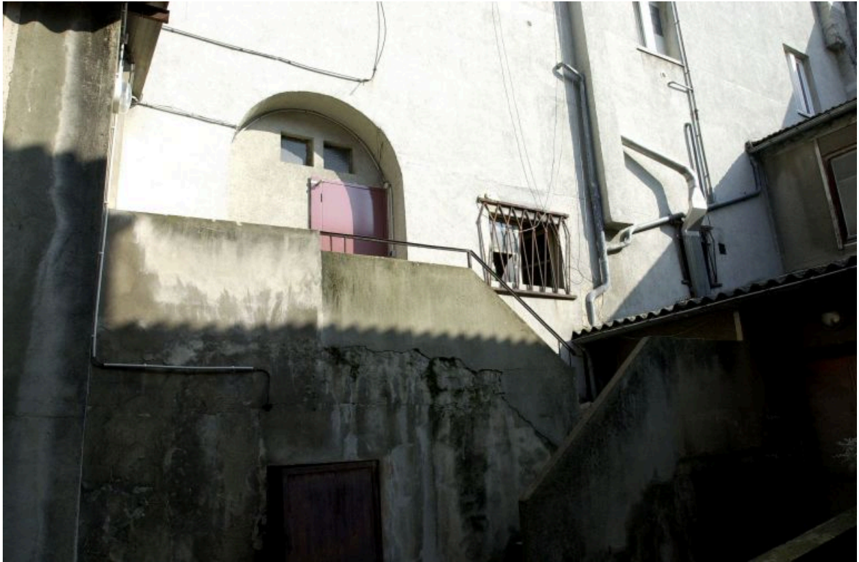
Elévation nord : vue de la travée de l'escalier cours Suchet