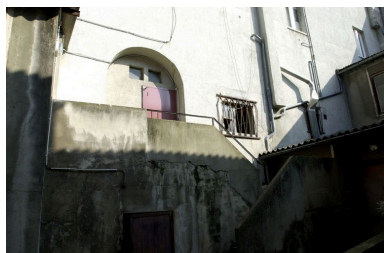
Elévation nord : vue de la travée de l'escalier cours Suchet IVR82_20016900396NUCA