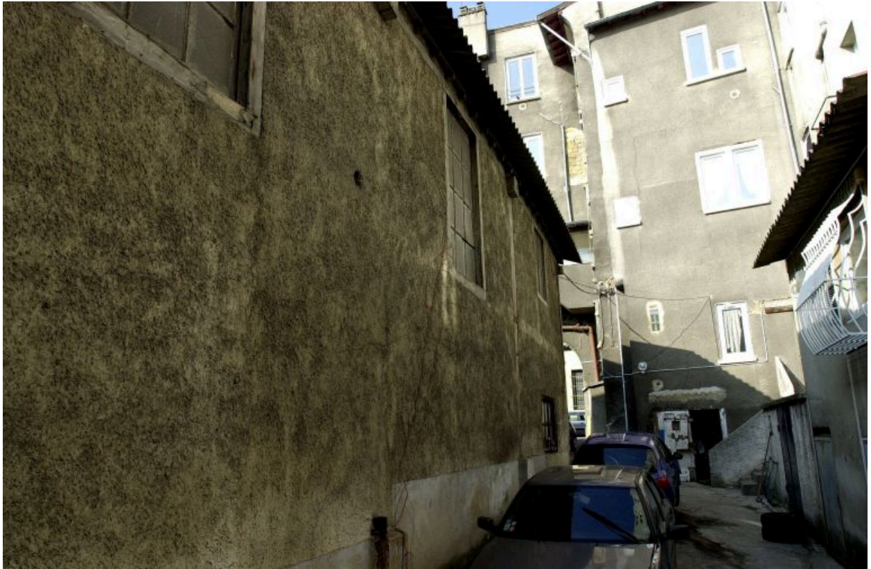
Vue de la cour depuis l'est, le mur du garage à gauche