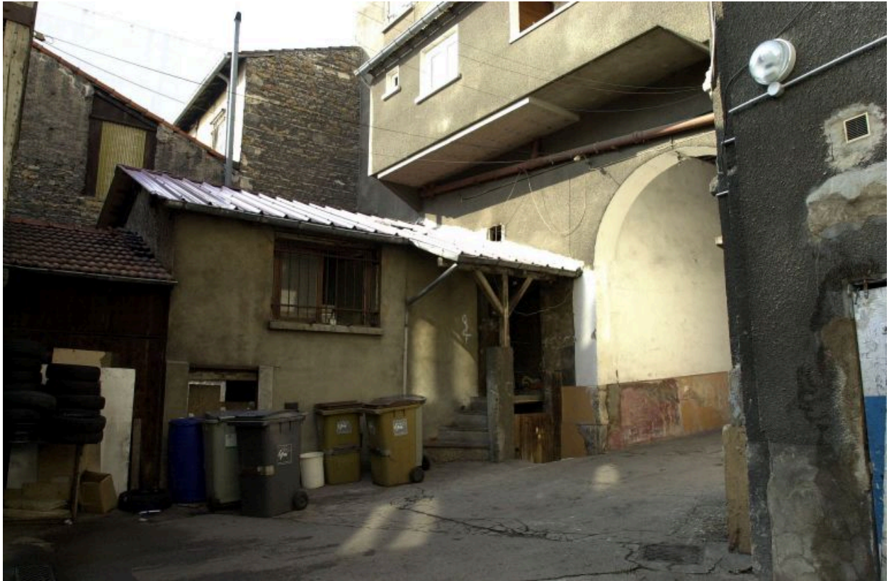
Vue de la maison construite au sud de la cour