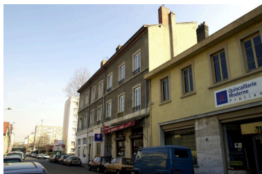
Elévation rue Claudius- Collonge, depuis le sud IVR82_20016900393NUCA