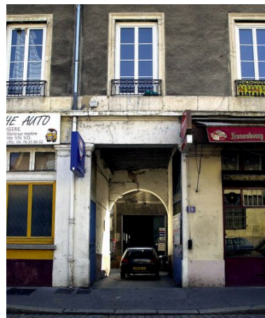
Vue du passage cocher, rue Claudius-Collonge IVR82_20016900394NUCA