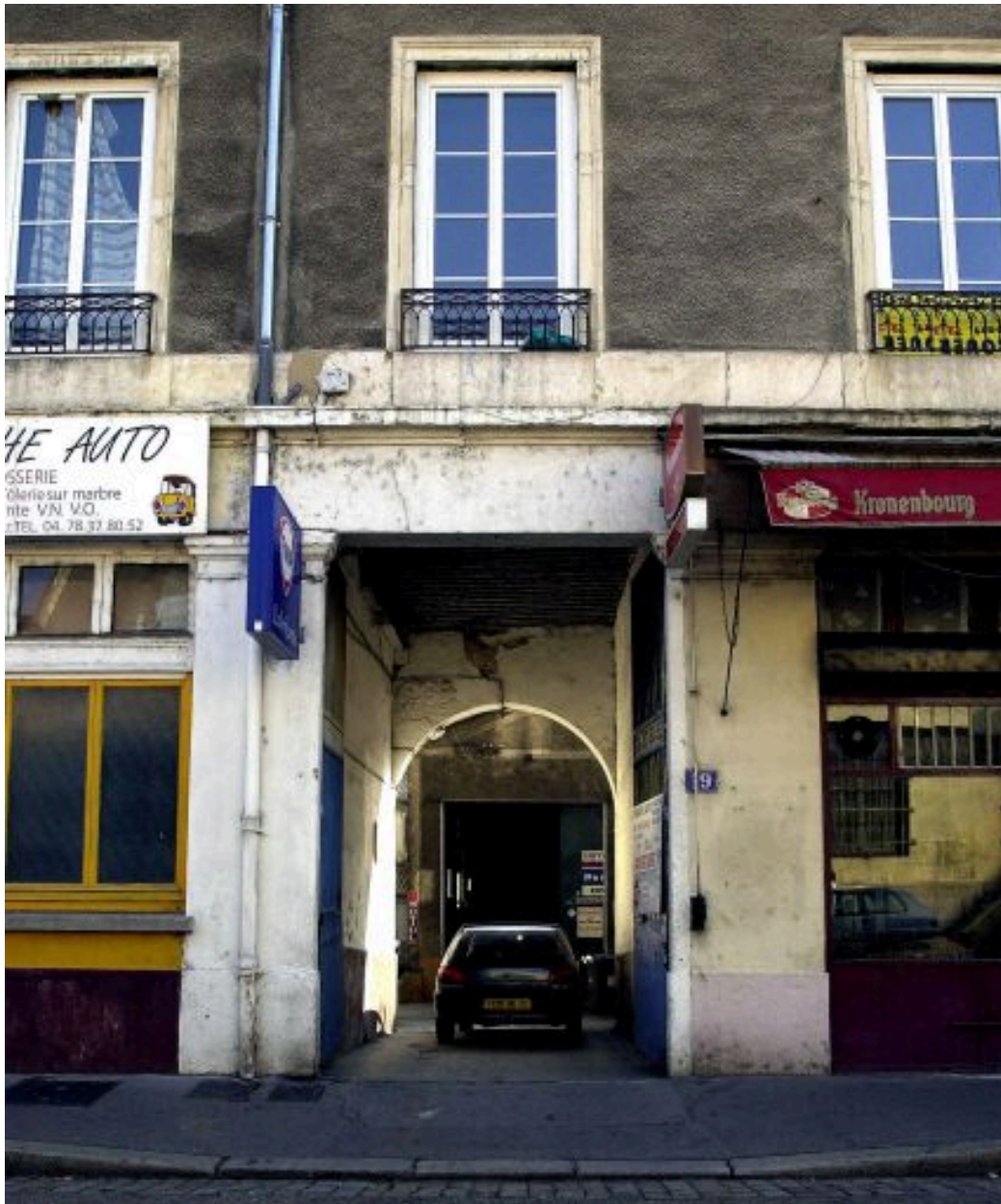
Vue du passage cocher, rue Claudius-Collonge