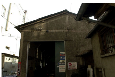
Le garage de réparation automobile IVR82_20016900399NUCA