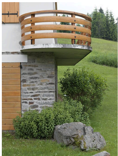
Détail de l'extrémité en arrondi du balcon IVR82_20107401212NUCA