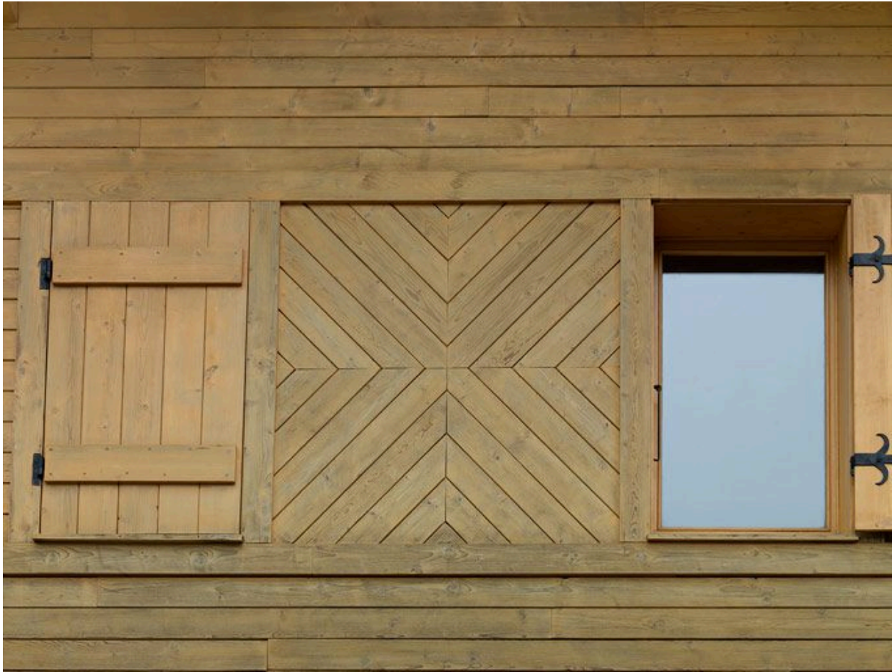
Détail du travail du bois au niveau des baies de l'étage en surcroît