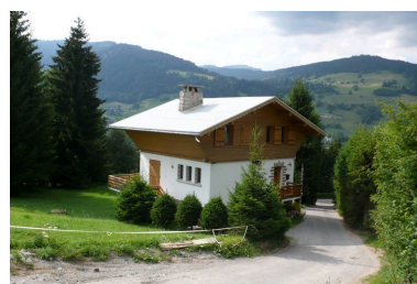
Vue d'ensemble depuis le nord IVR82_20127401918NUCA