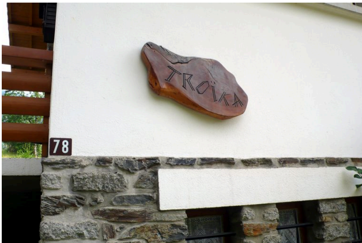
Enseigne du chalet