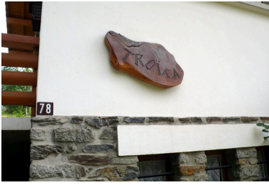
Enseigne du chalet IVR82_20127401917NUCA