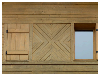
Détail du travail du bois au niveau des baies de l'étage en surcroît IVR82_20107401215NUCA