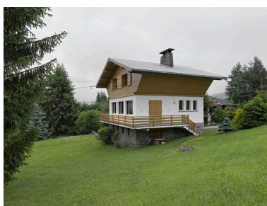
Vue générale depuis le sud IVR82_20107401213NUCA