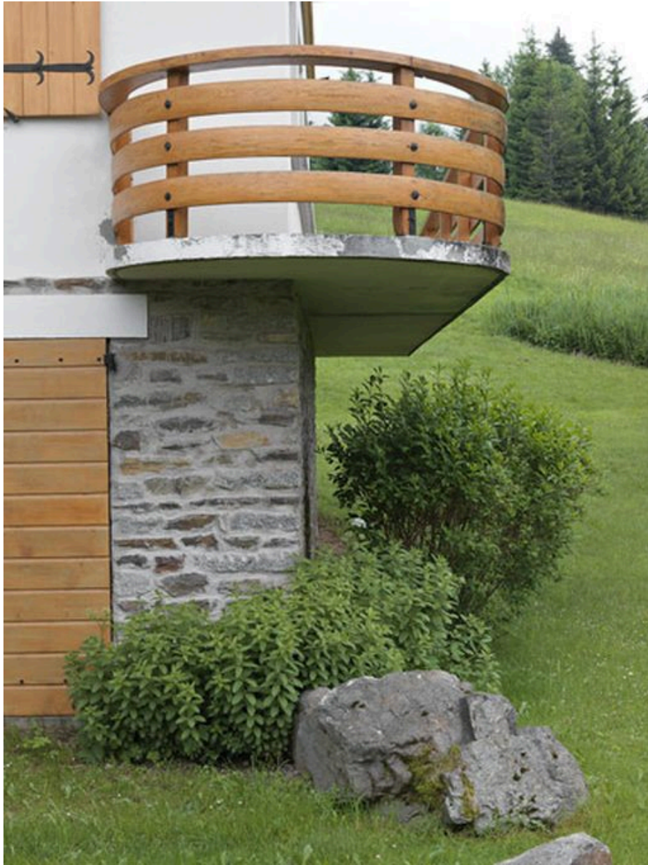
Détail de l'extrémité en arrondi du balcon