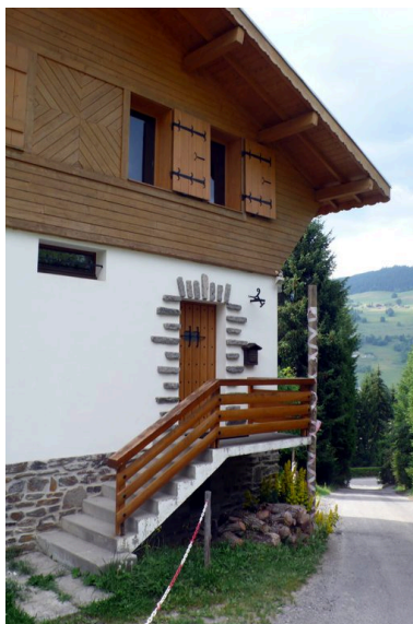
Entrée principale IVR82_20127401916NUCA