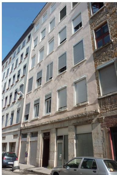
Façade principale IVR84_20186901313NUCA