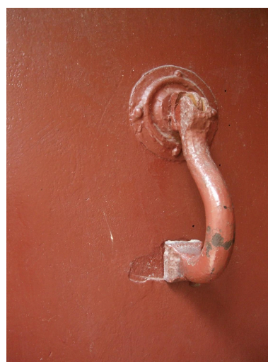
Détail porte : heurtoir métallique IVR84_20186901318NUCA