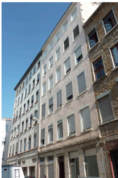
Vue d'ensemble IVR84_20186901314NUCA