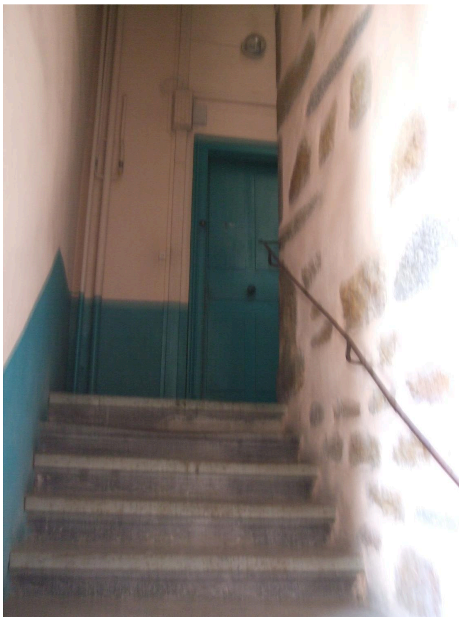
Escalier à mur noyau plein