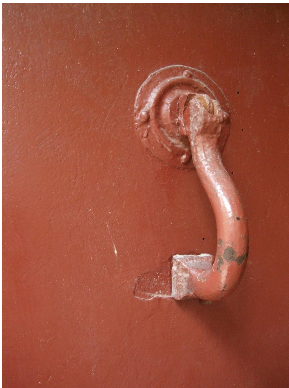
Détail porte : heurtoir métallique