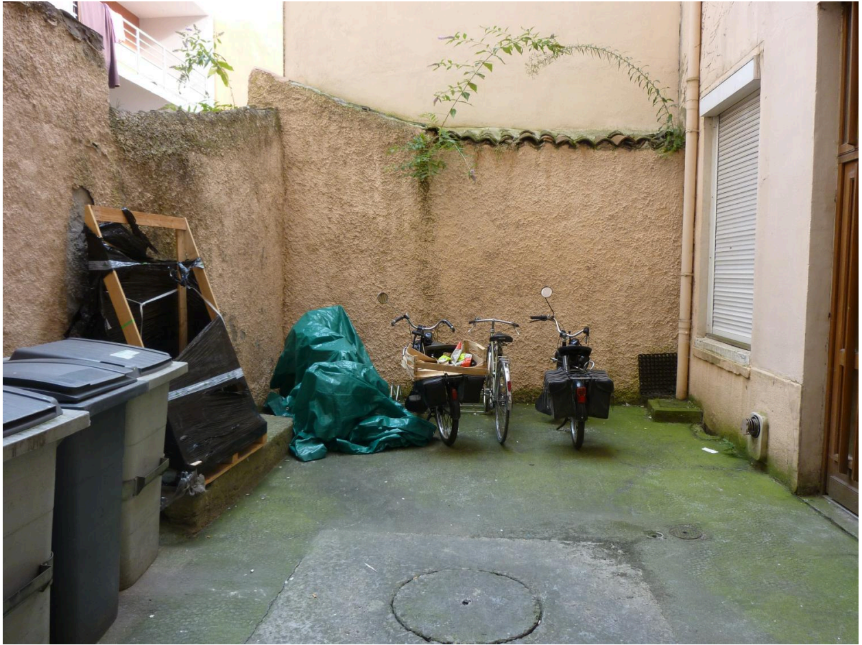
Vue de la cour