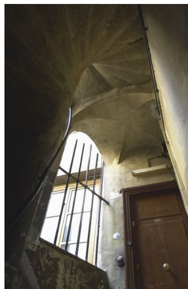
Escalier et voûte d'arêtes d'un palier