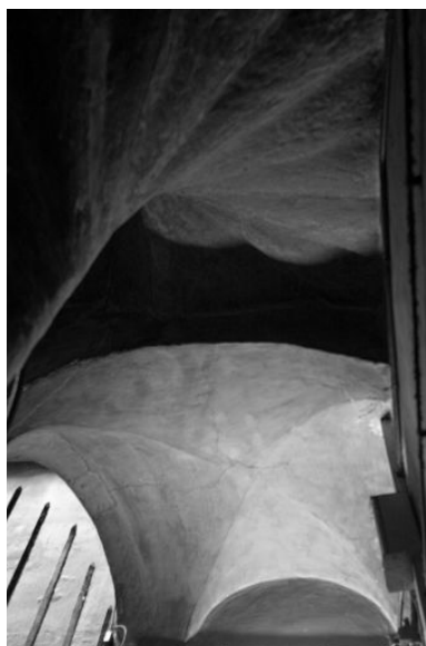
Escalier et voûte d'arêtes d'un palier, détail IVR82_20036901380NUCA