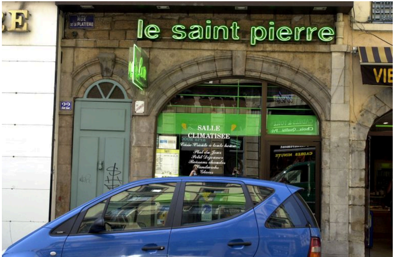
Façade principale sur la rue de la Platière, rez-de-chaussée