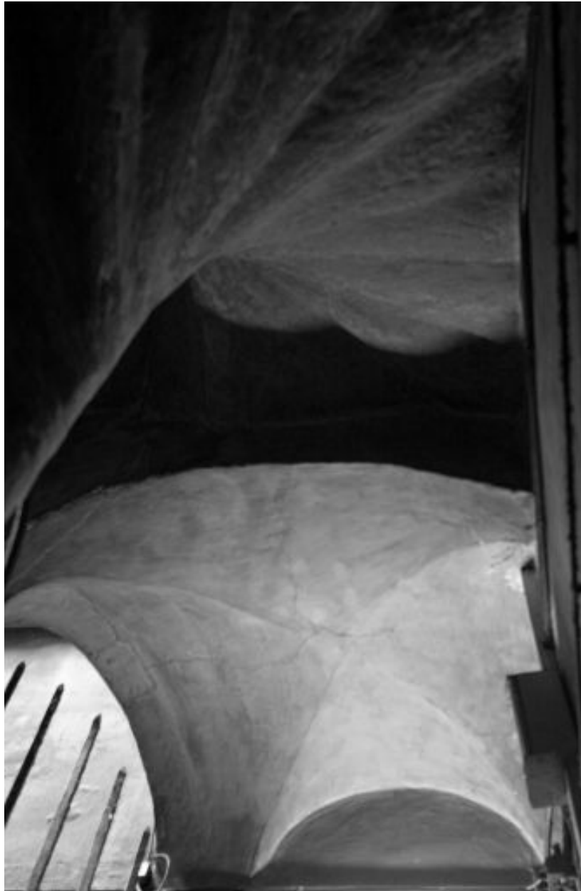
Escalier et voûte d'arêtes d'un palier, détail