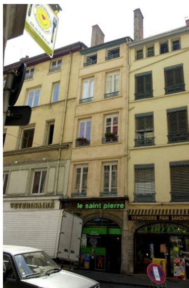
Façade principale sur la rue de la Platière IVR82_20036901377NUCA