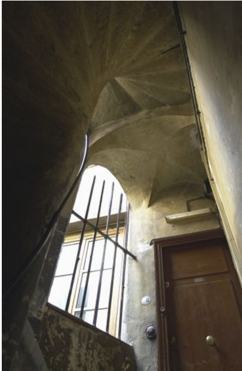
Escalier et voûte d'arêtes d'un palier