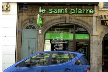
Façade principale sur la rue de la Platière, rez-de-chaussée IVR82_20036901378NUCA