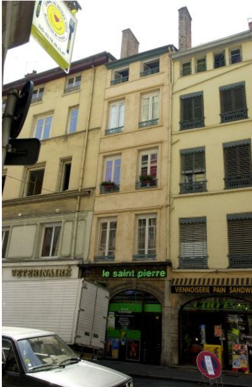
Façade principale sur la rue de la Platière