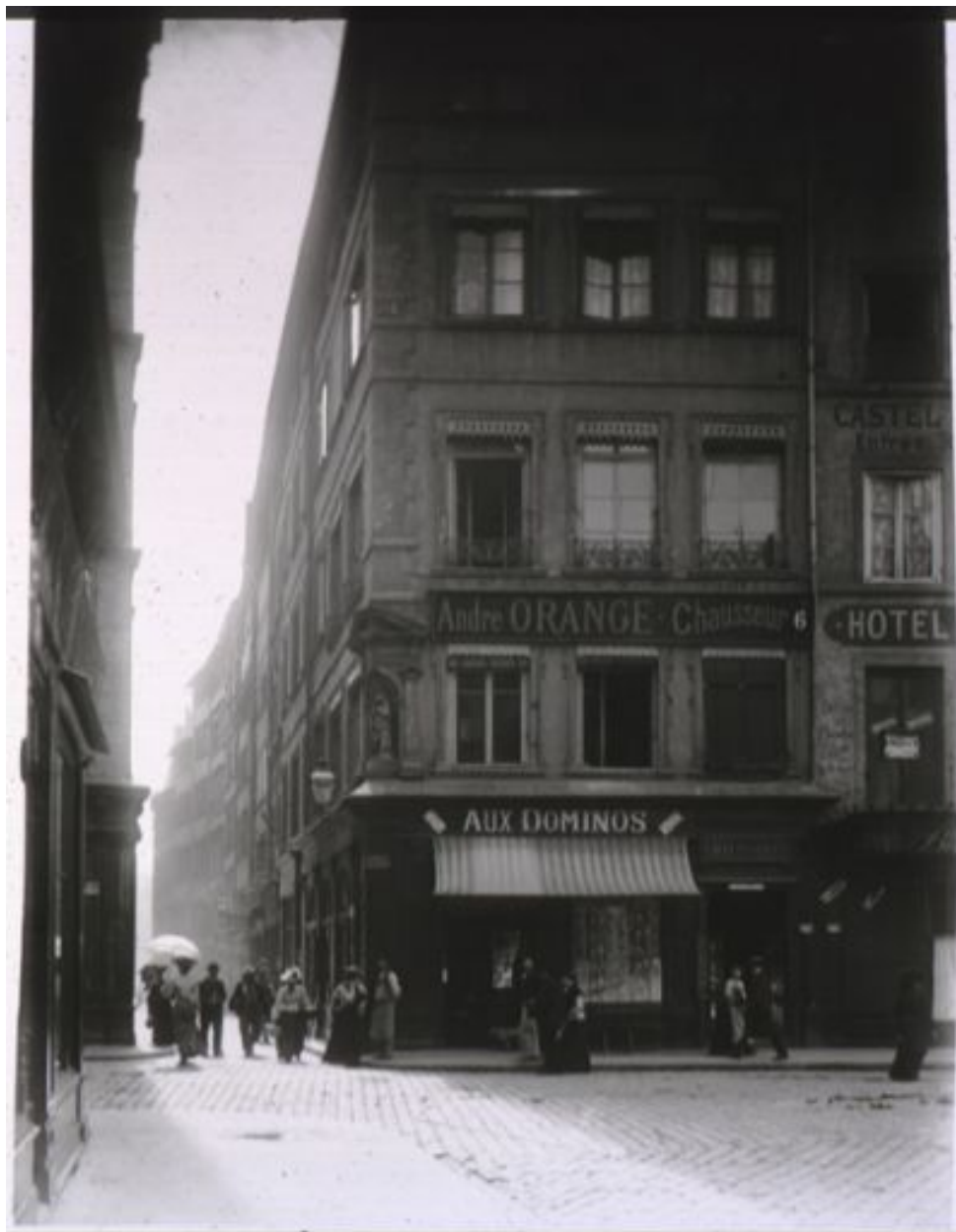
Perspective de la rue Mercière prise place d'Albon, fotogr. par Jules Sylvestre, ca 1900