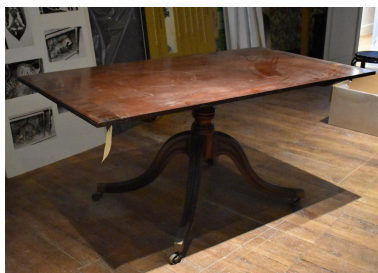
Vue de la seconde allonge. IVR84_20216301411NUC4A