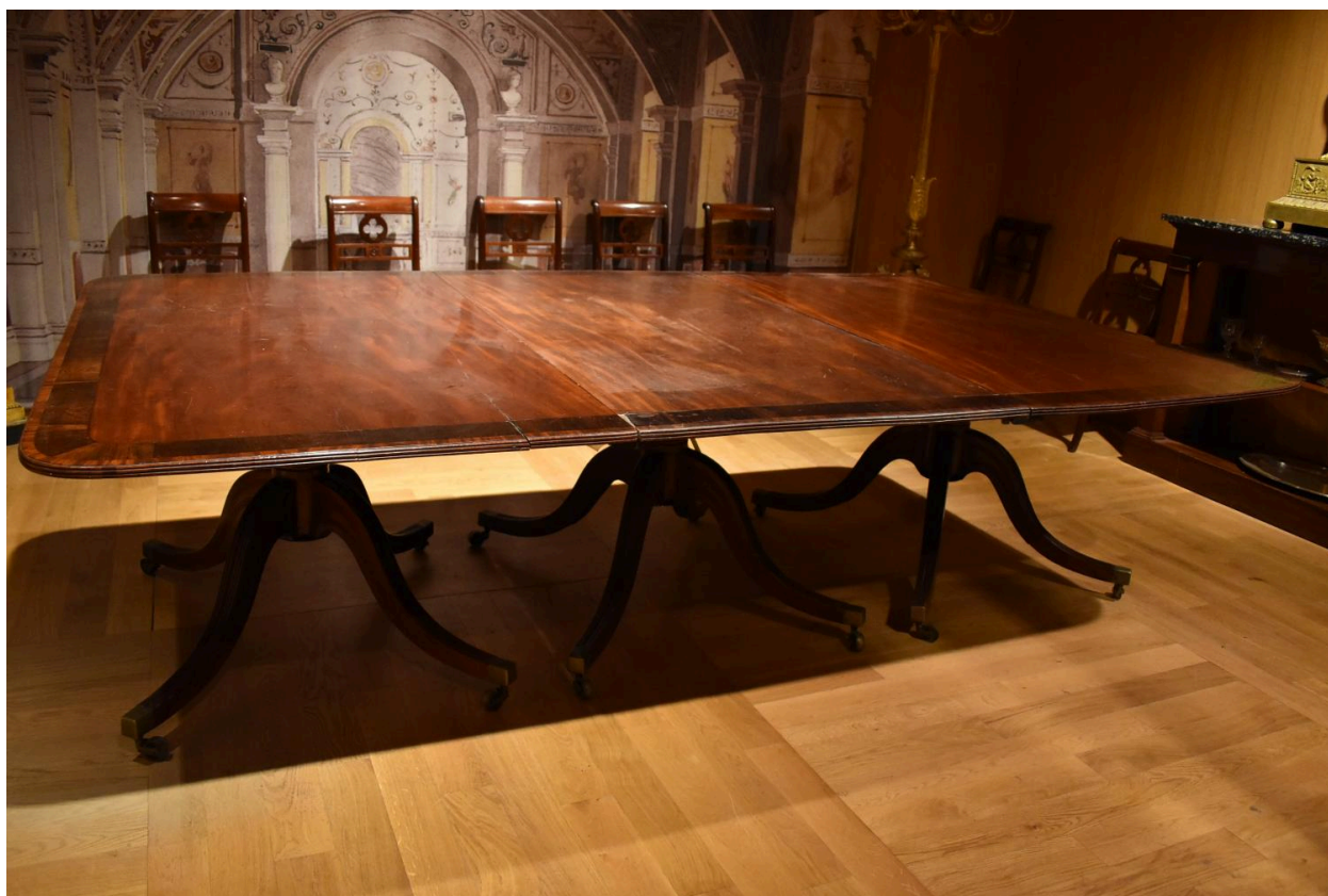
Vue générale de la table et d'une allonge au centre.