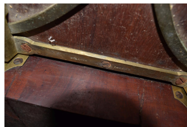
Détail de l'inscription sur le mécanisme IVR84_20216301449NUC4A