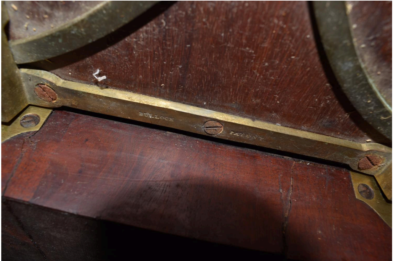
Détail de l'inscription sur le mécanisme