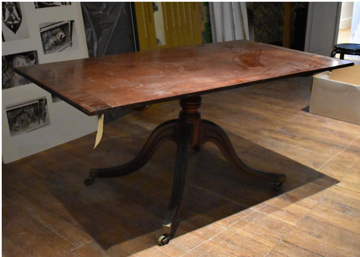
Vue de la seconde allonge.