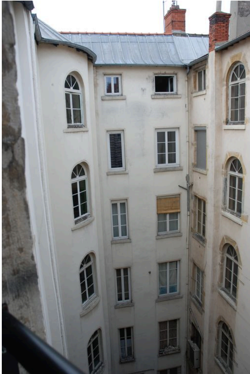
Elévation postérieure, baies cintrées éclairant la cage d'escalier (à droite de l'image)