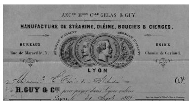
Papier à en-tête de la manufacture de cire H. Guy et Cie (ancienne maison Clle Gelas et Guy), bureaux situés 5 rue de Marseille (Archives de l'archidiocèse de Lyon, I 1208)