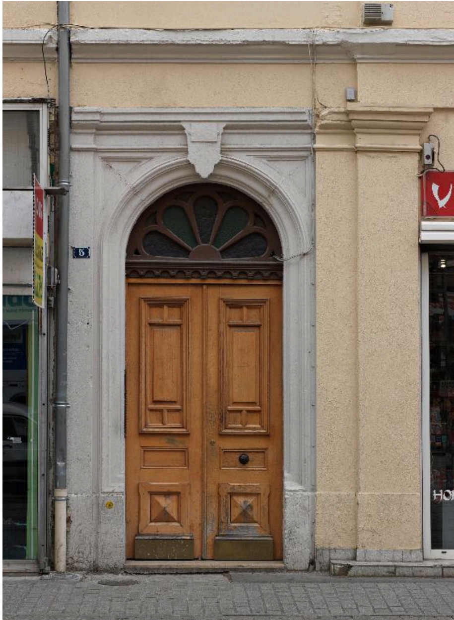
Elévation sur rue de Marseille, vue de la porte d'entrée