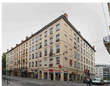
Vue de situation au sein de l'ilot, façades composées en miroir IVR84_20166901454NUCA