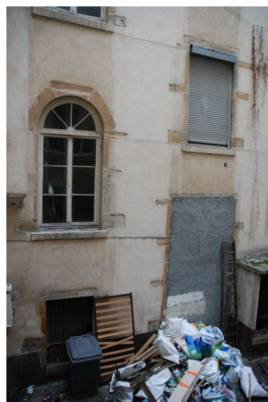
Elévation postérieure : porte murée donnant sur la cour commune IVR82_20136900023NUCA