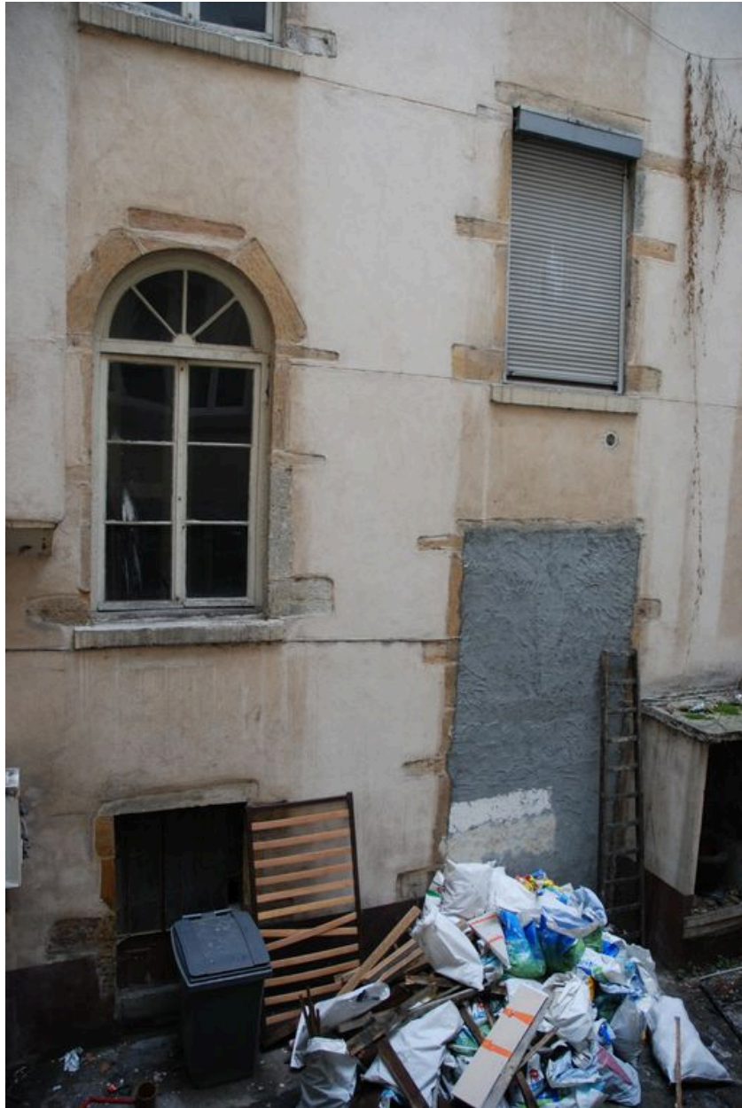
Elévation postérieure : porte murée donnant sur la cour commune