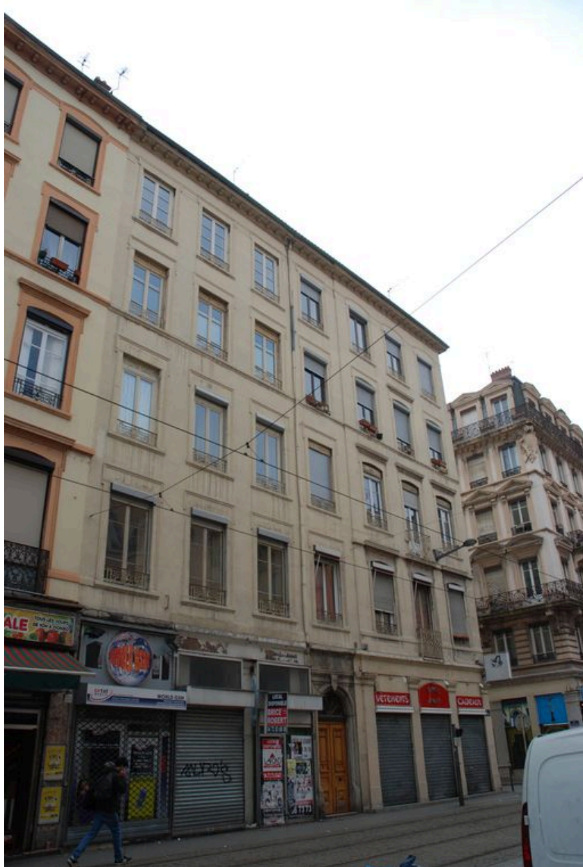
Elévation sur la rue de Marseille