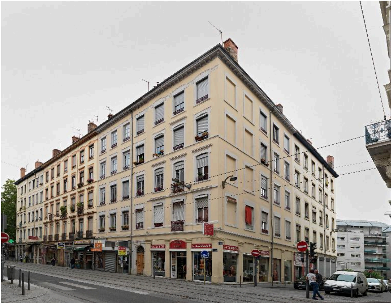
Vue de situation au sein de l'ilot, façades composées en miroir