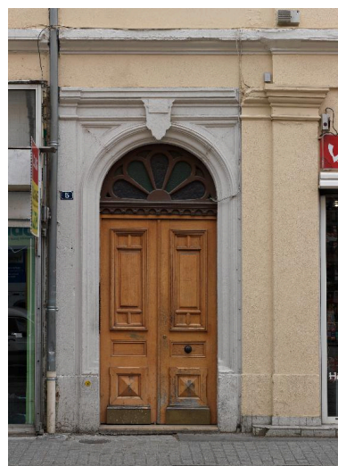
Elévation sur rue de Marseille, vue de la porte d'entrée IVR84_20166901455NUCA