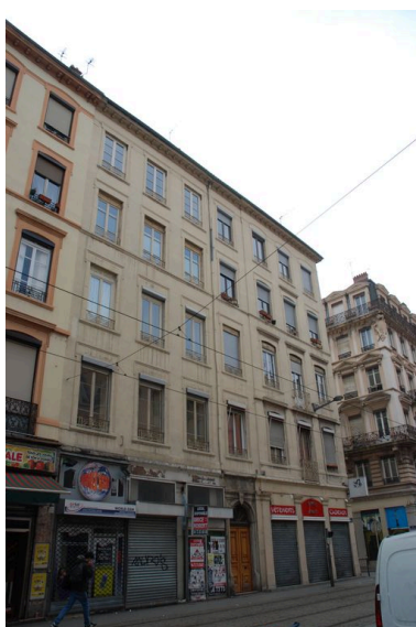
Elévation sur la rue de Marseille IVR82_20136900059NUCA