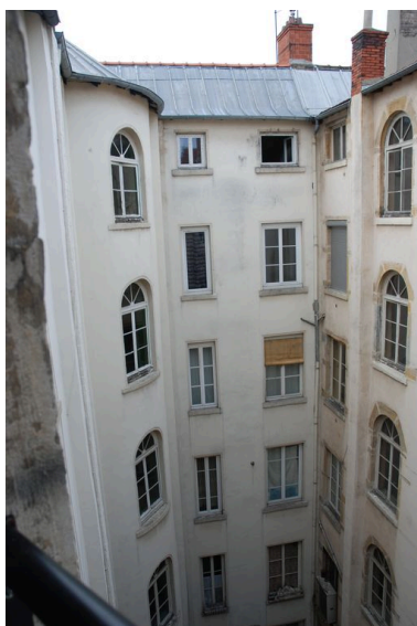
Elévation postérieure, baies cintrées éclairant la cage d'escalier (à droite de l'image)