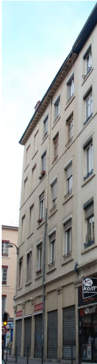
Elévation sur la rue d'Aguesseau