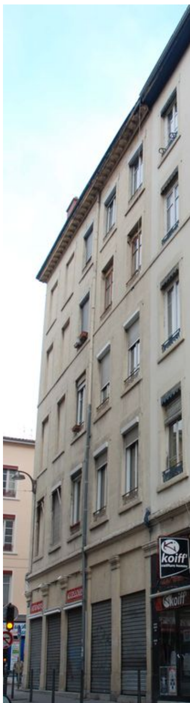
Elévation sur la rue d'Aguesseau IVR82_20136900026NUCA