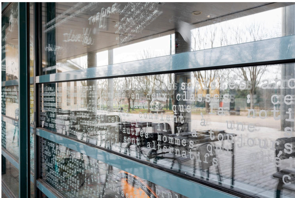
Vue des textes sur les vitres.