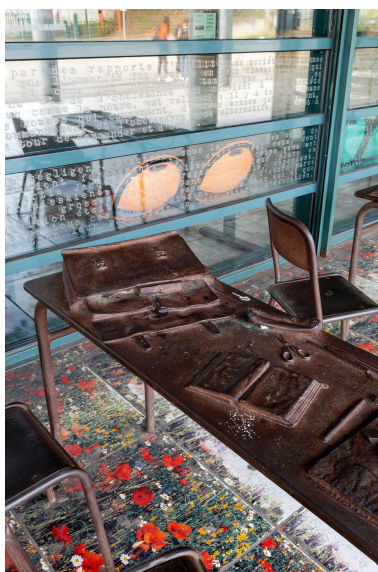
Une table d'écolier IVR84_20216900346NUCA