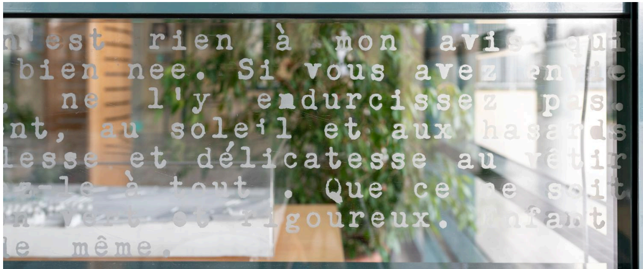
Vue rapprochée du texte sur une vitre.