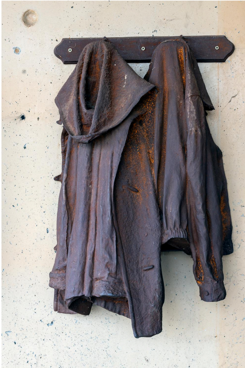
Vue rapprochée d'un porte-manteaux.