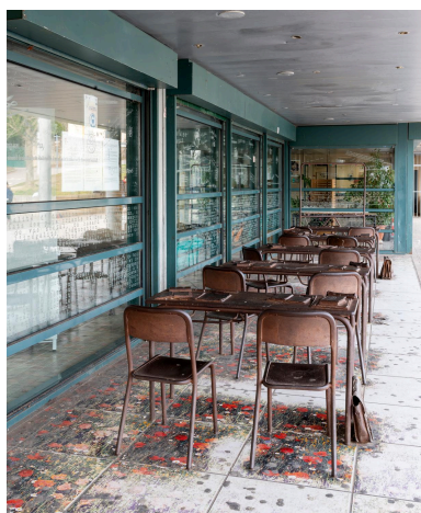
Vue d'ensemble depuis le sud IVR84_20216900345NUCA