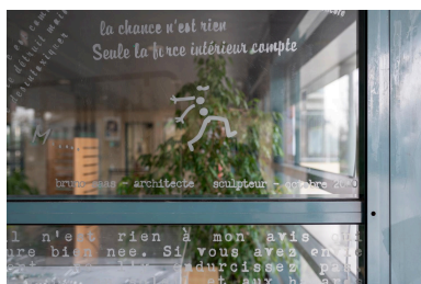
Signature de l'artiste. IVR84_20216900353NUCA