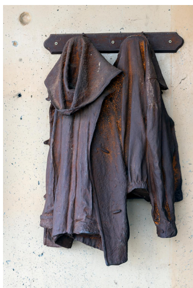
Vue rapprochée d'un porte-manteaux.