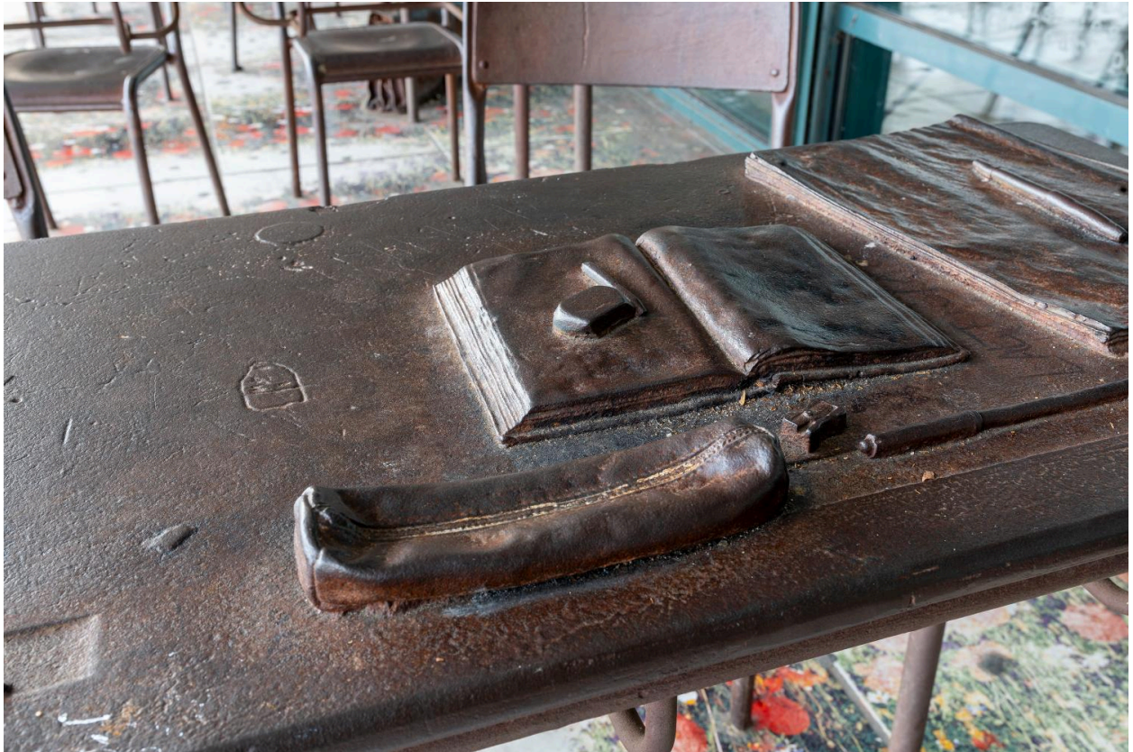
Vue rapprochée d'une table d'écolier