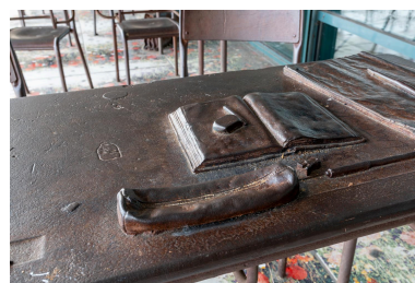
Vue rapprochée d'une table d'écolier IVR84_20216900349NUCA