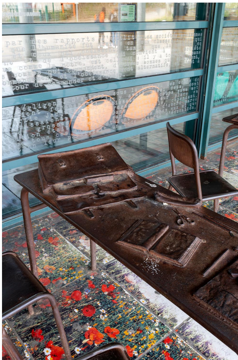
Une table d'écolier