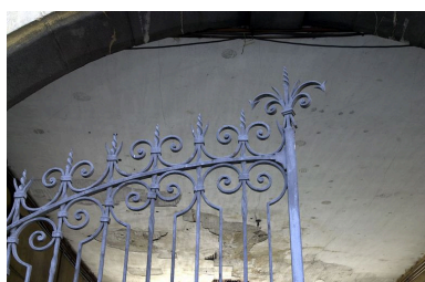
Grille fermant le passage cocher : partie supérieure