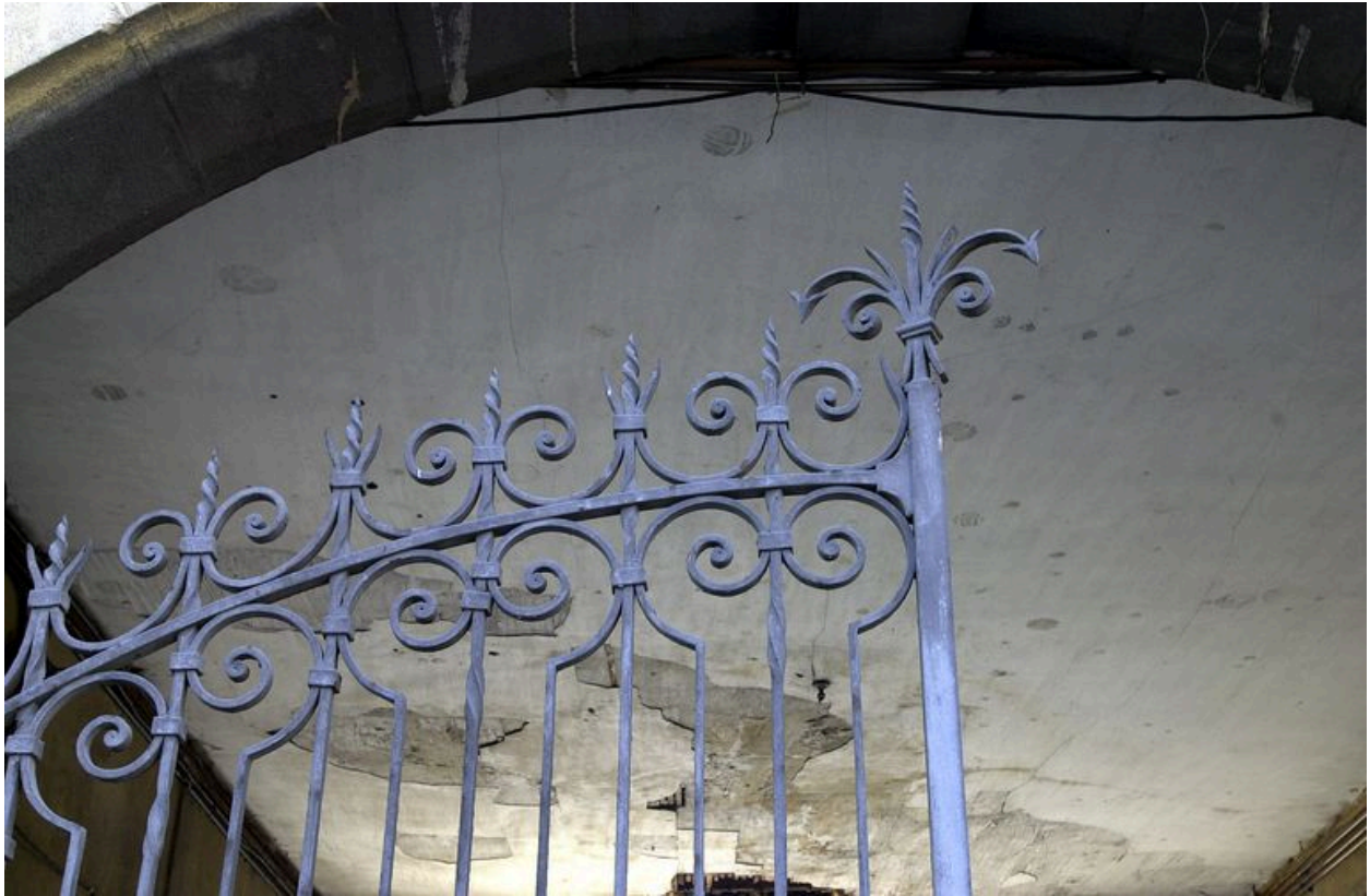
Grille fermant le passage cocher : partie supérieure