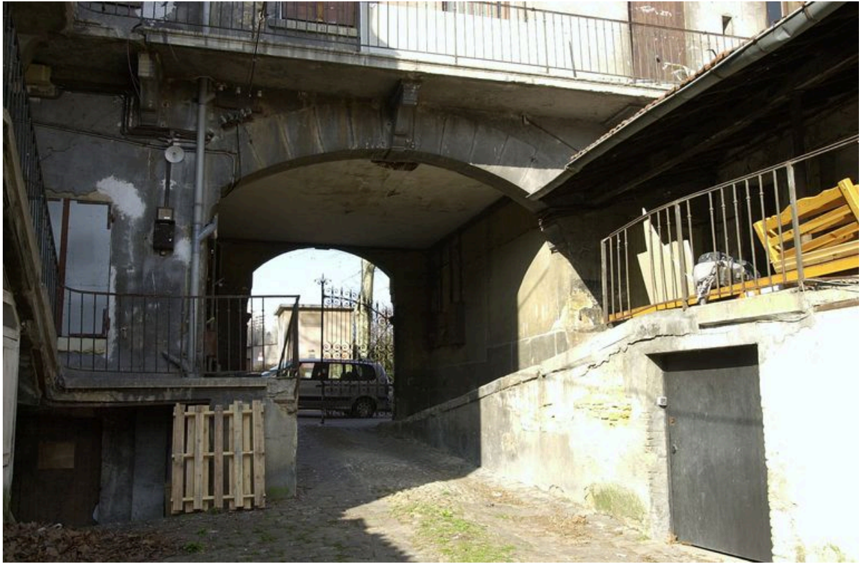
Le passage cocher et la rampe depuis la cour