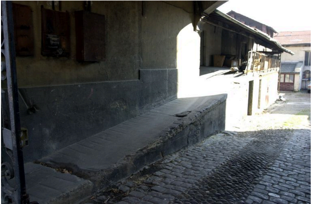
Passage cocher et rampe