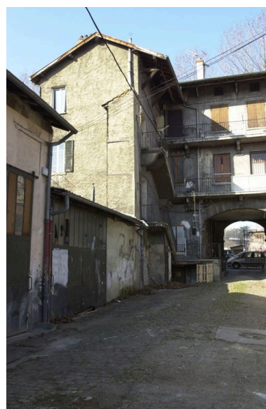
Partie sud de la cour