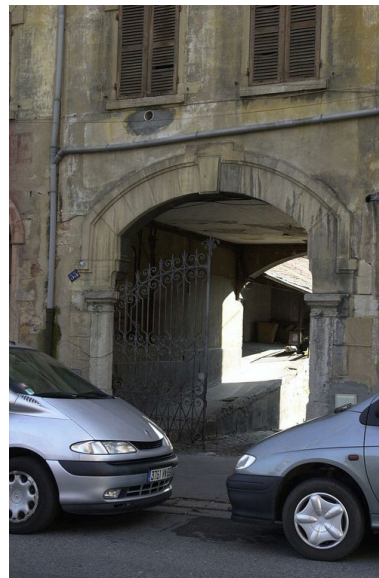
Détail du porche IVR82_20036903194NUCA