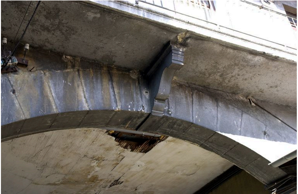
Agrafe ornant le passage cocher