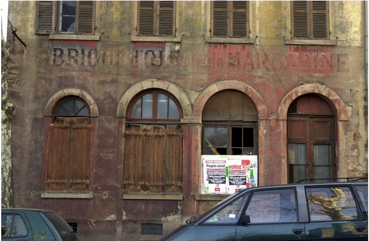
Détail de l'élévation antérieure avec l'inscription