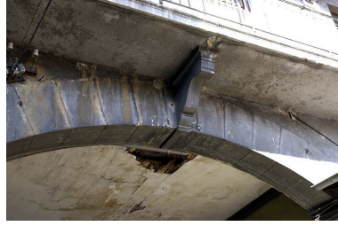
Agrafe ornant le passage cocher IVR82_20036903202NUCA