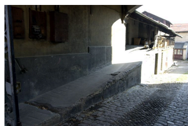
Passage cocher et rampe IVR82_20036903197NUCA