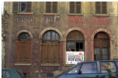
Détail de l'élévation antérieure avec l'inscription IVR82_20036903193NUCA