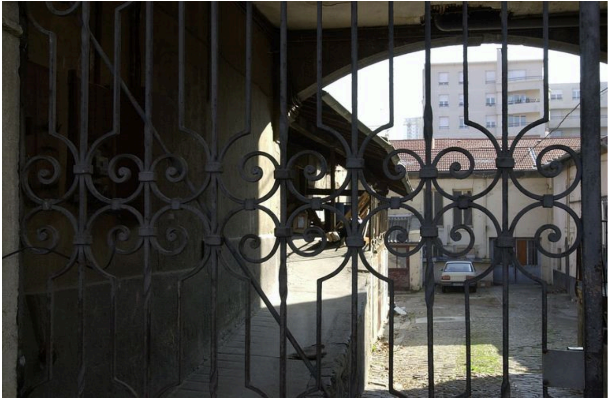
Grille fermant le passage cocher : partie médiane