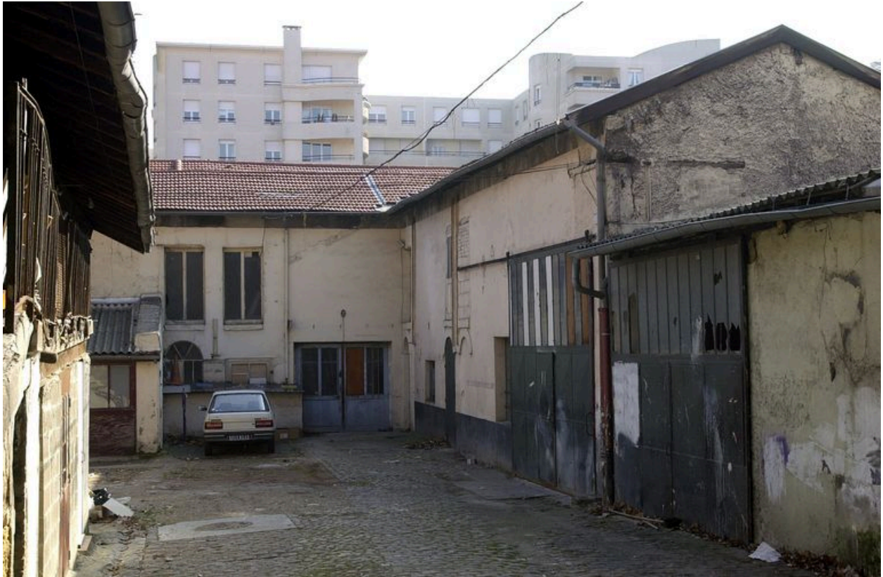
Dépendances situées en fond de cour