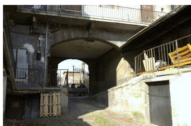
Le passage cocher et la rampe depuis la cour IVR82_20036903198NUCA