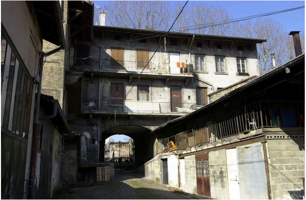
Elévations sur cour