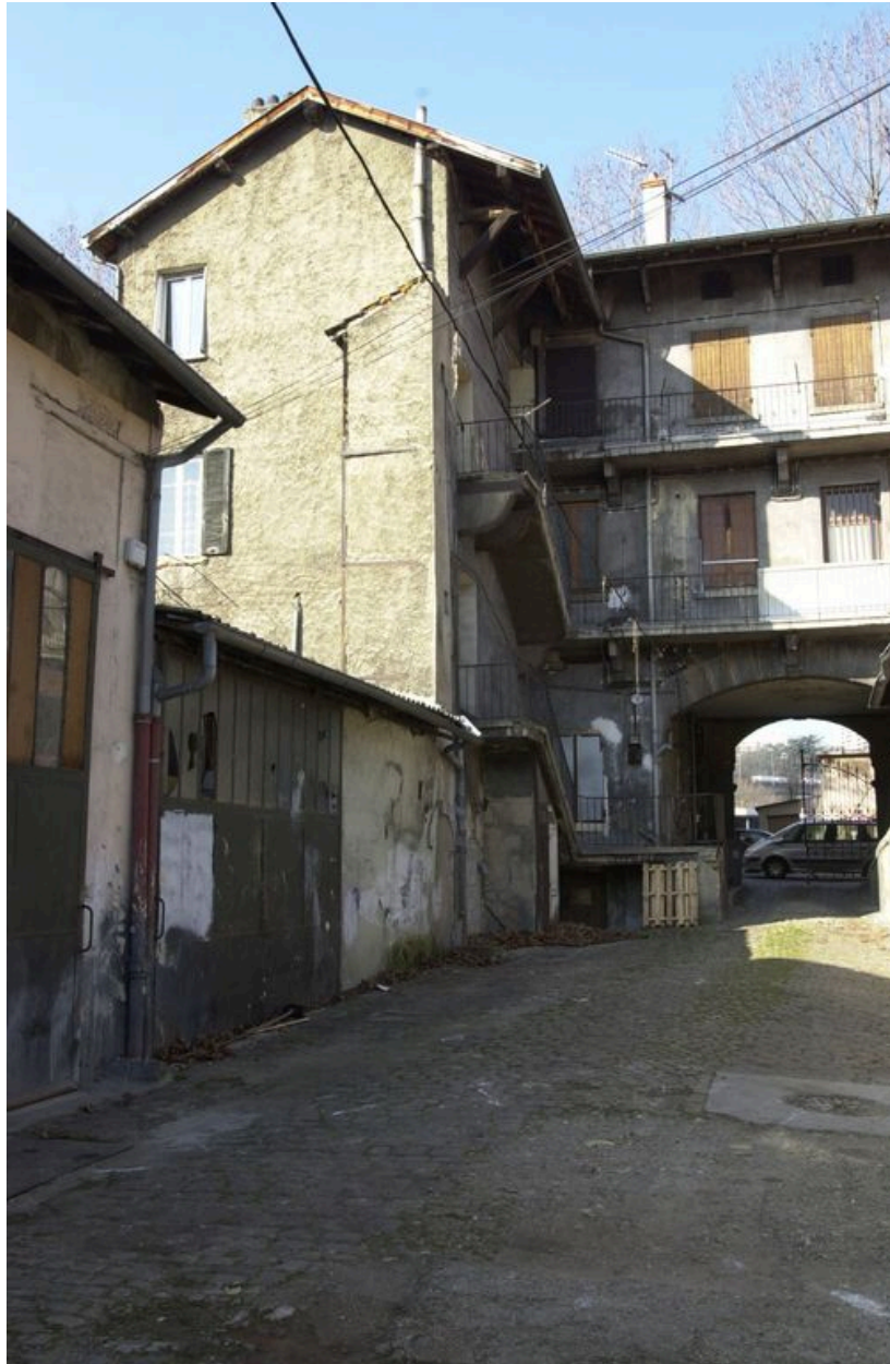
Partie sud de la cour