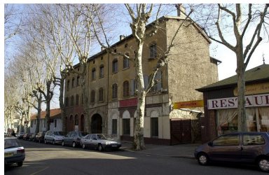
Vue générale IVR82_20036903192NUCA