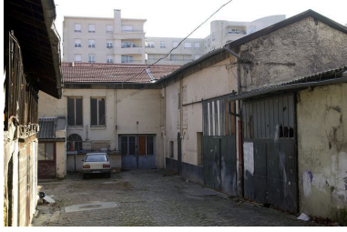
Dépendances situées en fond de cour IVR82_20036903201NUCA