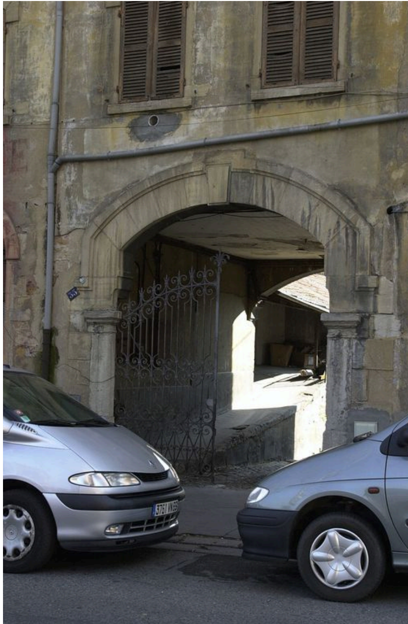
Détail du porche