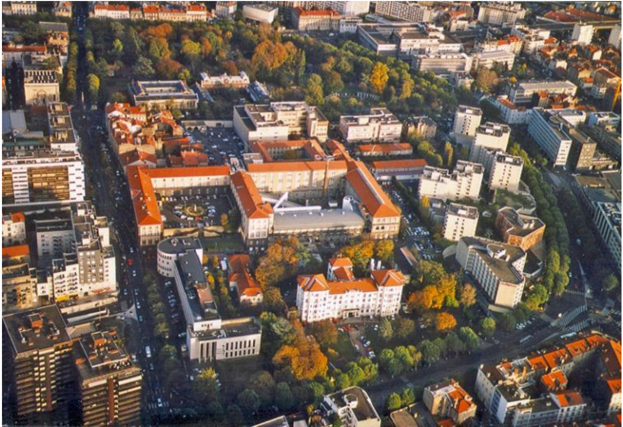
Hôtel-Dieu de Clermont-Ferrand. Le site de l'hôtel-Dieu et ses abords, vers 2000.