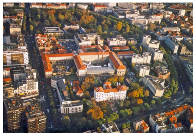
Hôtel-Dieu de Clermont-Ferrand. Le site de l'hôtel-Dieu et ses abords, vers 2000. IVR84_20166300337NUC4A