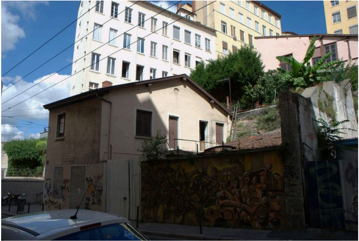
Vue depuis l'est