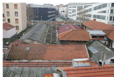
Ilot dit Mazagran 2, vue des ateliers situés en coeur d'îlot, depuis le 4 rue Jangot. IVR82_20136900121NUCA