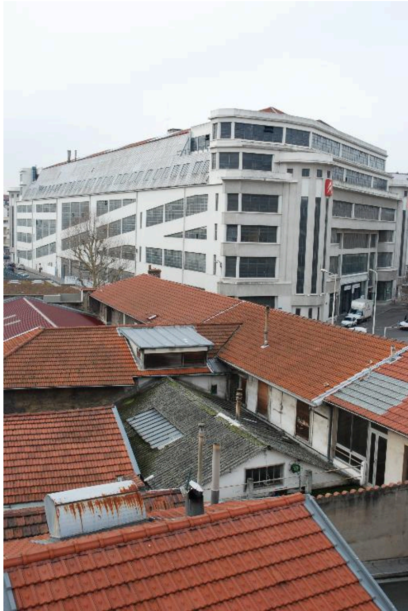
Ilot dit Mazagran 2, vue des ateliers situés en coeur d'îlot, depuis le 4 rue Jangot (avec le garage Citroën à l'arrière-plan).