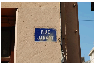
Plaque de la rue Jangot, à l'angle sud-ouest du croisement avec la rue de Marseille.