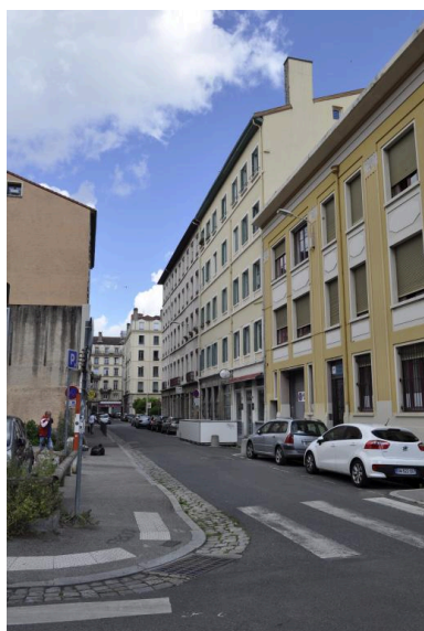
Vue de la rue Jangot depuis l'ouest, au niveau de l'espace Mazagran