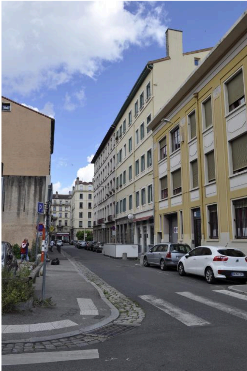
Vue de la rue Jangot depuis l'ouest, au niveau de l'espace Mazagran