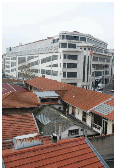
Ilot dit Mazagran 2, vue des ateliers situés en coeur d'îlot, depuis le 4 rue Jangot (avec le garage Citroën à l'arrière-plan).

IVR82_20136900122NUCA