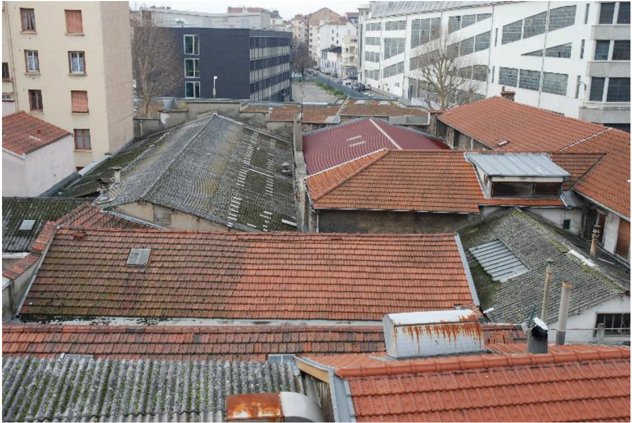
Ilot dit Mazagran 2, vue des ateliers situés en coeur d'îlot, depuis le 4 rue Jangot.