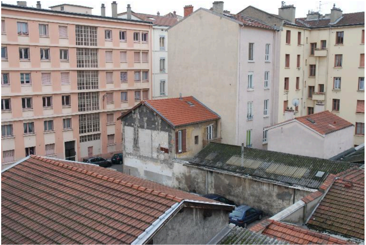
Îlot dit Mazagran 2, vue des ateliers situés en coeur d'îlot, depuis le 4 rue Jangot.