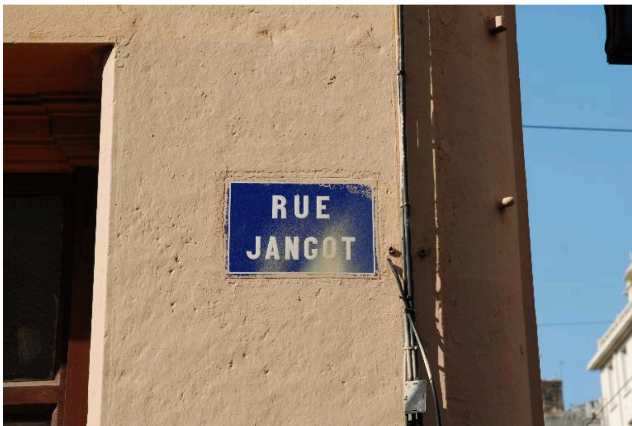
Plaque de la rue Jangot, à l'angle sud-ouest du croisement avec la rue de Marseille.