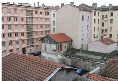
Ilot dit Mazagran 2, vue des ateliers situés en coeur d'îlot, depuis le 4 rue Jangot. IVR82_20136900123NUCA

IVR82_20136900122NUCA