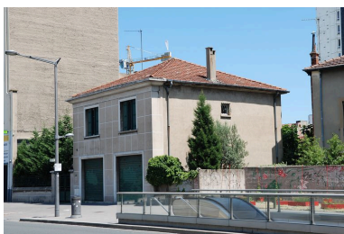
Elévations ouest et sud IVR82_20096903475NUCA