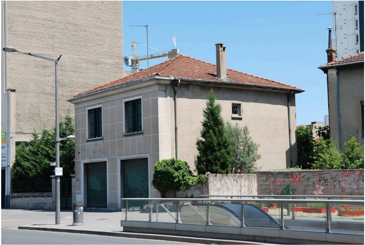
Elévations ouest et sud