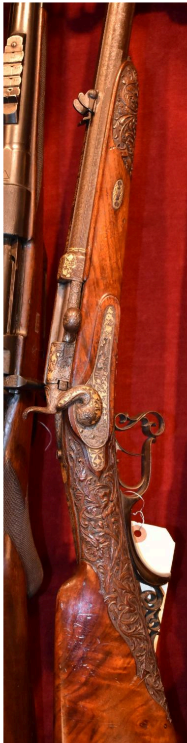
Détail décor