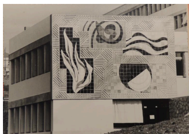
Lycée Aubenas, administration, panneau décoratif, 1965 (AN 20020101/4). Autr. auteur inconnu, IVR84_20200700012NUCB