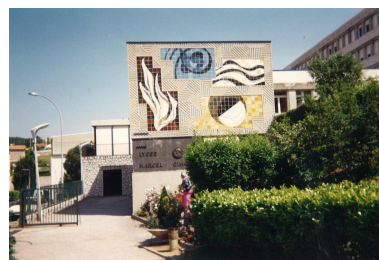
L'oeuvre en 1996