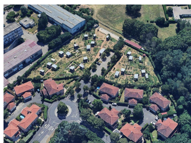
Vue des jardins ouvriers - familiaux du Fort de Bron IVR84_20256901382NUCA