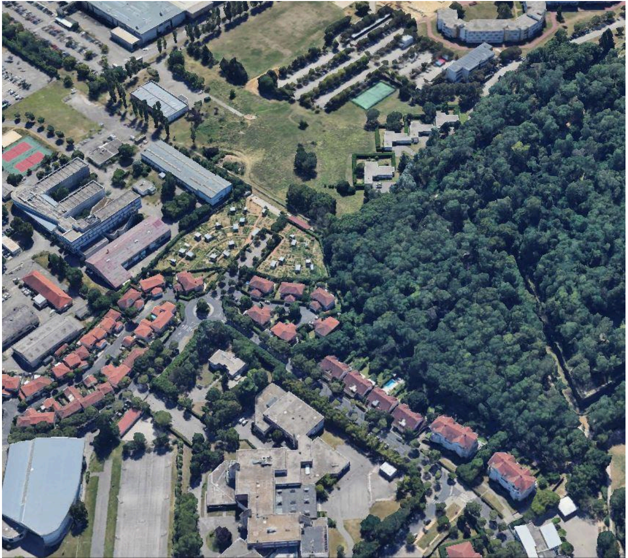
Vue des jardins ouvriers - familiaux du Fort de Bron