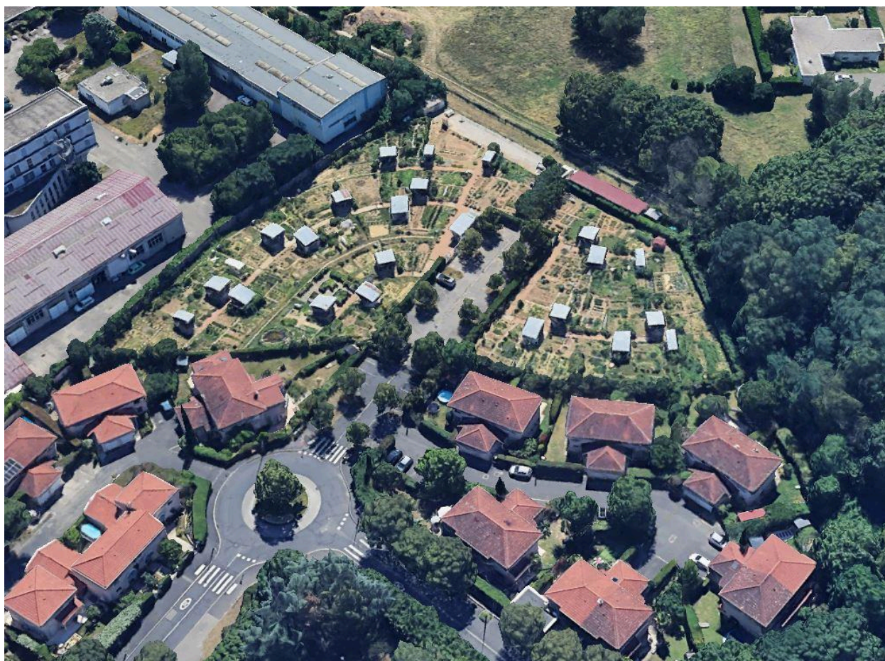
Vue des jardins ouvriers - familiaux du Fort de Bron