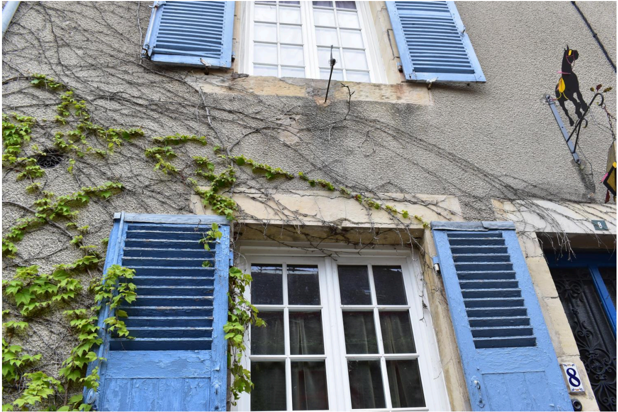
Linteau de fenêtre sur la façade de la rue d'Allier portant gravés, les chiffre (date?) : 17 ... 8[5?].