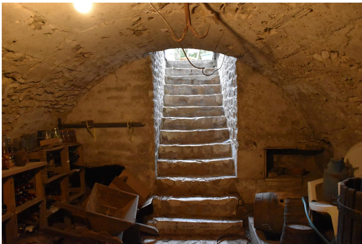
Détail de l'escalier d'accès à la cave.