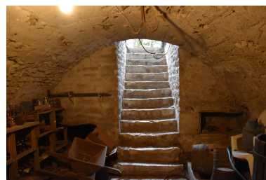
Détail de l'escalier d'accès à la cave.