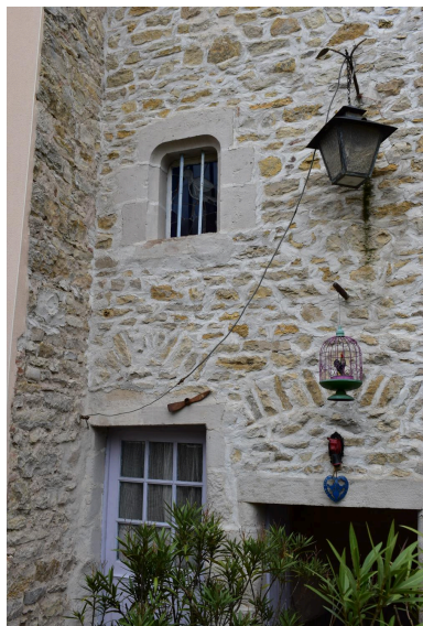
Détail des ouvertures dans le mur gouttereau sud-est.