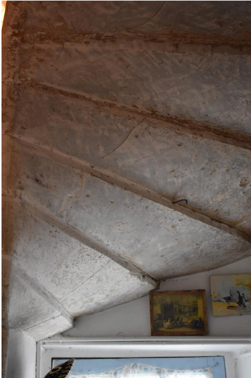
Détail de l'escalier en vis, vue de dessous.