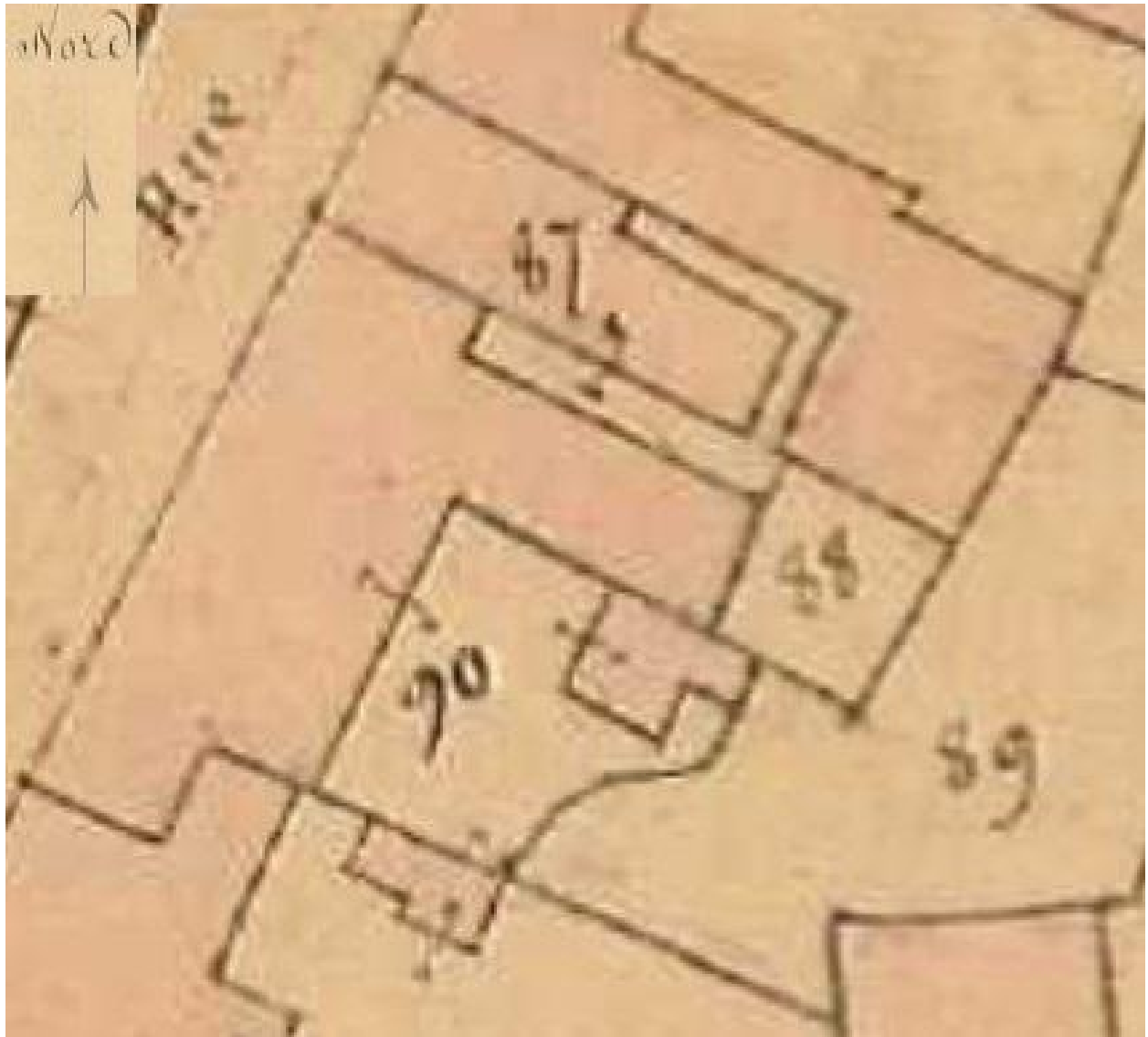
Extrait du plan cadastral dit napoléonien de 1831 : AD03 : 3P 3151, parcelle 90

IVR84_20250300673NUC4A © Archives départementales de l'Allier communication libre, reproduction soumise à autorisation