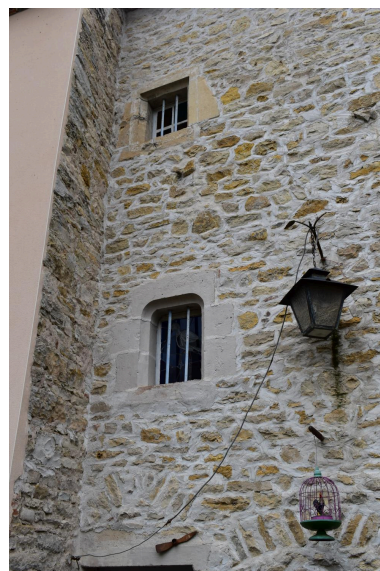
Détail des baies éclairant l'escalier en vis au sud-est. IVR84_20250300558NUCA4A