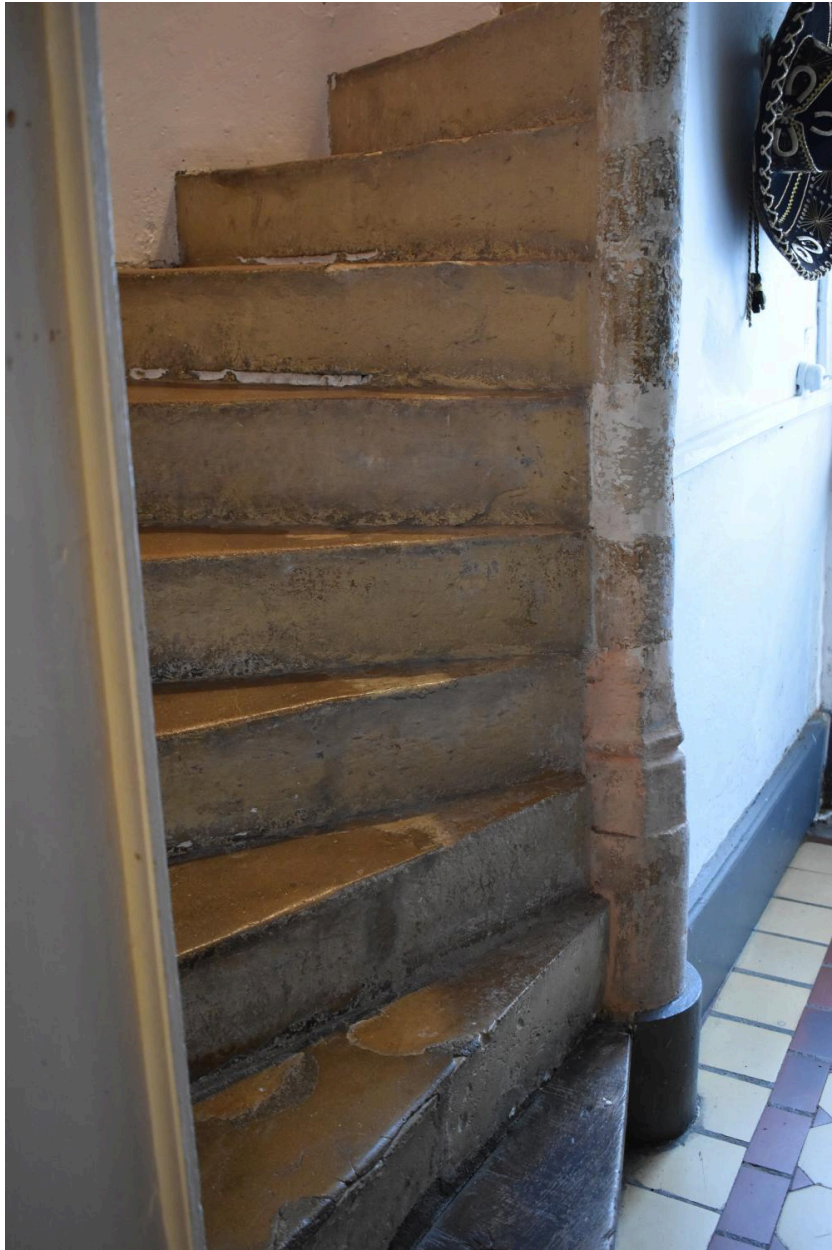
Vue de l'escalier en vis.