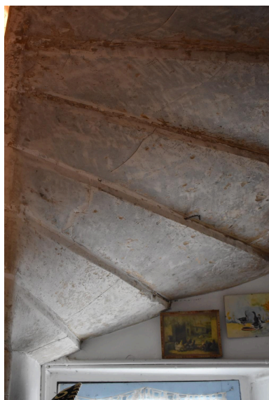
Détail de l'escalier en vis, vue de dessous.