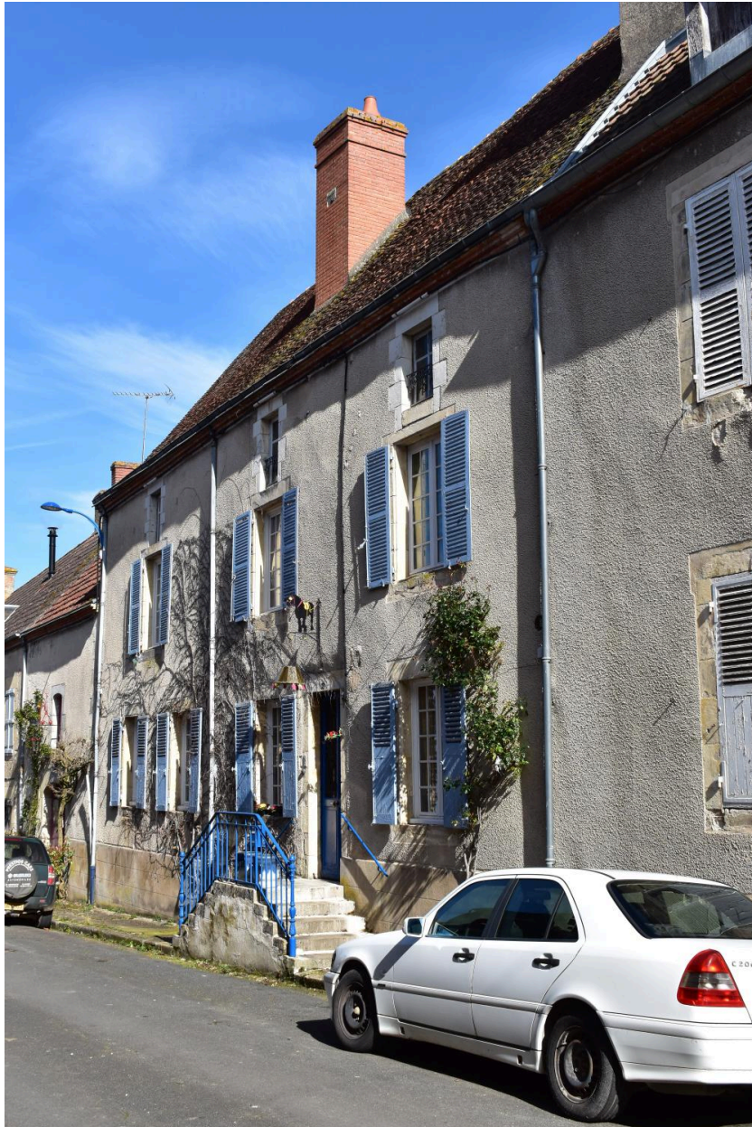
Vue générale de la façade rue d'Allier.