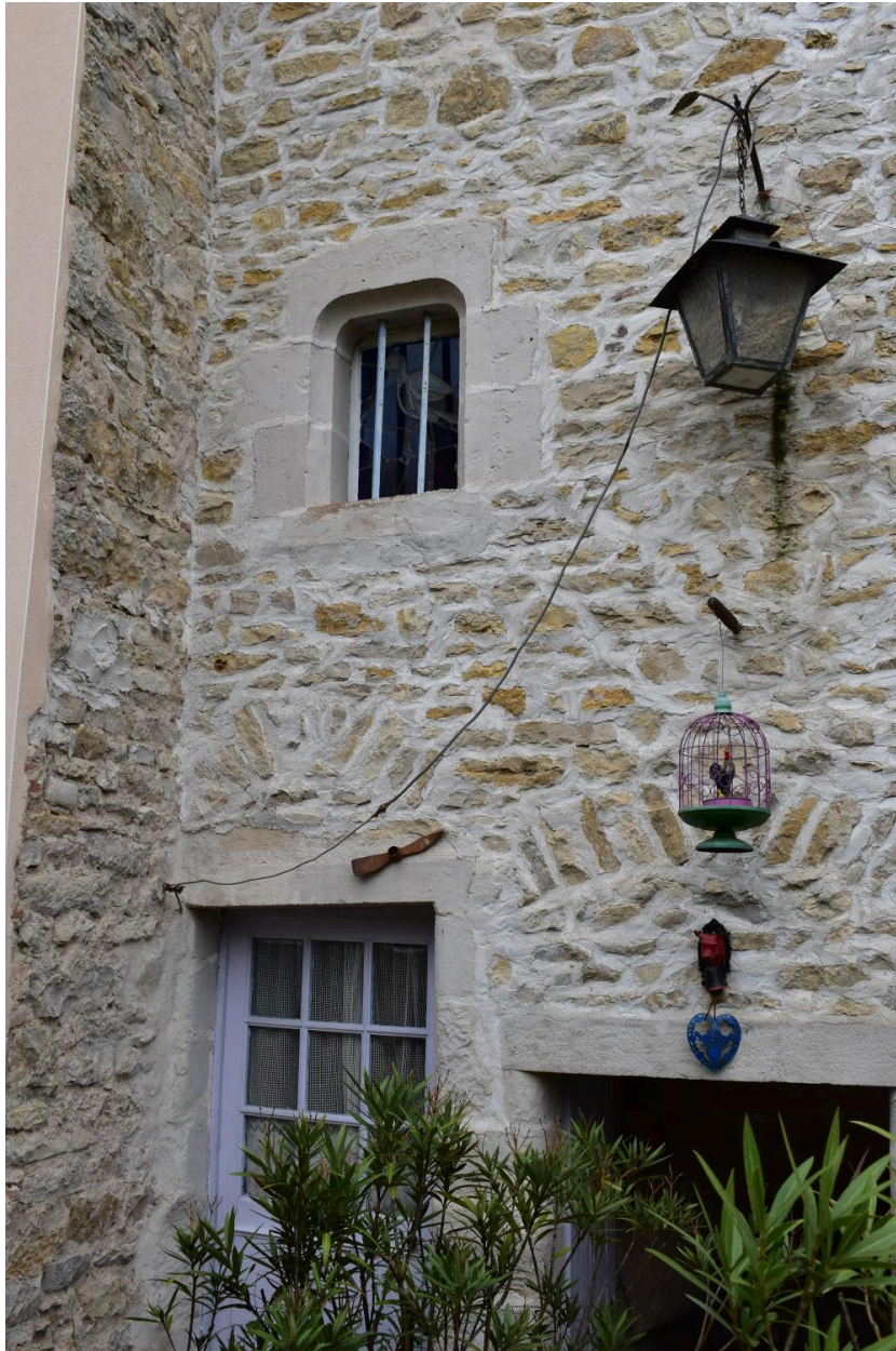
Détail des ouvertures dans le mur gouttereau sud-est.