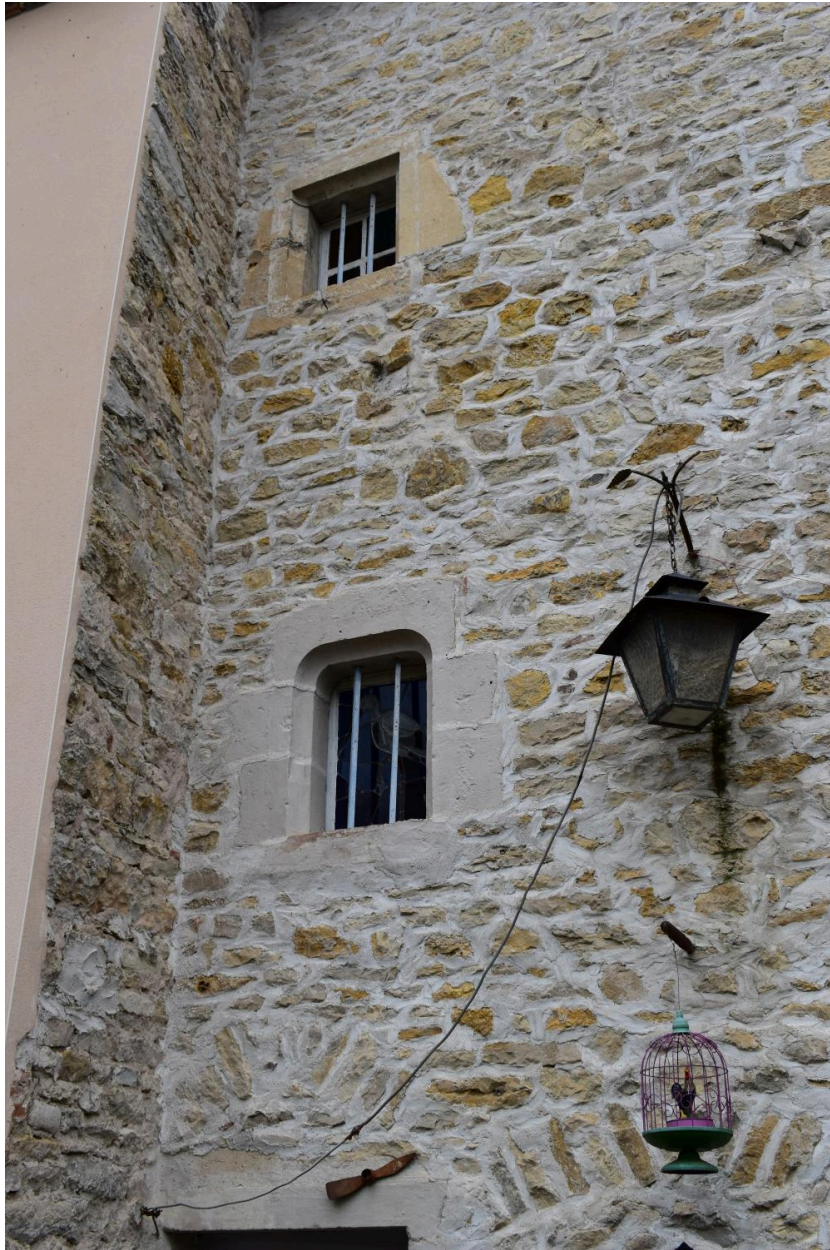
Détail des baies éclairant l'escalier en vis au sud-est.