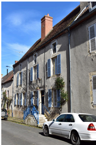
Vue générale de la façade rue d'Allier.