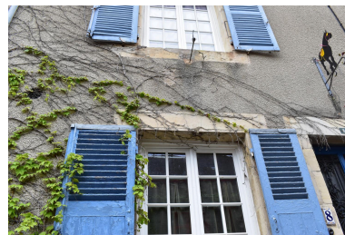
Linteau de fenêtre sur la façade de la rue d'Allier portant gravés, les chiffres (date?) : 17... 8[5?]. IVR84_20250300565NUCA4A