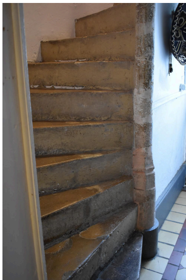
Vue de l'escalier en vis. IVR84_20250300560NUC4A