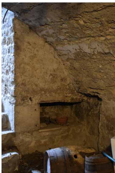
Détail d'une niche dans la cave.