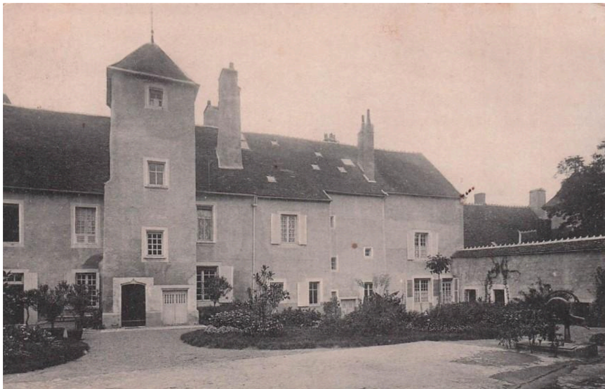
Maison, actuellement 6 et 8 rue d'Allier, vue générale à l'est. Carte postale ancienne, 1er quart 20e siècle.