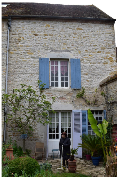
Vue de détail, partie nord, de la façade orientale de la maison. IVR84_20250300557NUCA4A