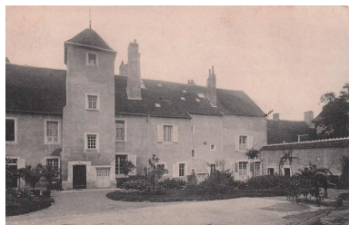
Maison, actuellement 6 et 8 rue d'Allier, vue générale à l'est. Carte postale ancienne, 1er quart 20e siècle. IVR84_20250300544NUCA