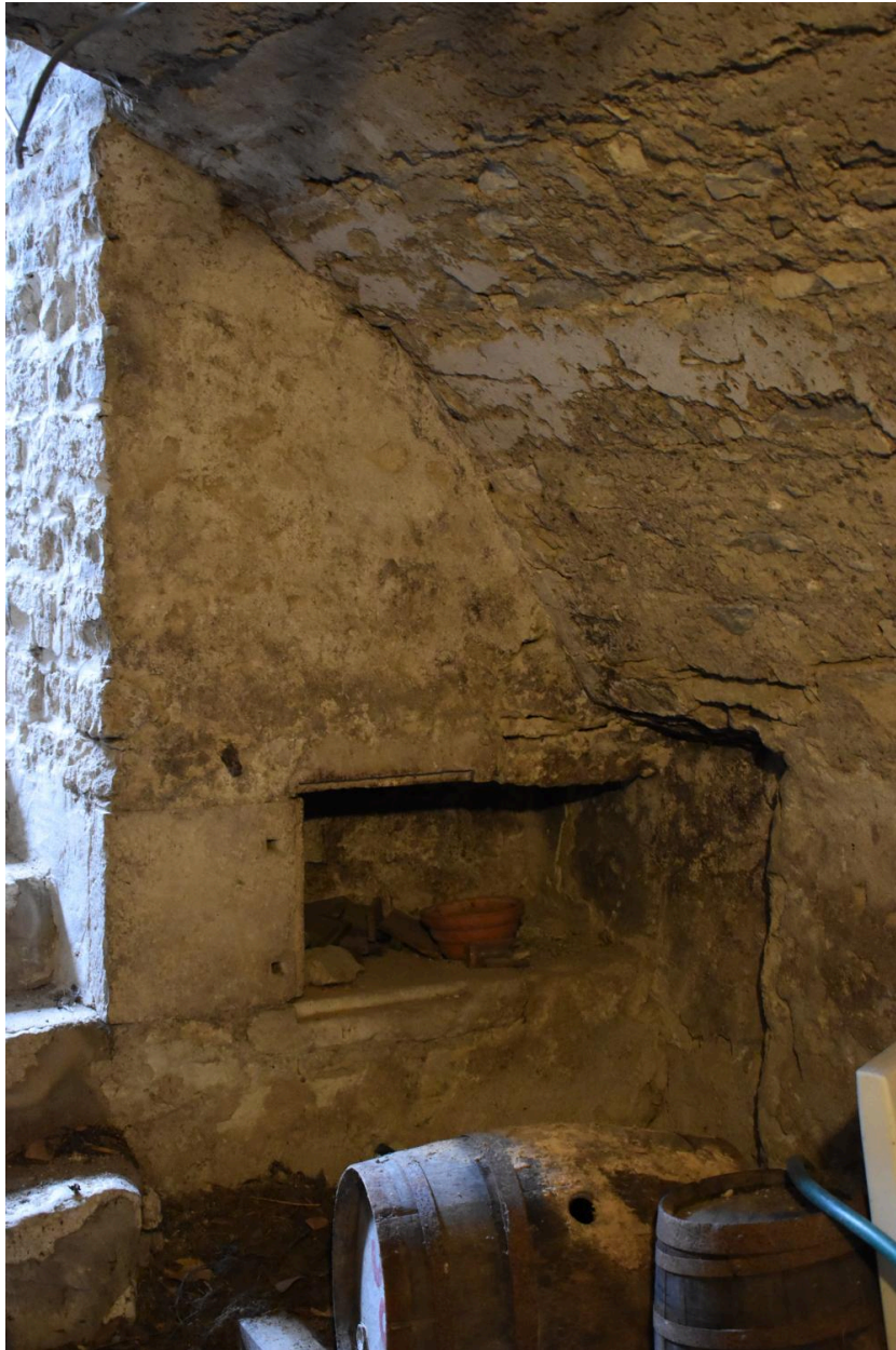
Détail d'une niche dans la cave.