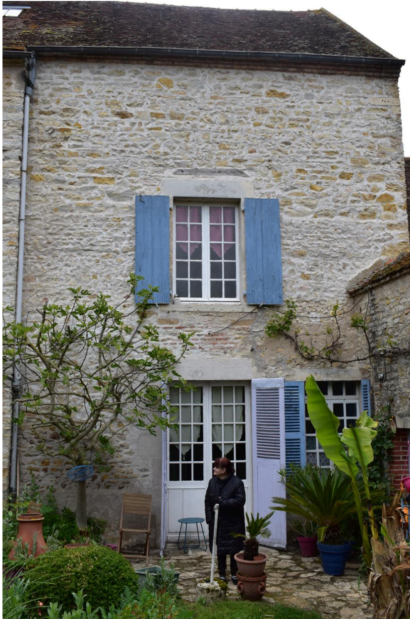
Vue de détail, partie nord, de la façade orientale de la maison.