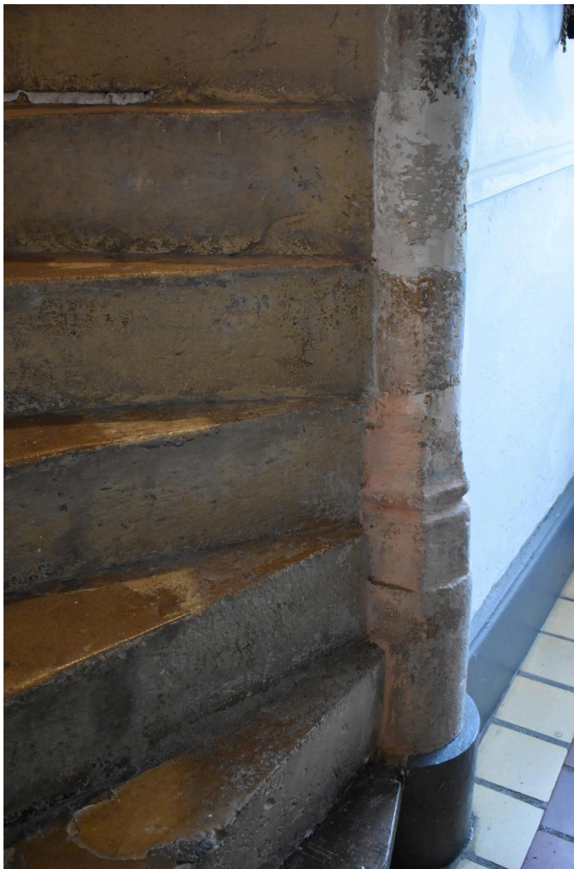
Détail du noyau de l'escalier en vis.