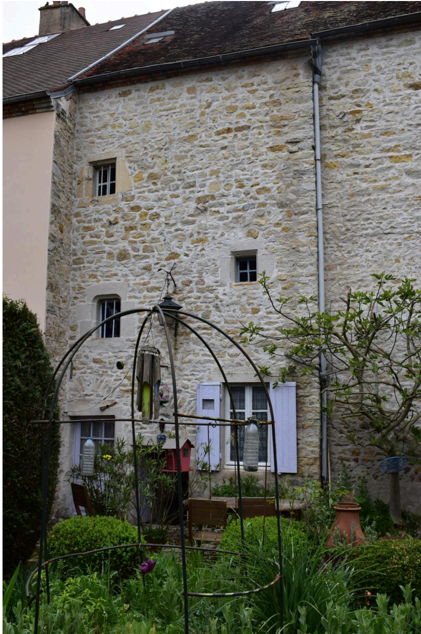
Vue de détail, partie sud, de la façade orientale de la maison.