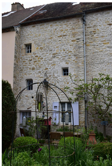
Vue de détail, partie sud, de la façade orientale de la maison. IVR84_20250300556NUCA4A