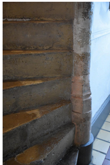
Détail du noyau de l'escalier en vis. IVR84_20250300561NUC4A