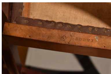
Vue de l'estampille IVR84_20216301418NUC4A