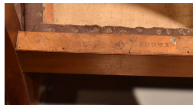
Vue de l'estampille IVR84_20216301417NUC4A