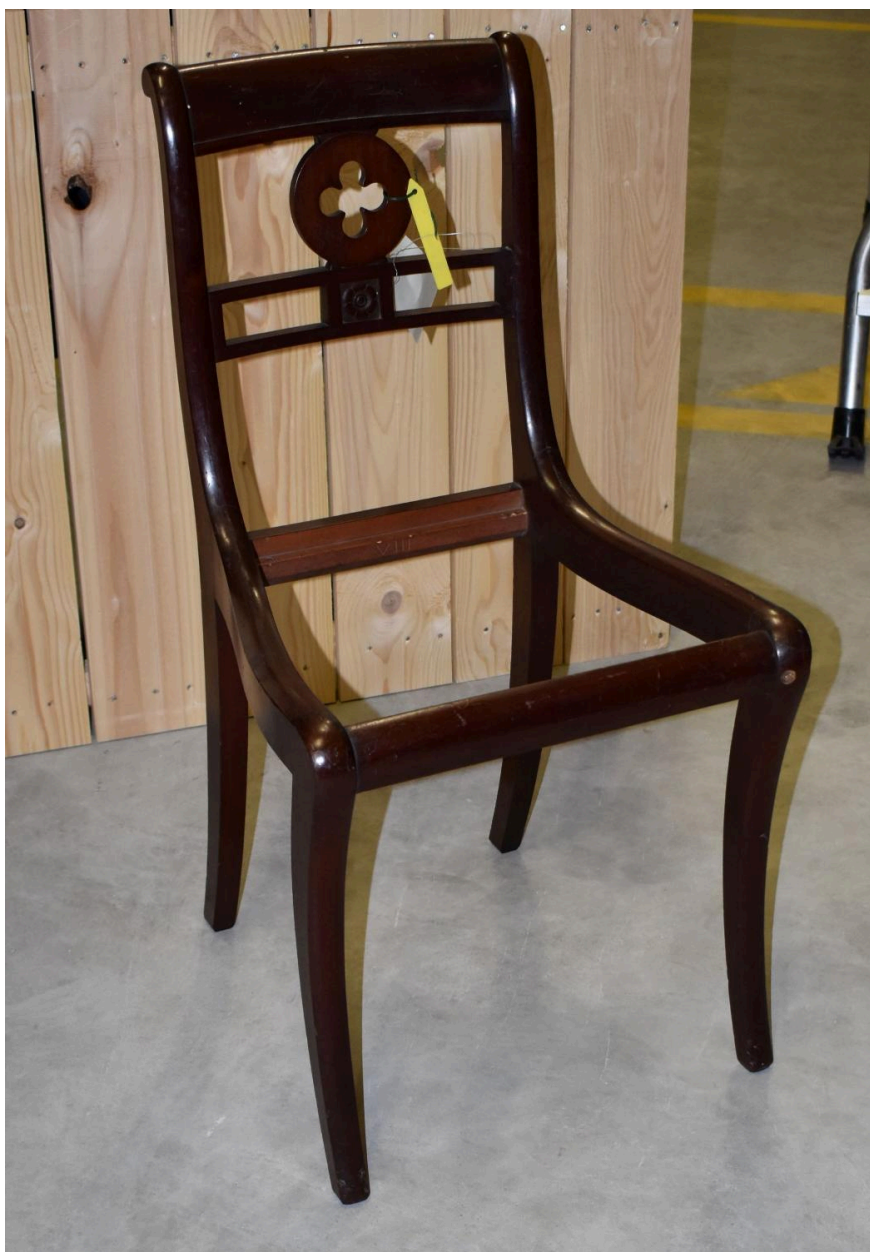
Vue d'une chaise 709 B