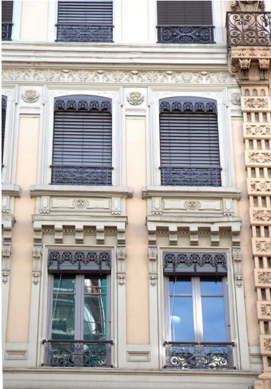
Elévation antérieure, détail des baies des 1er et 2e étages