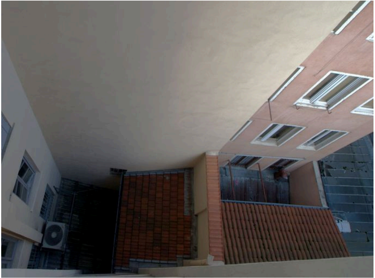
Vue de la cour, depuis le haut