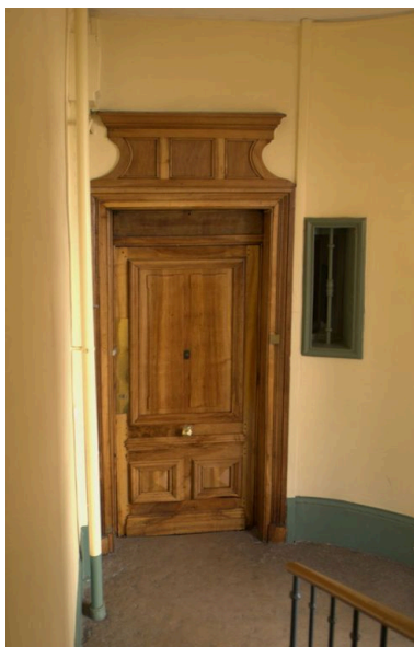
Palier IVR82_20086901531NUCA