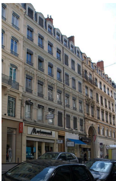
Vue de l'élévation antérieure