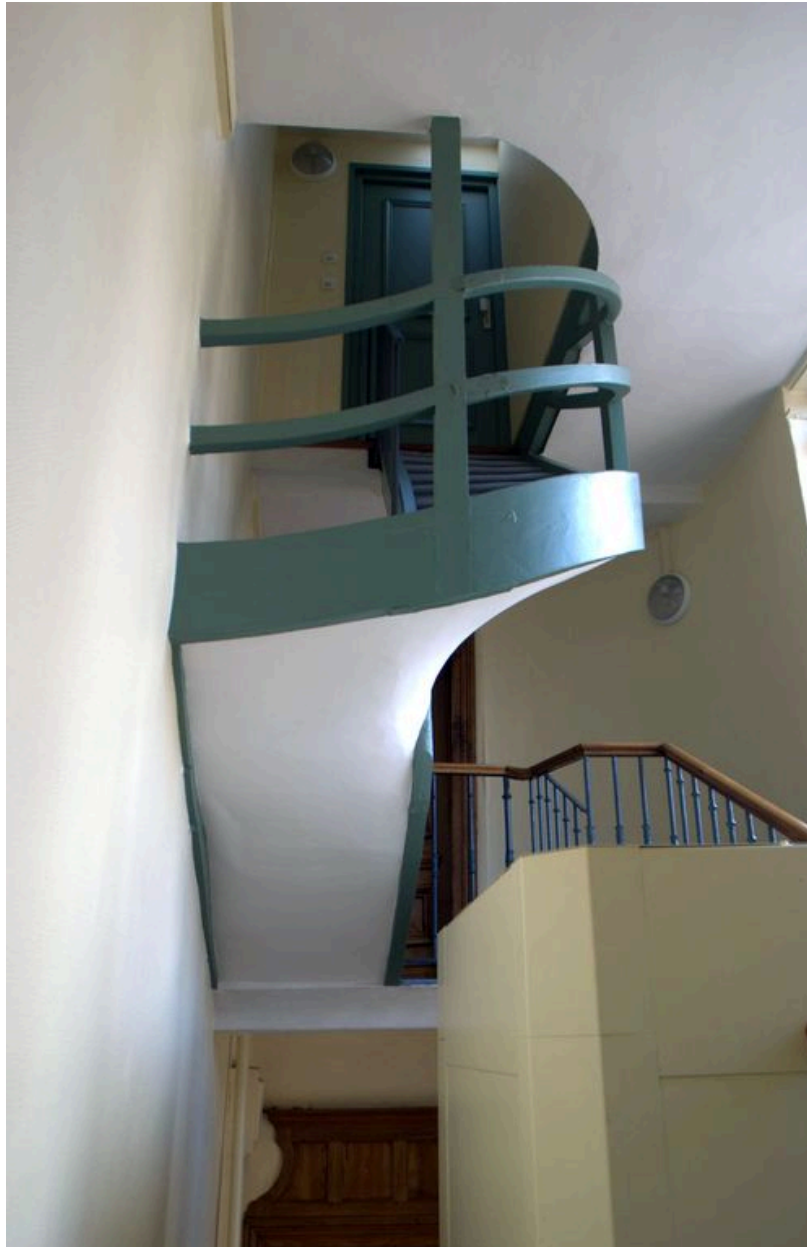
Vue de la dernière volée de l'escalier, en bois