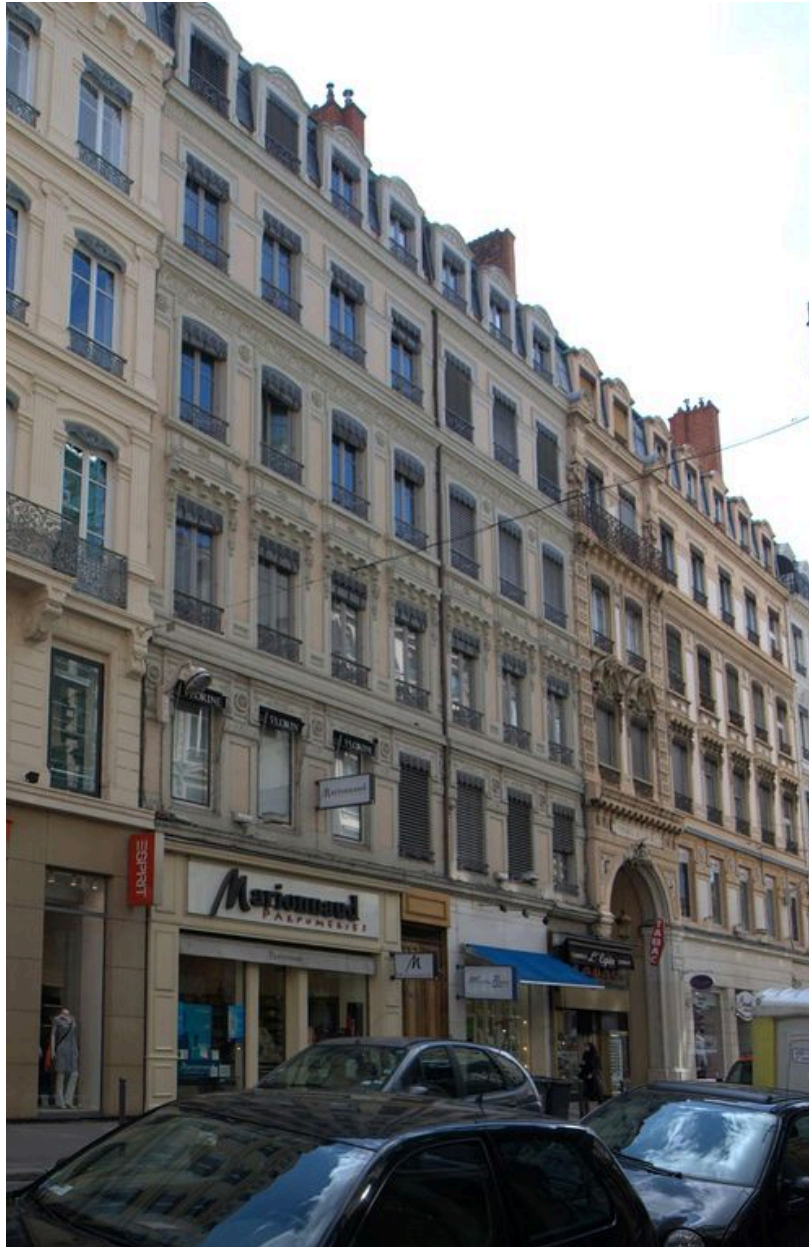
Vue de l'élévation antérieure