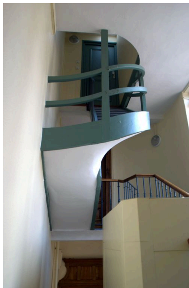
Vue de la dernière volée de l'escalier, en bois