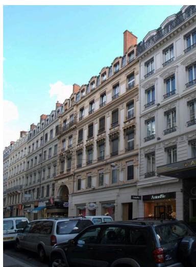
Vue d'ensemble des immeubles 69 et 71 rue du Président- Edouard-Herriot depuis le sud IVR82_20086903018NUCA