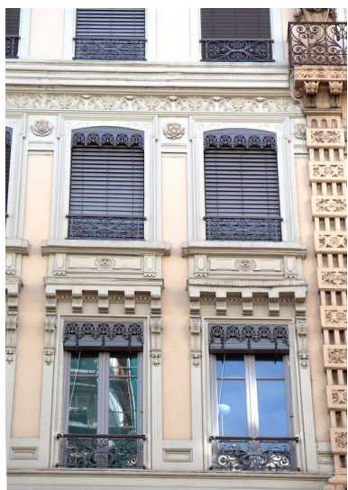
Elévation antérieure, détail des baies des 1er et 2e étages