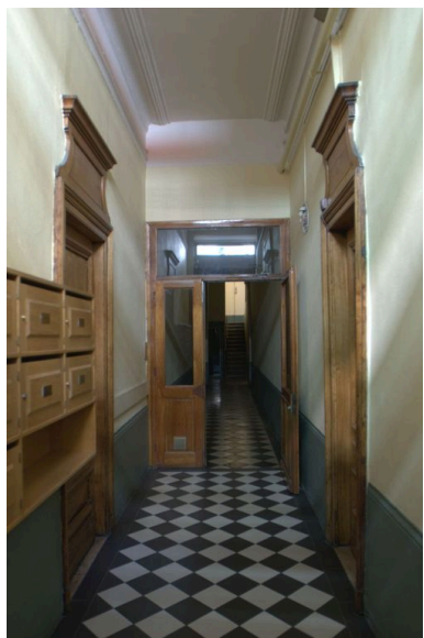
Vue de l'allée depuis l'entrée IVR82_20086901527NUCA