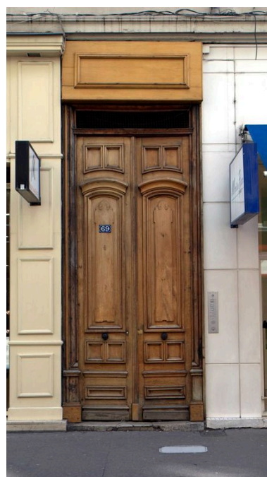
Elévation antérieure, détail de la porte