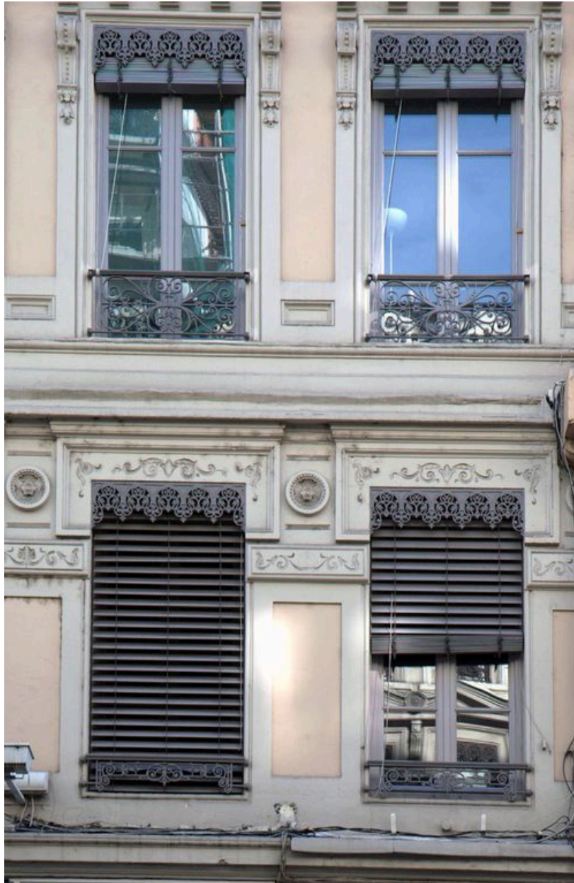
Elévation antérieure, détail des baies de l'entresol et du 1er étage