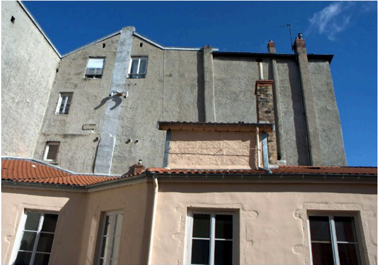
Vue de l'élévation latérale sud