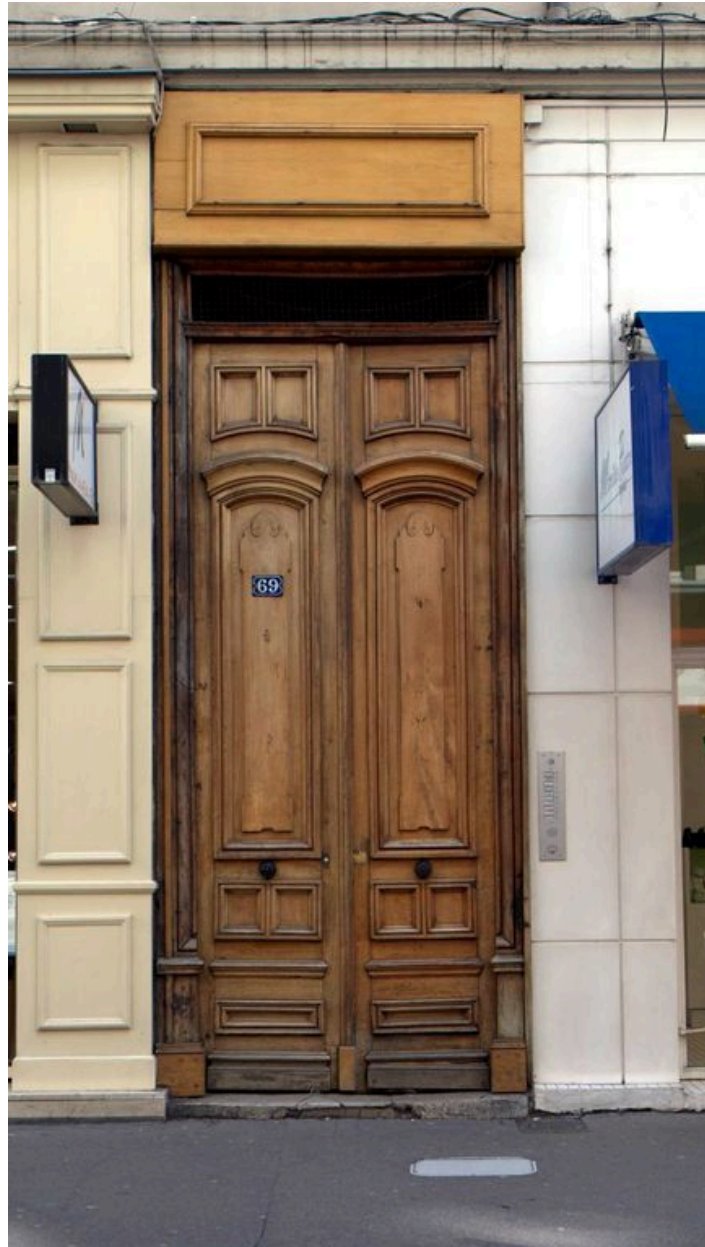
Elévation antérieure, détail de la porte