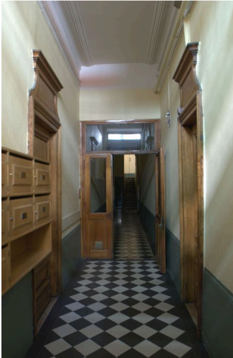
Vue de l'allée depuis l'entrée