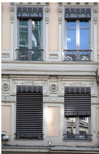
Elévation antérieure, détail des baies de l'entresol et du 1er étage