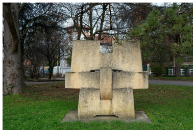
Vue de face. IVR84_20216900225NUCA