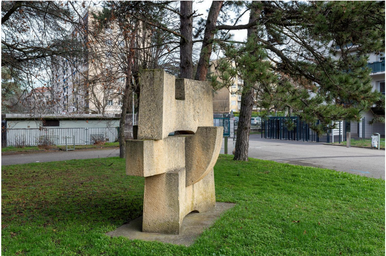
Vue de trois quart.