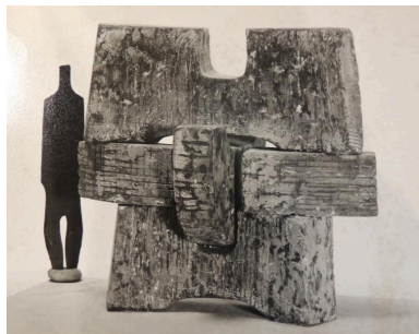
Maquette de l'œuvre (Avoscan, 1975) (AN 20020101/5).

Autr. Ivan Avoscan IVR84_20206900391NUCB