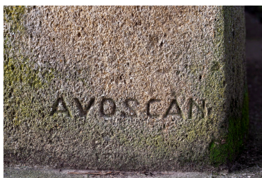
Signature. IVR84_20216900228NUCA