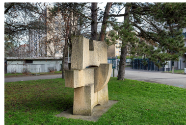
Vue de trois quart. IVR84_20216900226NUCA