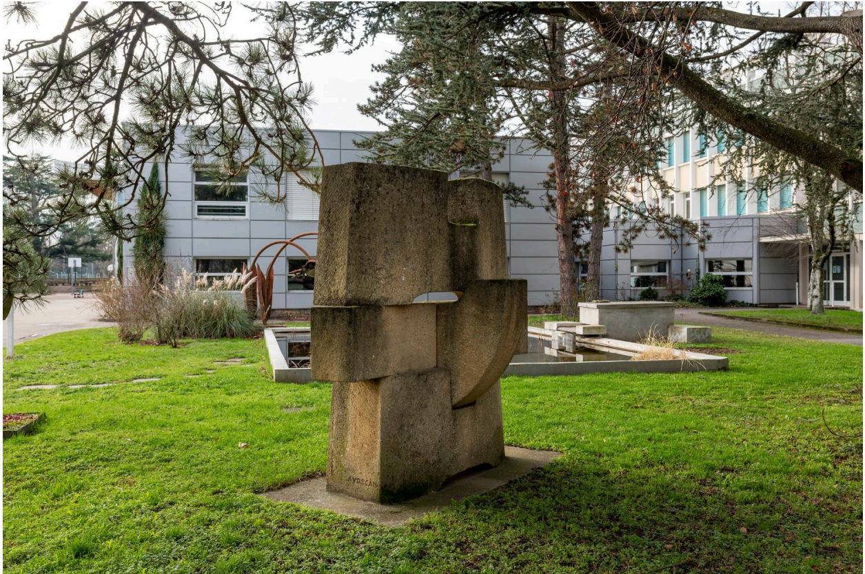
Vue de trois quart dos.