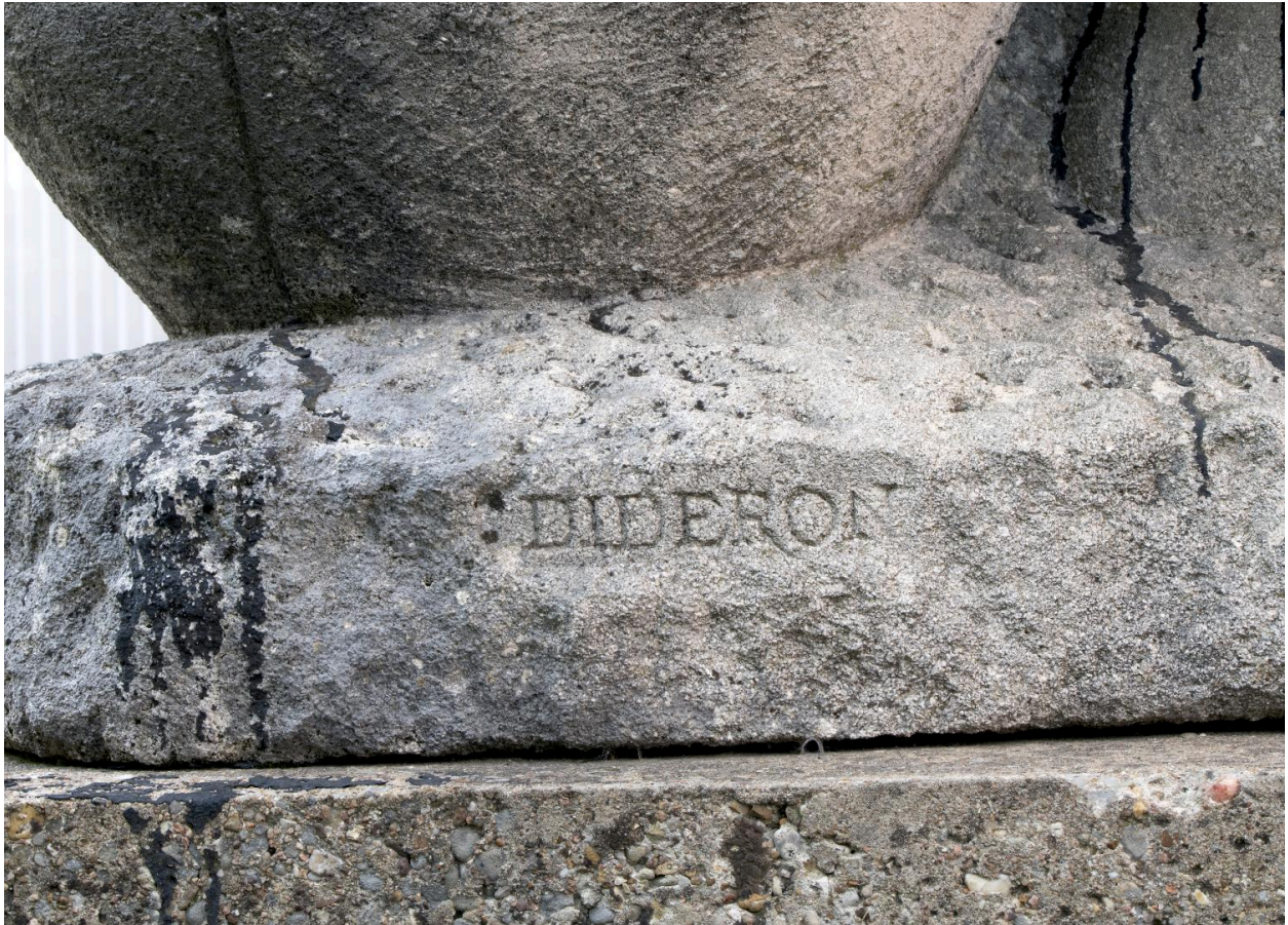
Détail de la signature