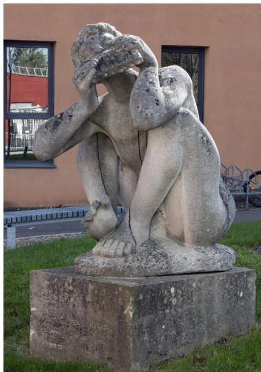
Vue de trois quarts gauche IVR84_20210100305NUCA