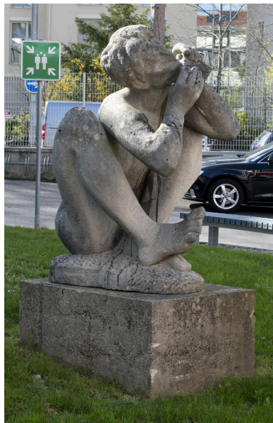
Vue de trois quarts droit IVR84_20210100304NUCA