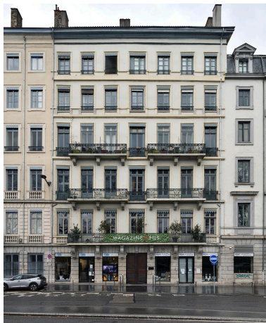
Elévation antérieure IVR84_20246900278NUCAQ