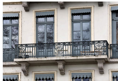
Deuxième étage carré : détail de l'un des balcons IVR84_20246900282NUCAQ