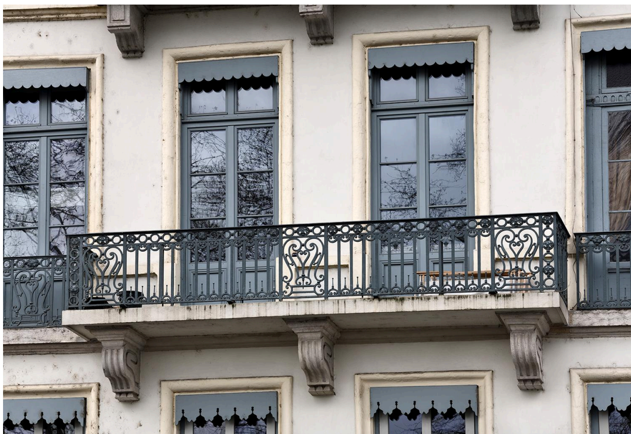
Deuxième étage carré : détail de l'un des balcons