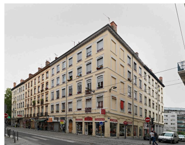
Vue d'ensemble de l'îlot, depuis la rue de Marseille IVR84_20166901454NUCA