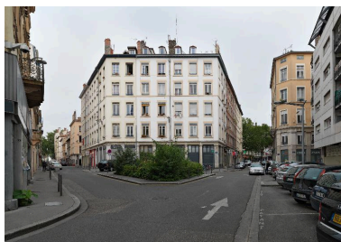
Vue d'ensemble de l'îlot, depuis la place du Commandant-Bulard IVR84_20166901453NUCA