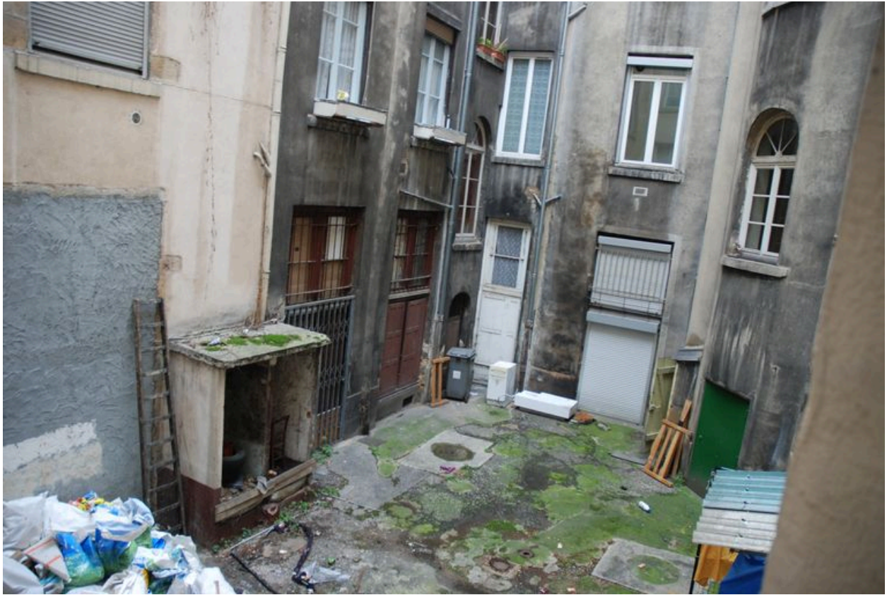
Vue de la cour commune