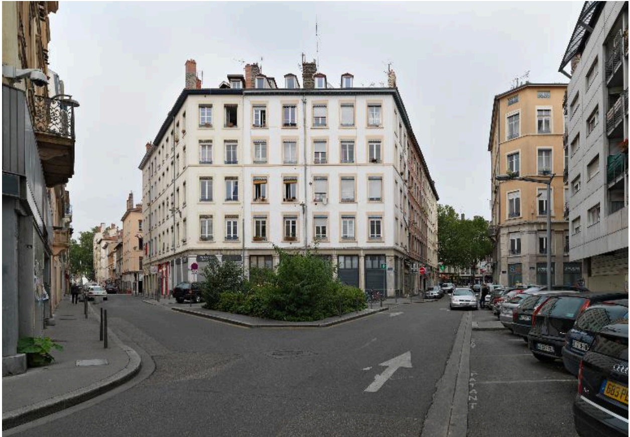
Vue d'ensemble de l'îlot, depuis la place du Commandant-Bulard