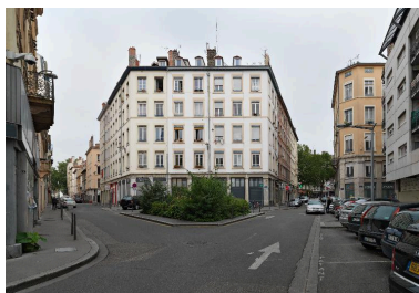
Vue d'ensemble de l'îlot, depuis la place du Commandant-Bulard