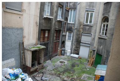
Vue de la cour commune IVR82_20136900015NUCA