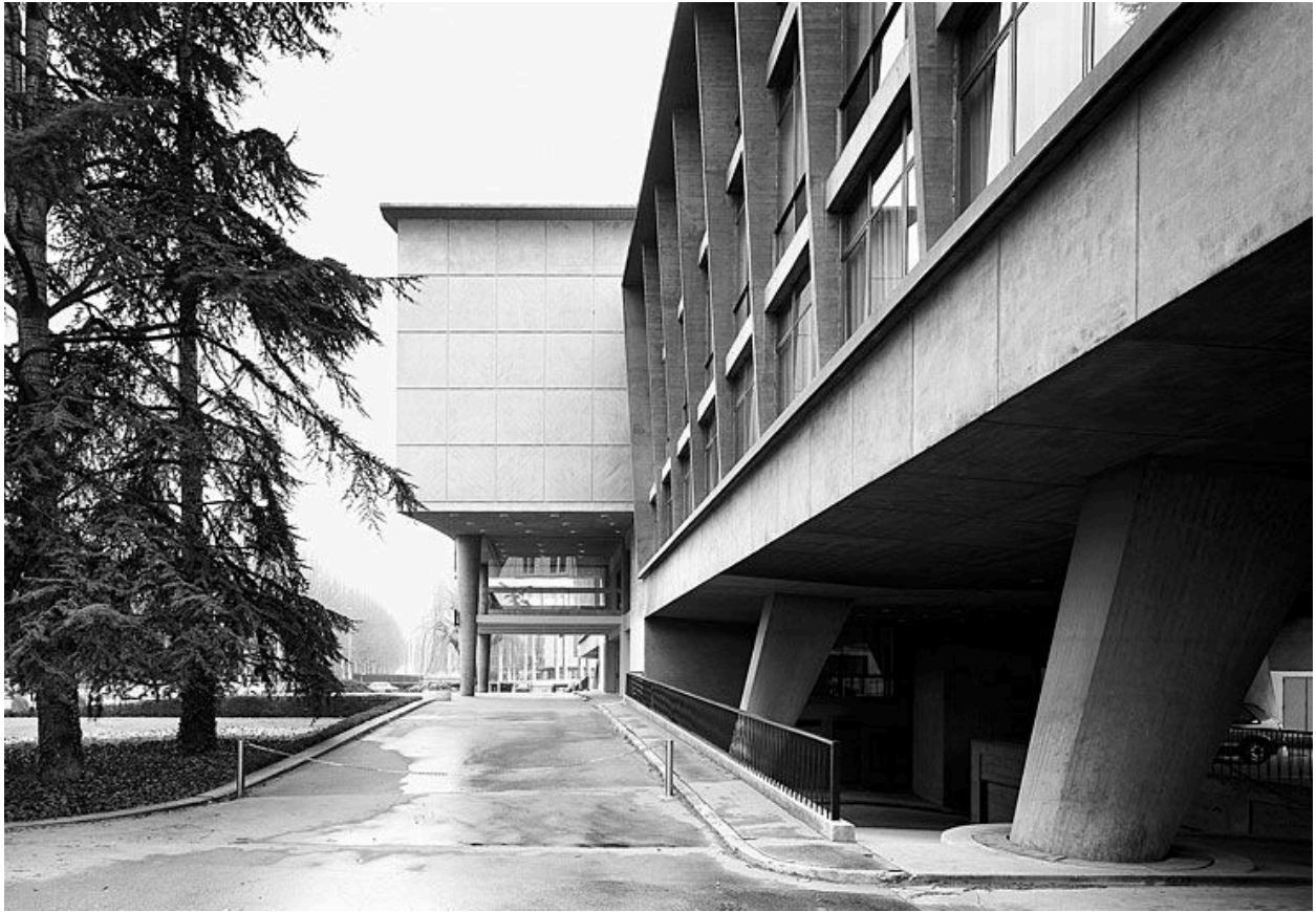
Elévation antérieure : vue de profil