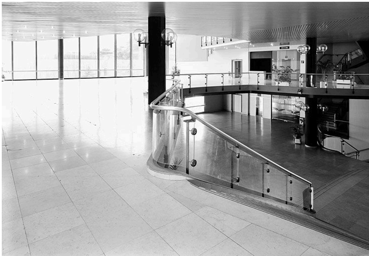
Intérieur, premier étage : vue partielle de l'atrium