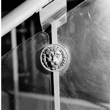
Atrium : agrafe en bronze ornant le garde-corps de l'escalier