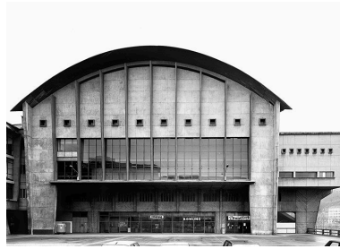
Elévation latérale droite IVR82_19906900033P