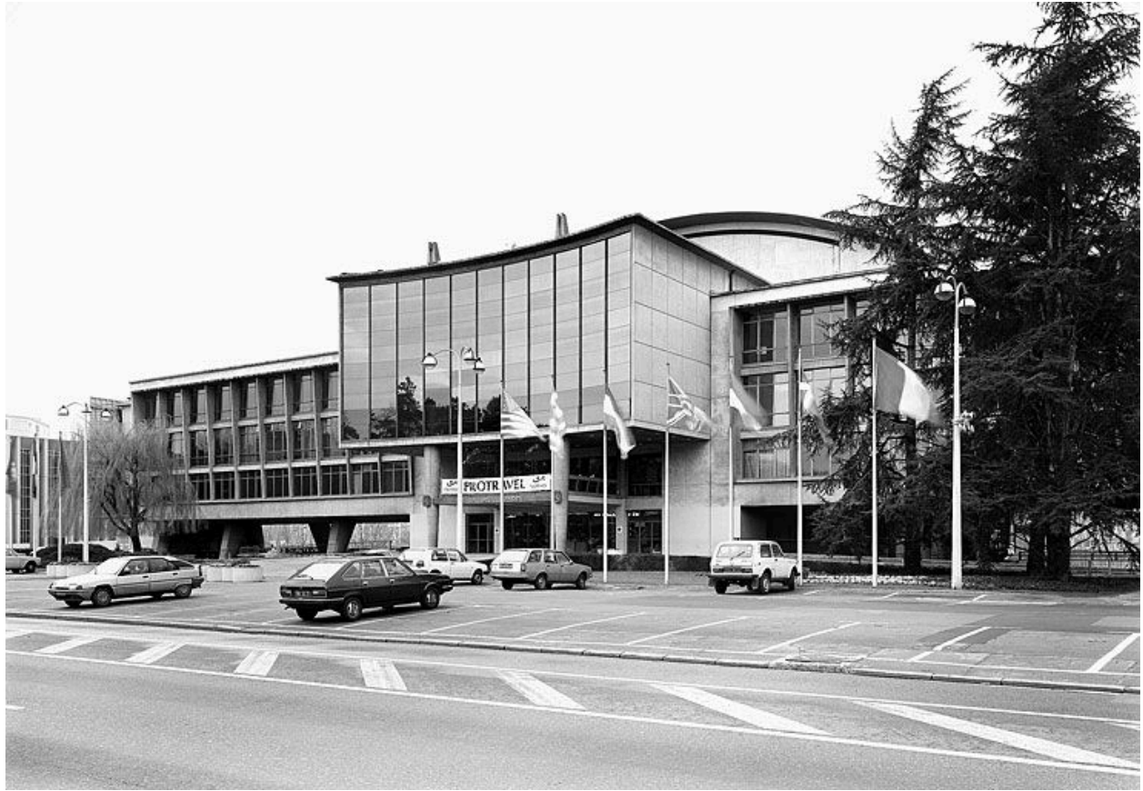
Vue partielle de l'élévation principale