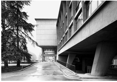
Elévation antérieure : vue de profil IVR82_19906900034P