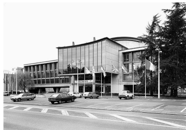
Vue partielle de l'élévation principale IVR82_19906900030P