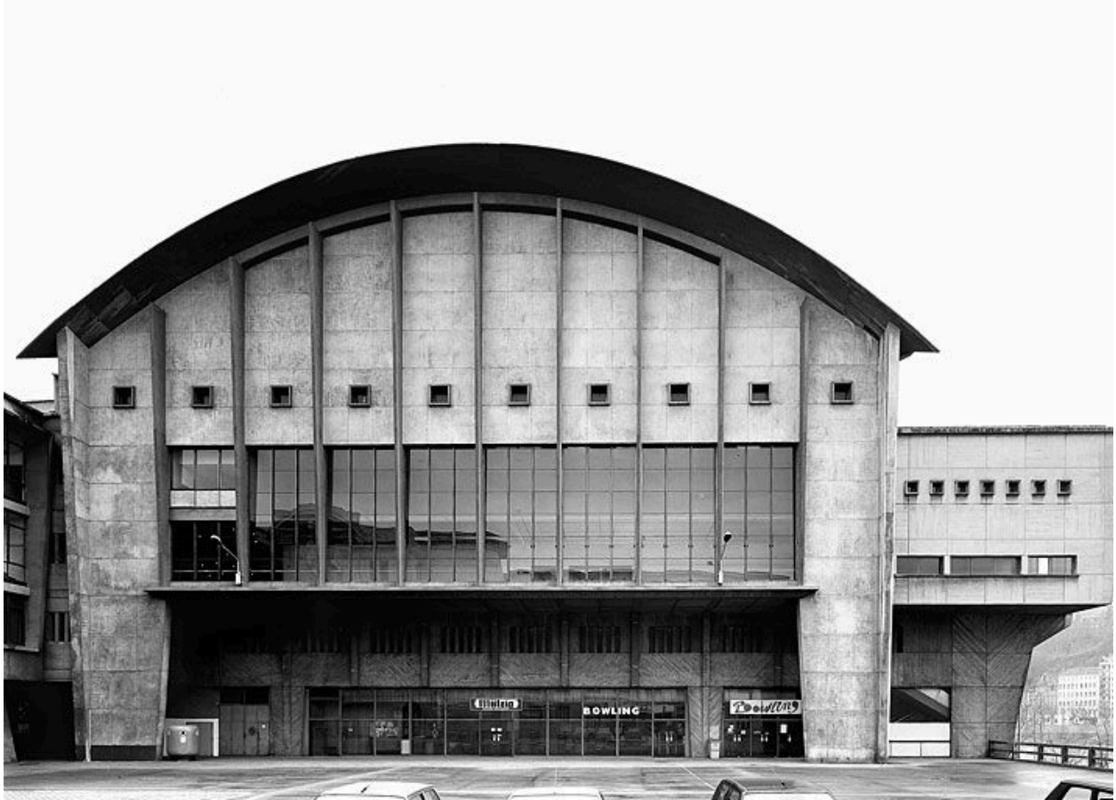
Elévation latérale droite