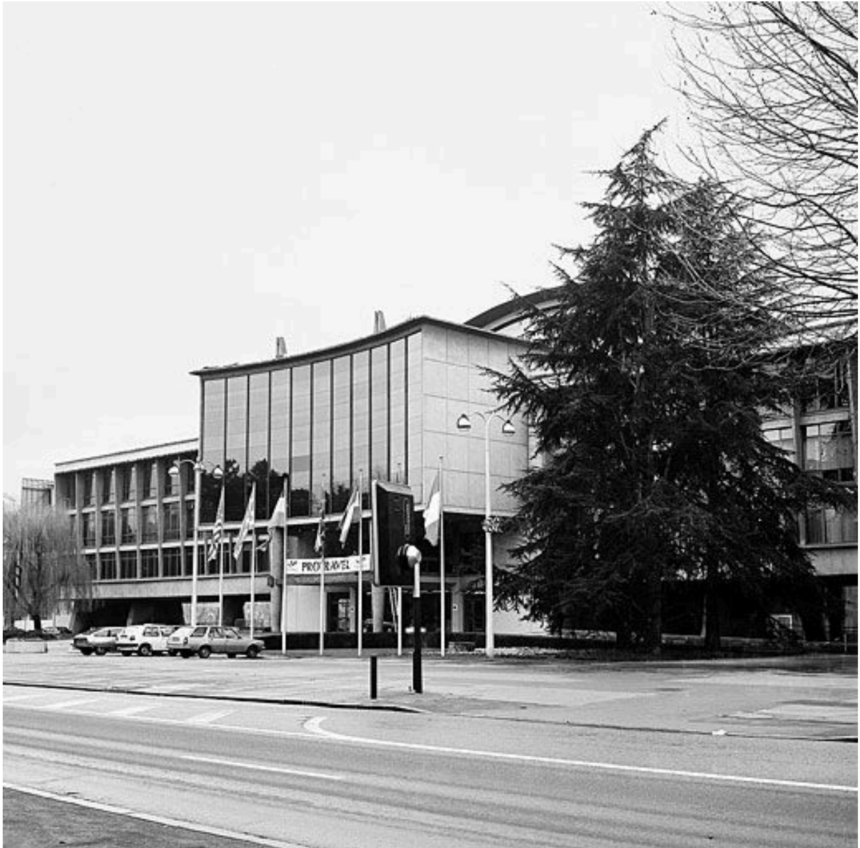
Elévation principale : avant-corps et aile gauche, vue de trois-quarts