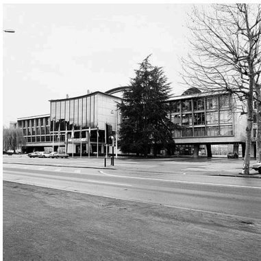
Elévation principale IVR82_19906900031X