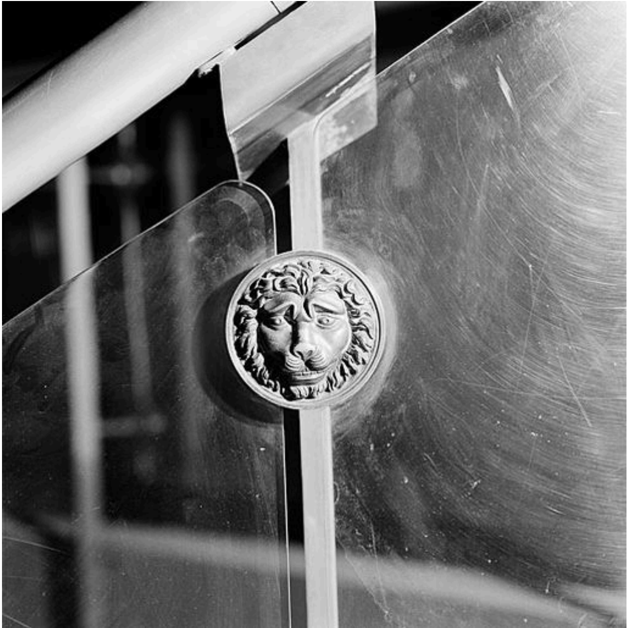
Atrium : agrafe en bronze ornant le garde-corps de l'escalier