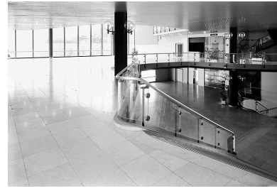
Intérieur, premier étage : vue partielle de l'atrium IVR82_19906900035P