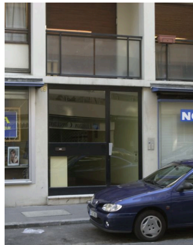
Vue de la porte d'entrée IVR82_20046904999NUCA