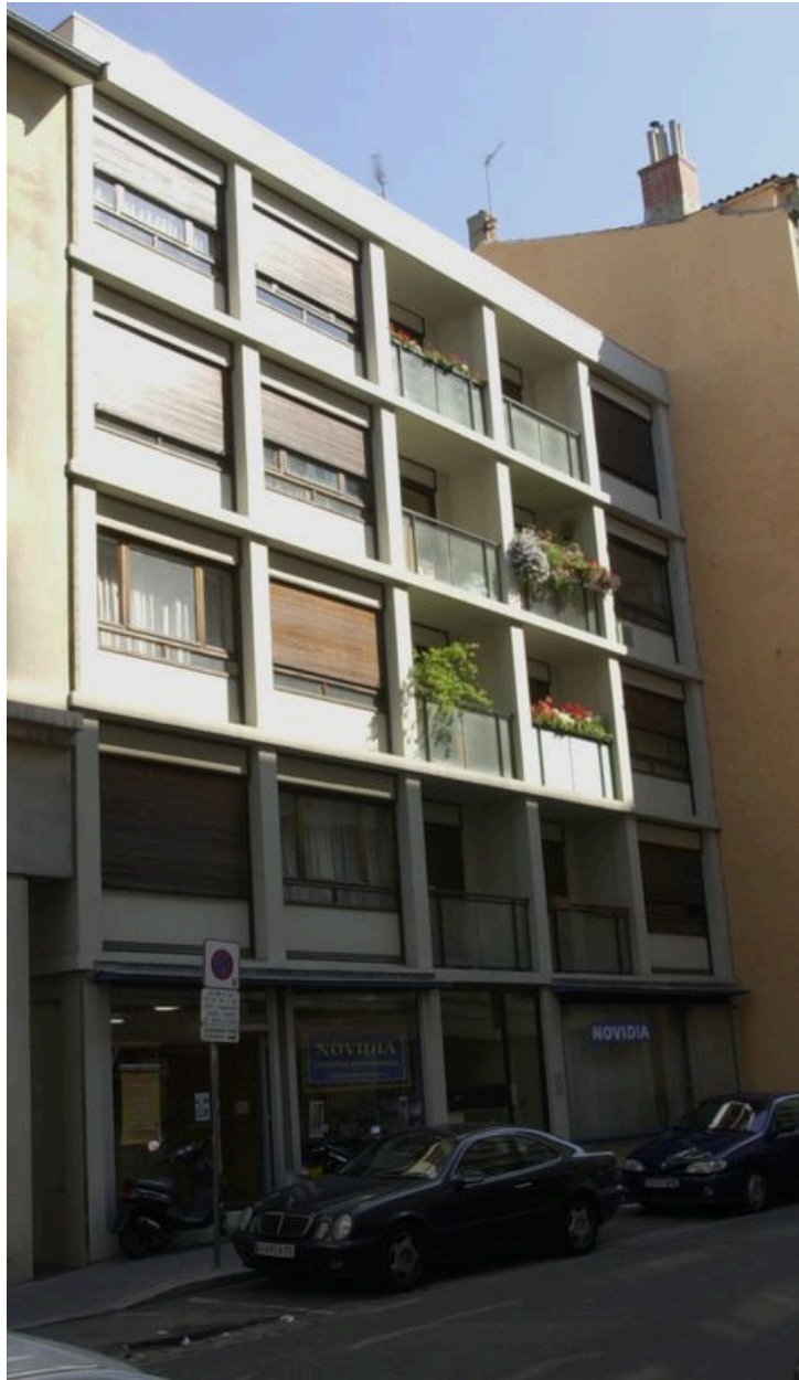
Vue de la façade sur rue