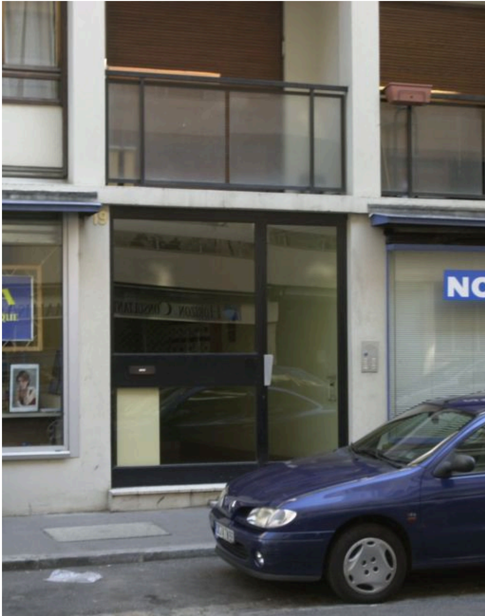
Vue de la porte d'entrée