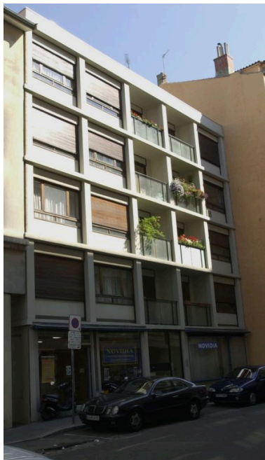
Vue de la façade sur rue IVR82_20046904998NUCA