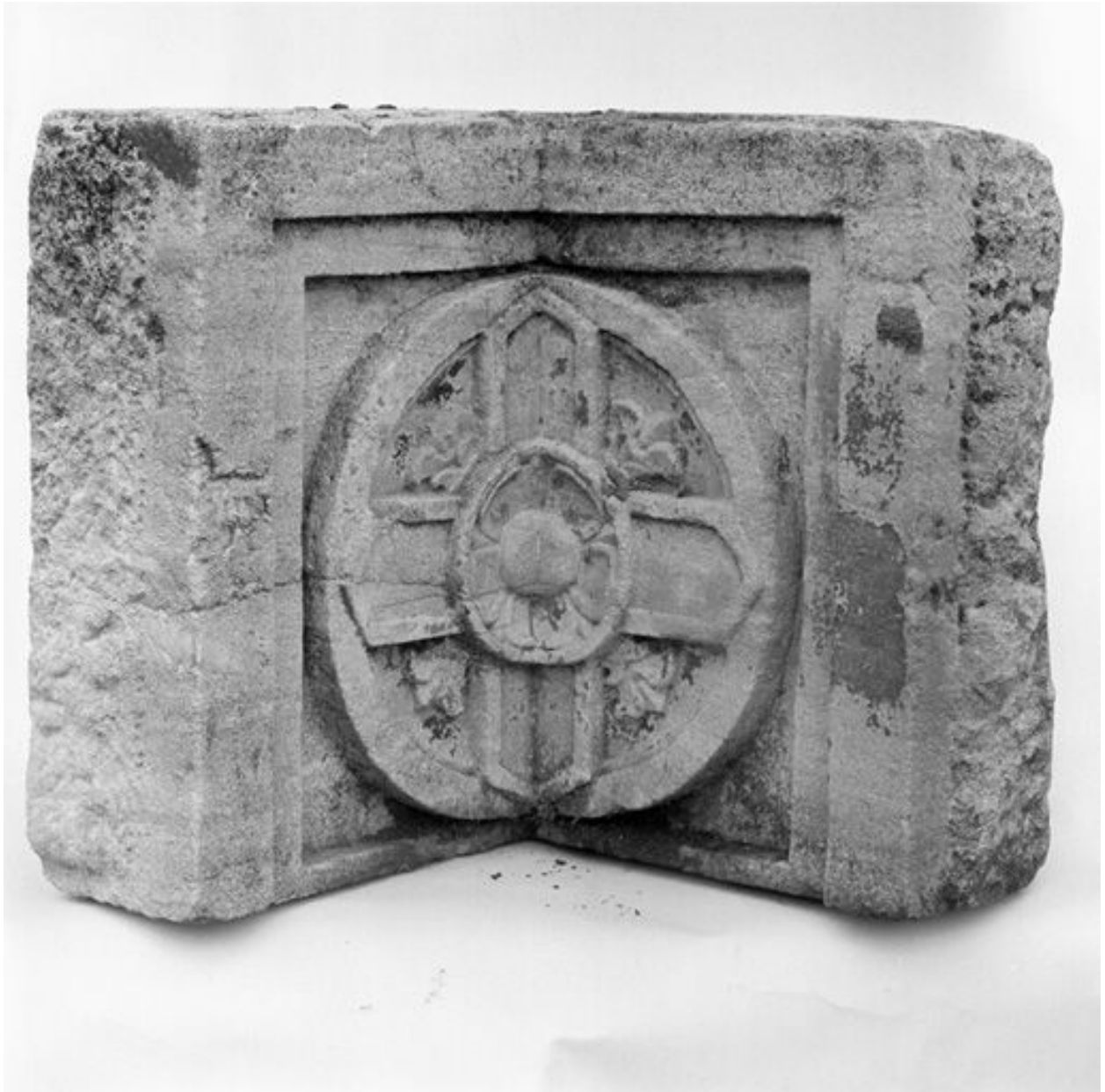
Fragment de frise en angle rentrant qui proviendrait de l'ancienne église du couvent d'observants