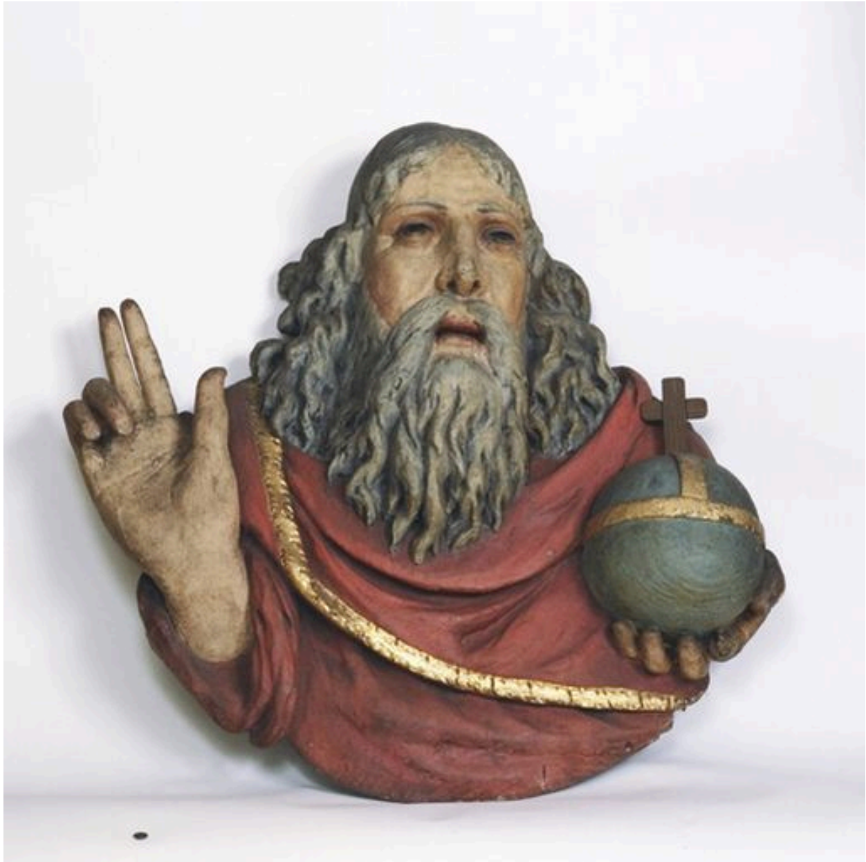
Figure en bois de Dieu le Père qui proviendrait de l'ancienne église du couvent d'observants