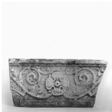
Fragment de frise qui proviendrait de l'ancienne église du couvent d'observants