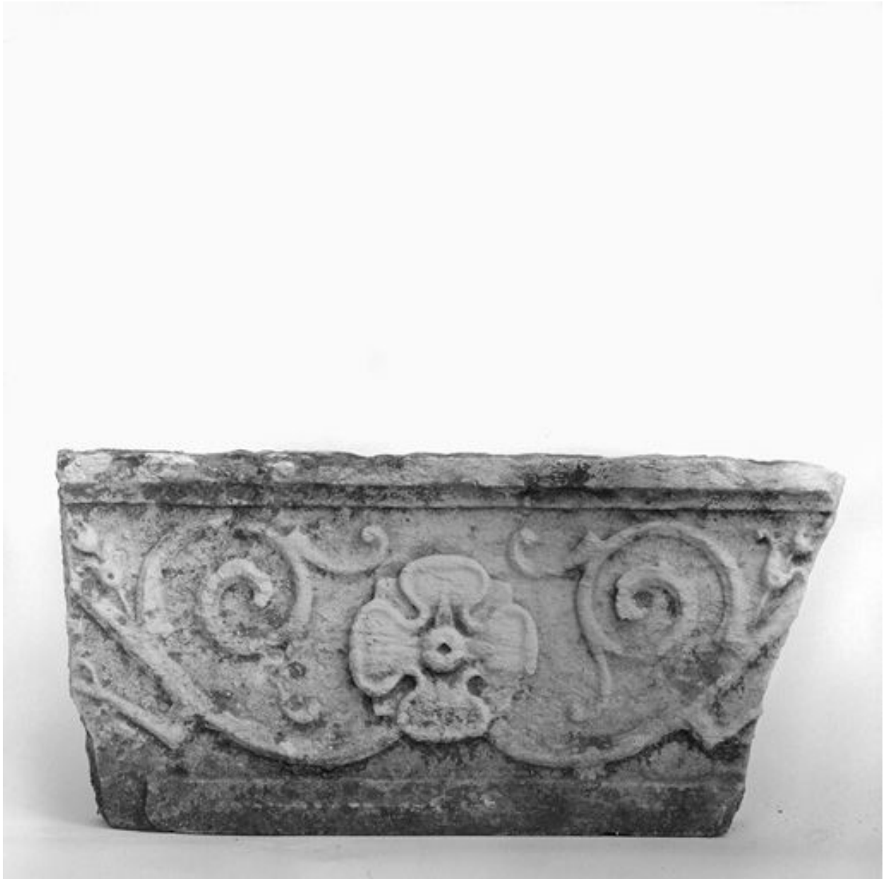
Fragment de frise qui proviendrait de l'ancienne église du couvent d'observants