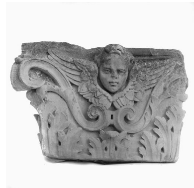
Chapiteau qui proviendrait du couvent d'observants IVR82_19826900055X