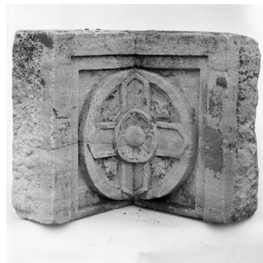
Fragment de frise en angle rentrant qui proviendrait de l'ancienne église du couvent d'observants IVR82_19826900052X