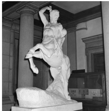
Statue : Centaure IVR82_19776900309X