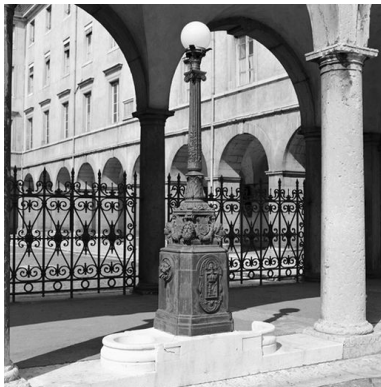
Cour d'honneur, réverbère