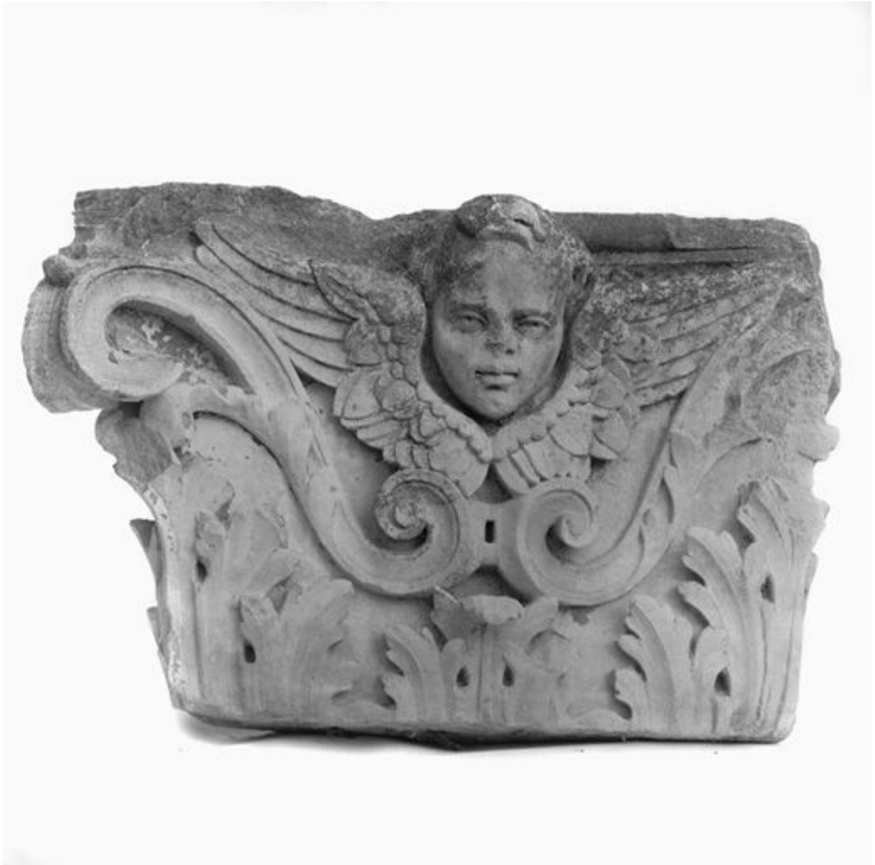
Chapiteau qui proviendrait du couvent d'observants