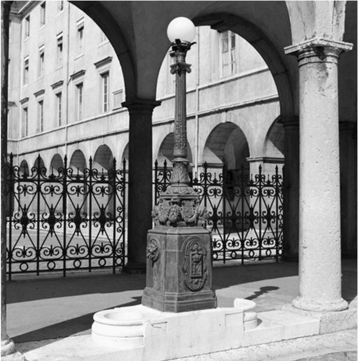
Cour d'honneur, réverbère