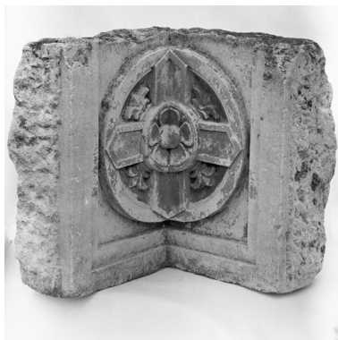
Fragment de frise en angle rentrant qui proviendrait de l'ancienne église du couvent d'observants