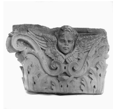
Chapiteau qui proviendrait du couvent d'observants IVR82_19826900055X