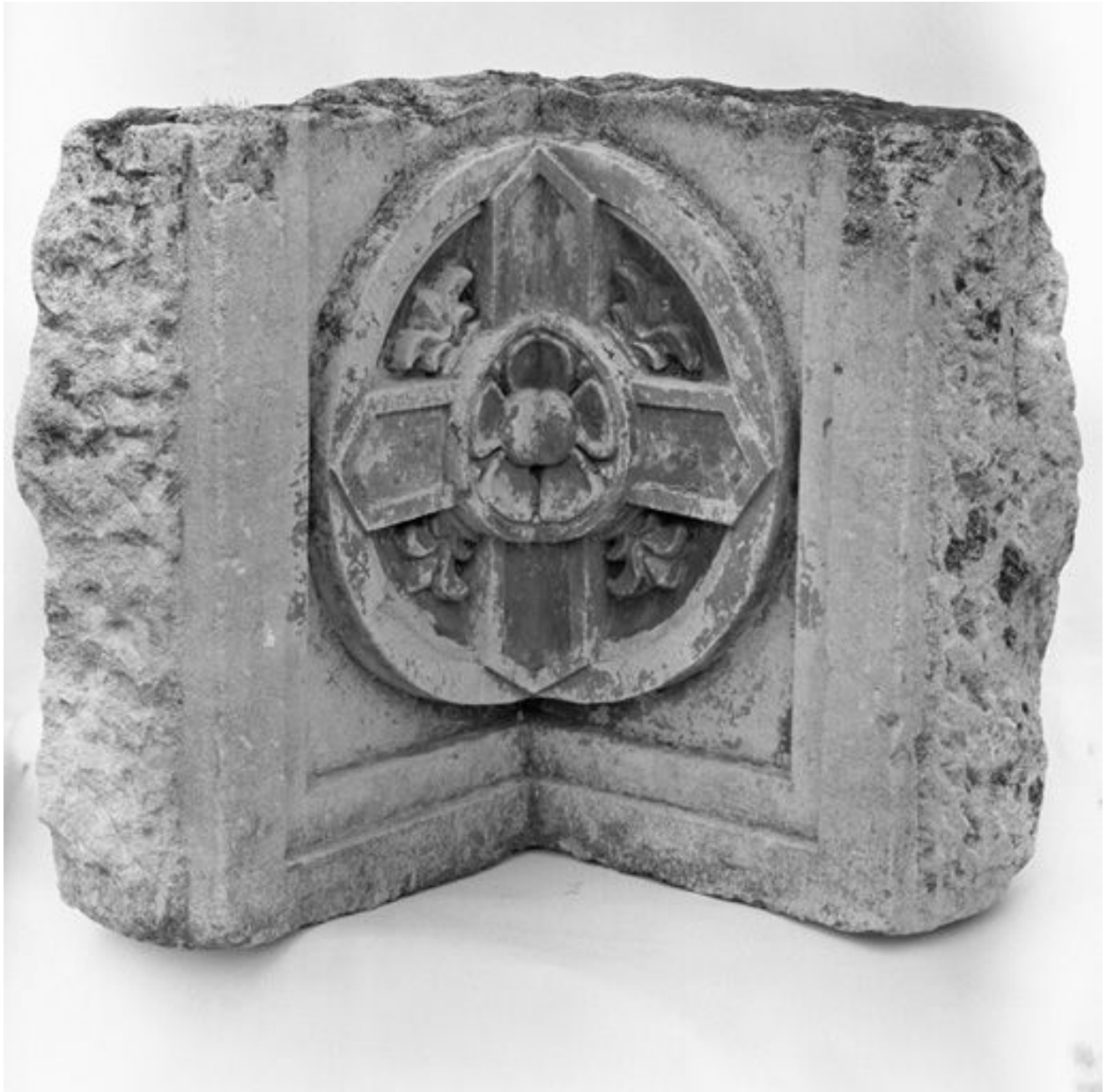
Fragment de frise en angle rentrant qui proviendrait de l'ancienne église du couvent d'observants