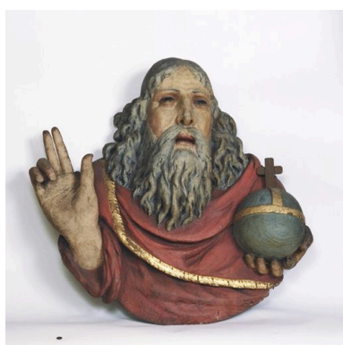
Figure en bois de Dieu le Père qui proviendrait de l'ancienne église du couvent d'observants IVR82_19946900109XA