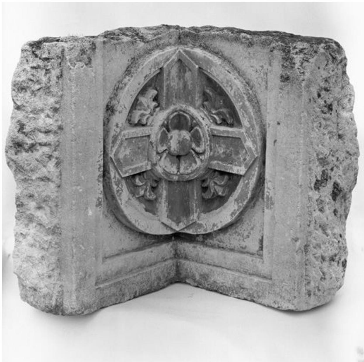
Fragment de frise en angle rentrant qui proviendrait de l'ancienne église du couvent d'observants